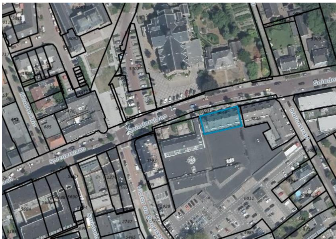
Situering Snieterslaan 59 en belendingen te Bladel.