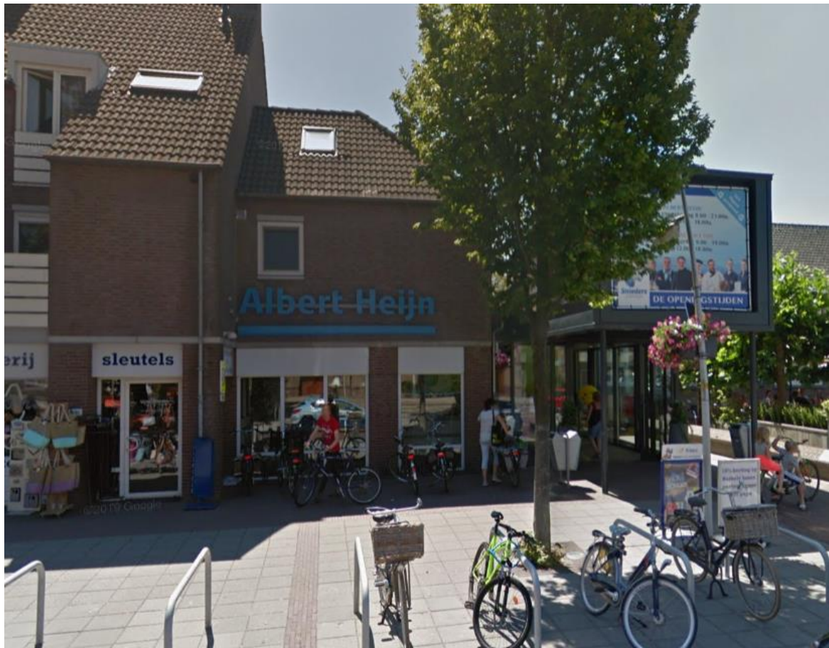
Voorgevels Sniederslaan 59A en 59 (bestaande situatie)

Aan de Sniederslaan 59 te Bladel is momenteel nog een voormalige kantoor- annex kantineruimte gesitueerd boven de Sniederspassage. Door de herstructurering van dit winkelcomplex en met name de uitbreiding van de AH supermarkt aldaar, heeft deze ruimte zijn huidige functie verloren. Door situering en inrichting leent deze ruimte zich bij uitstek om gebruikt te worden als woning.