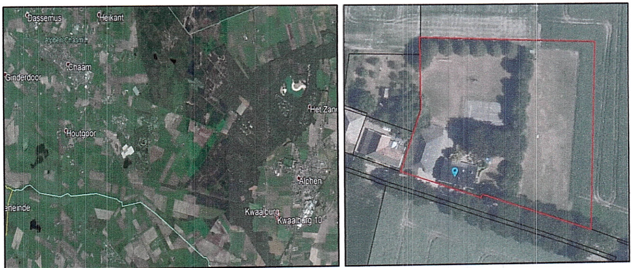
Afbeelding 2: Kwaalburg 10 te Alphen

Onderhavige locatie is gelegen aan de Kwaalburg 10 in Alphen. Alphen maakt onderdeel uit van de gemeente Alphen-Chaam en ligt in het zuiden van de provincie Noord-Brabant. De locatie ligt in het zuiden van Alphen aan een doorgaande weg in het buitengebied en buiten de bebouwde kom.