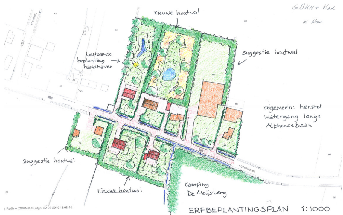
Indicatief Erfbeplantingsplan BiO woningen Alphensebaan