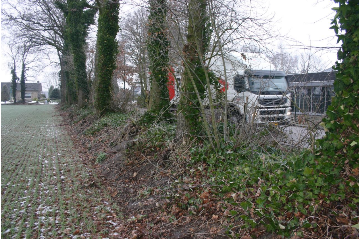
Figuur 5. Op de zuidoostgrens (naast de Kruishoekstraat) bevindt zich een oude houtwal die is begroeid met zomereiken, gewone vlier en klimop.