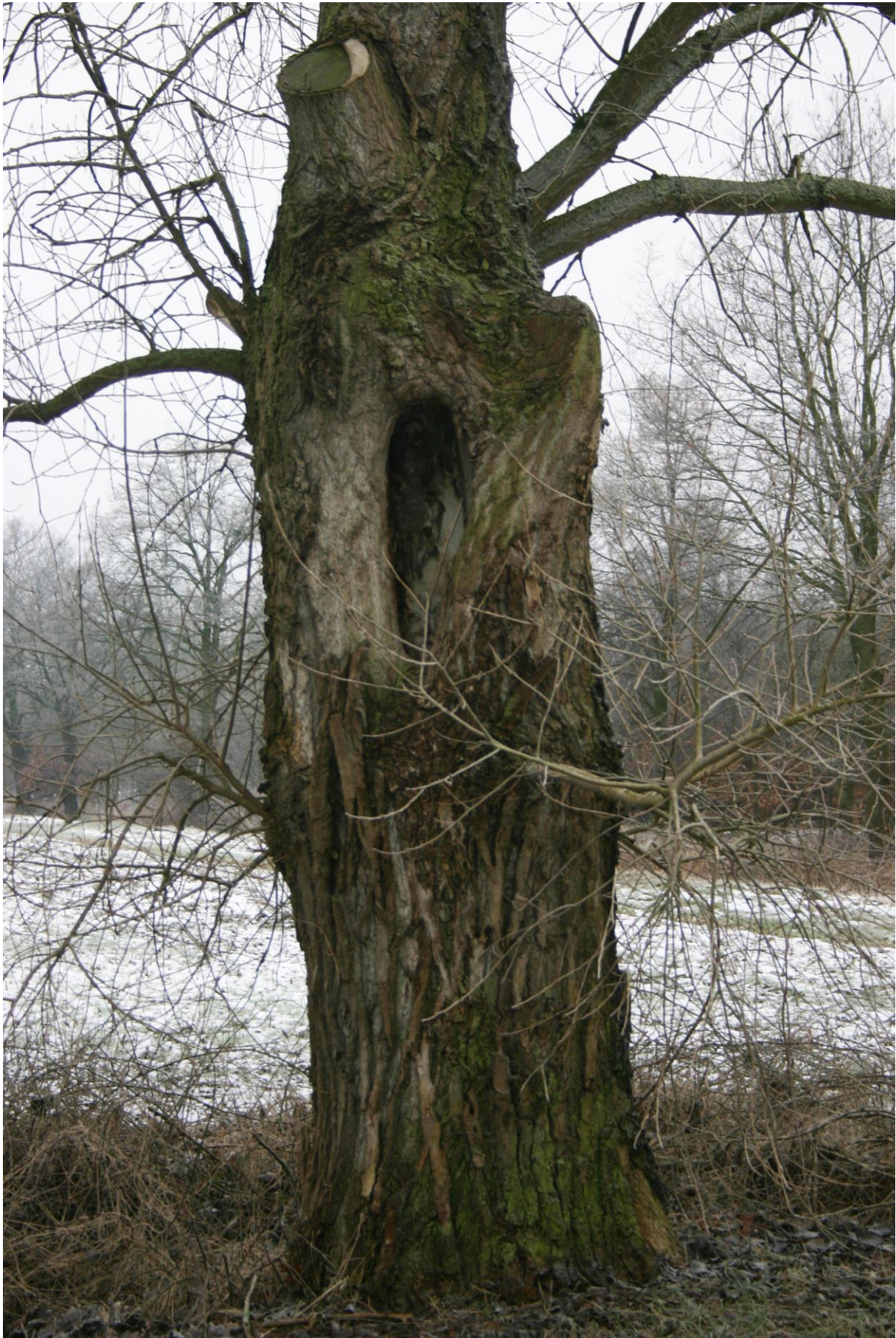
Figuur 3. Holle, geknotte populier naast de Kruisthoekstraat.