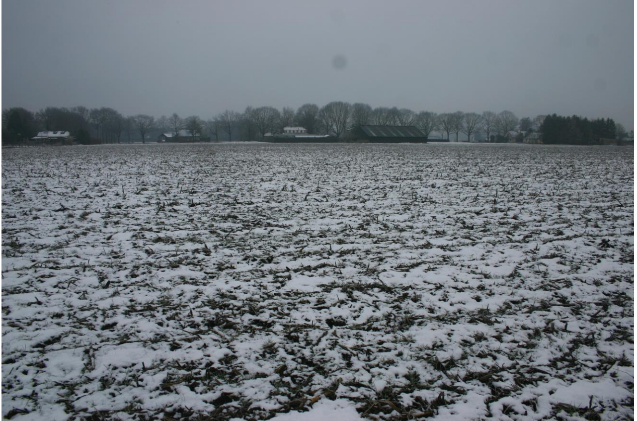
Figuur 3. Het grootste deel van het plangebied is ingericht als maïsakker.