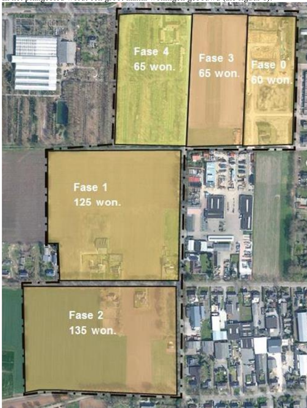
Figuur 1. De beoogde situatie (fase 0 is al gerealiseerd).

In het plangebied wordt een groot aantal woningen gebouwd (zie figuur 1).