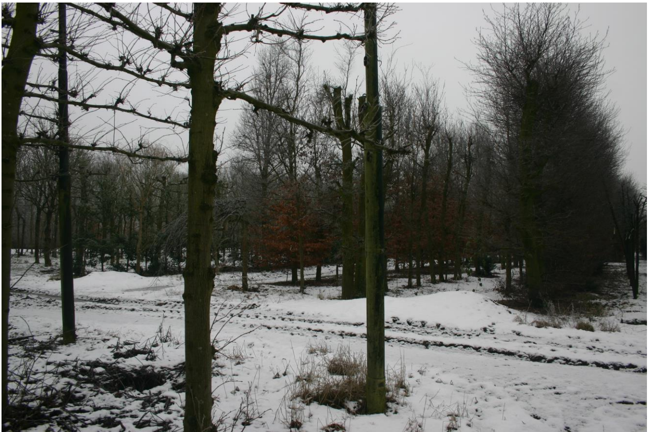
Figuur 4. Het noordwestelijk deel van het plangebied is ingericht als boomkwekerij.