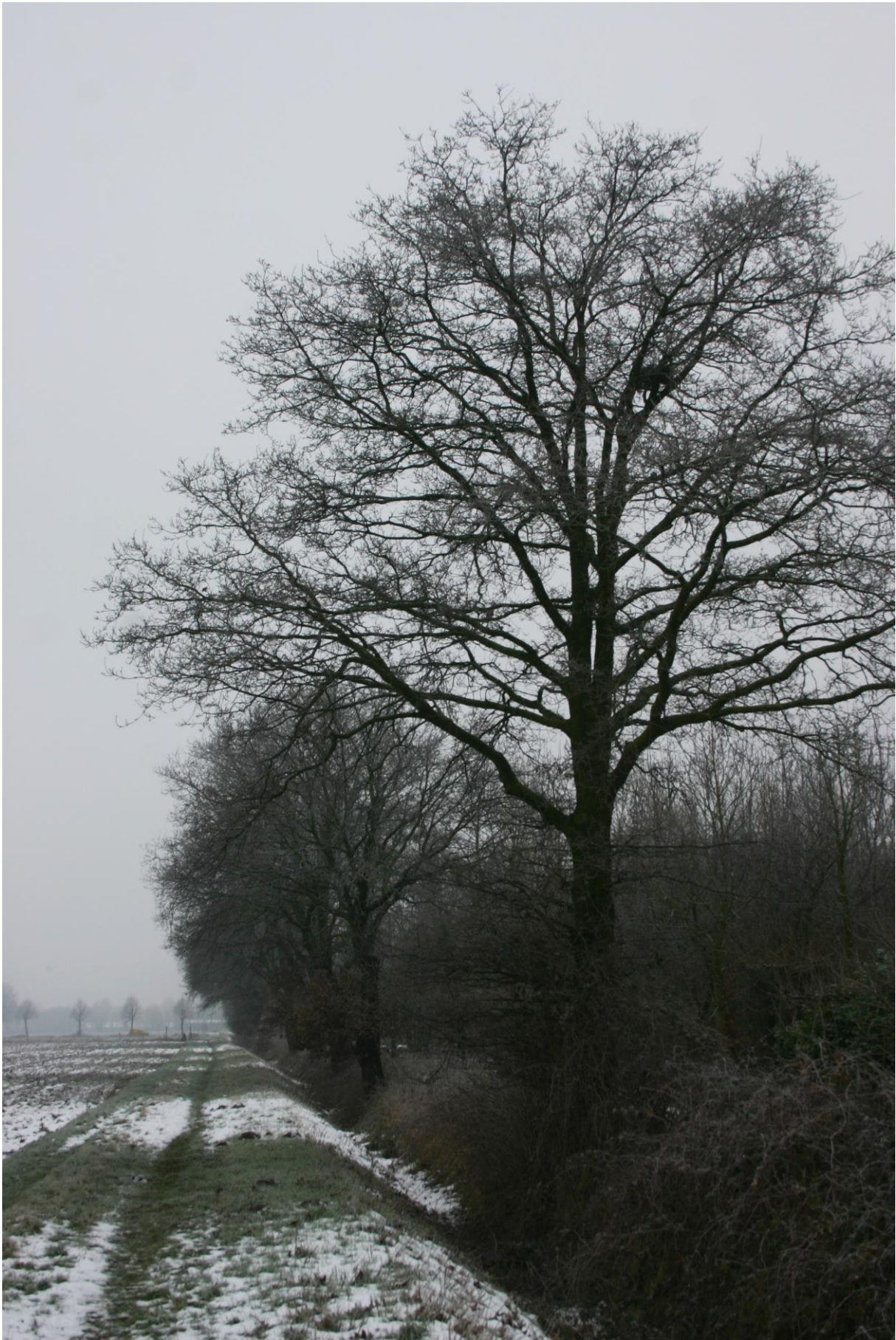
Figuur 2. Buizerdnest in eeuwenoude zomereik.