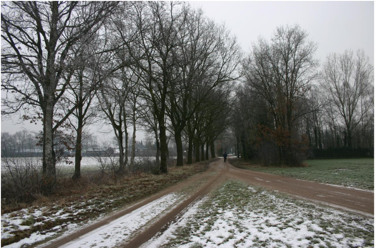
Figuur 6. Houtsingel op de zuidgrens van het plangebied, met zomereik, ruwe berk en braam.