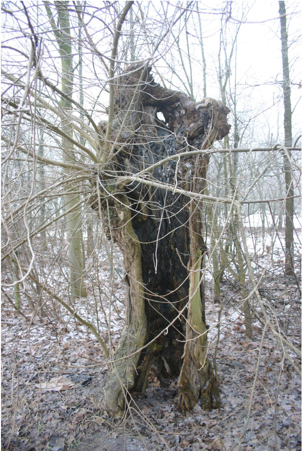
Figuur 1. Volledig uitgerotte knotwilg naast de Kruishoekstraat.