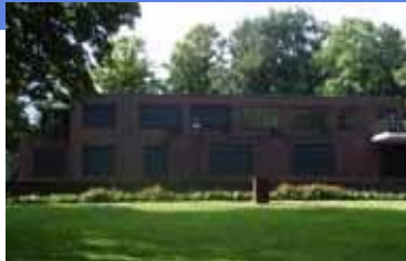
Afbeelding 5: referentiebeelden Het Rieterf