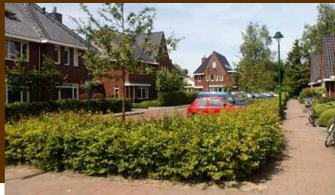
Afbeelding 7: referentiebeelden Openbaar gebied