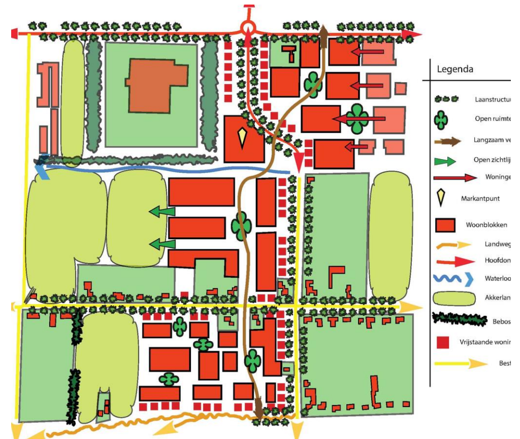
Afbeelding 2: stedenbouwkundige visie De Erven

De Kruishoekstraat sluit rechtstreekse aan op de Cereslaan. Voetgangers en fietsers krijgen een eigen route van noord naar zuid. Dit zorgt voor een ontspannen fiets- en wandelroute door het gebied en naar het centrum.