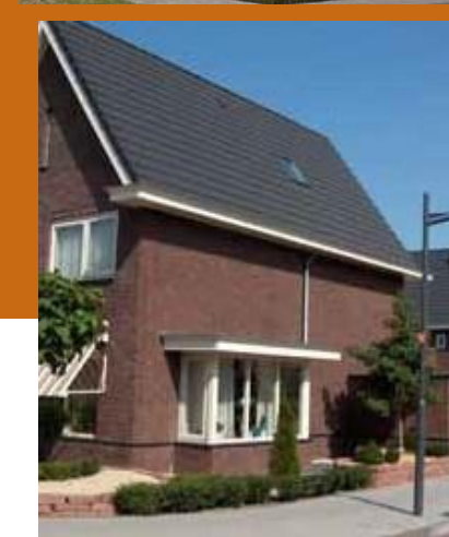
Afbeelding 6: referentiebeelden Het Boserf