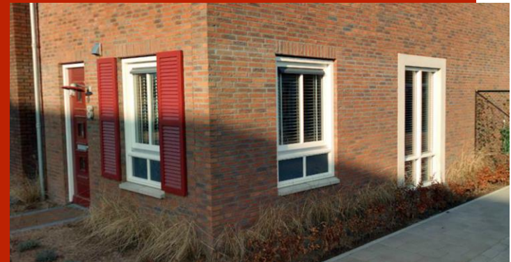
Afbeelding 4: referentiebeelden Het Vlindererf