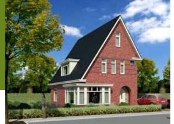
Afbeelding 3: referentiebeelden De Lanen