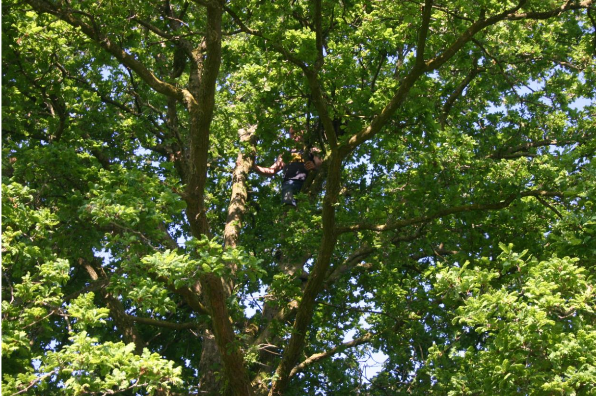
Figuur 3. Inspectie van het nest van bovenaf.