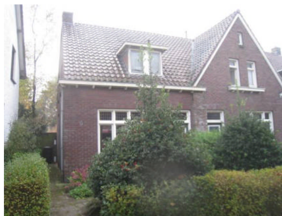
Foto 10: mogelijkheden voor huismussen, gierzwaluwen en vleermuizen