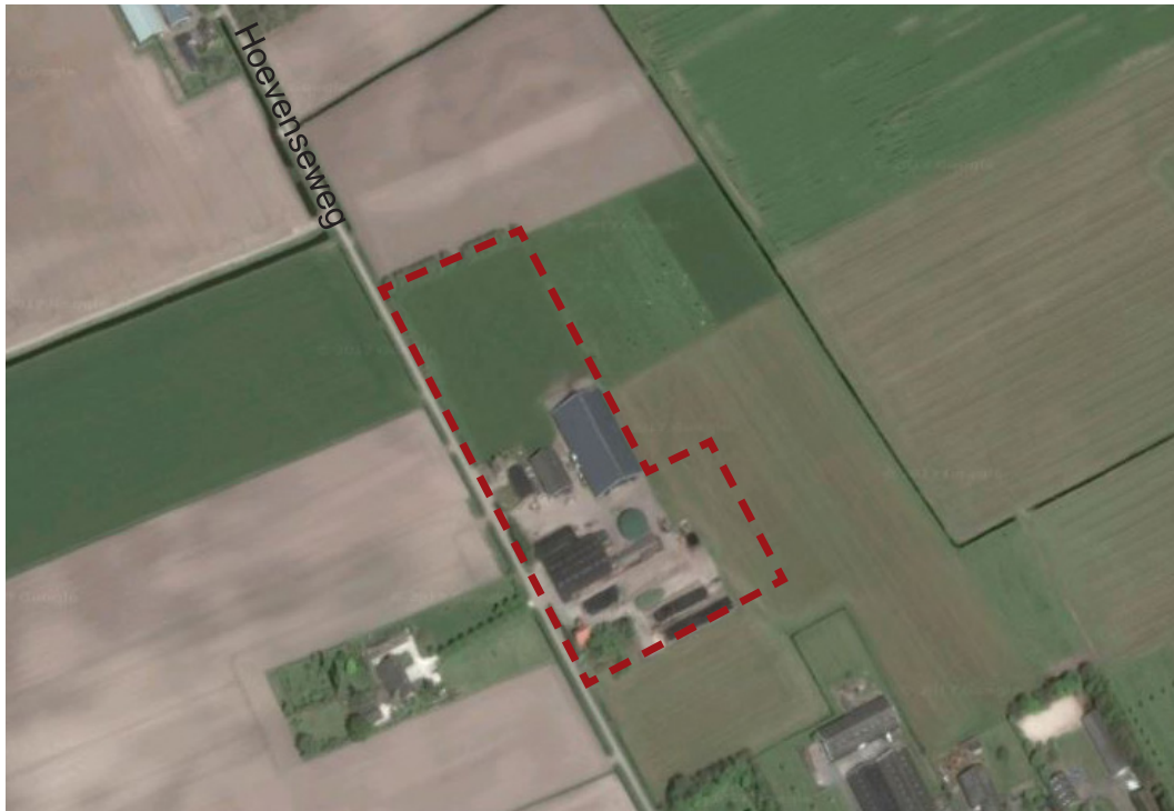
Luchtfoto huidige situatie