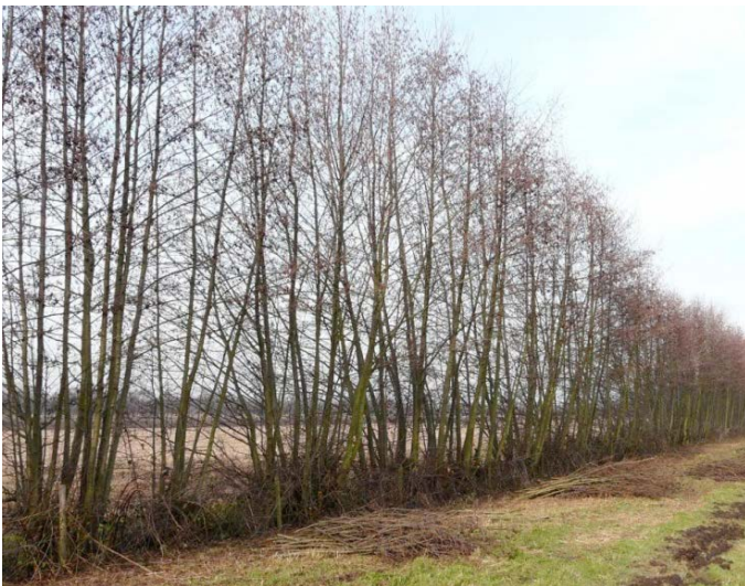
Eenrijige elzensingel, winterbeeld

Zwarte els is een snelle groeier en verdraagt zware snoei. De singel wordt beheerd als hakhout. Dit betekent eens per 10 jaar afzetten tot ongeveer kniehoogte.