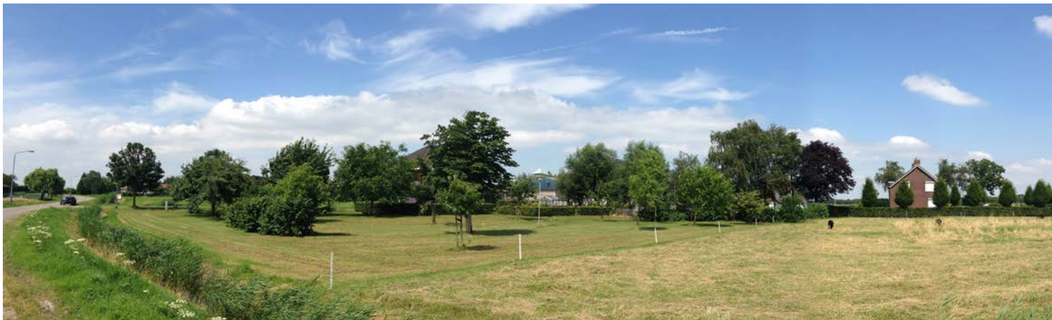
Zicht op de fruitboomgaard ten zuiden van het erf met rechts het oostelijk gelegen woonhuis.

Aan de achterzijde/noordzijde van de uitbreiding dient er langs de waterschapsloot een vijf meter opstakelvrije zone te worden vrijgehouden van beplanting. De elzensingel dient langs deze sloot op minimaal 6,5 meter afstand te worden aangeplant.