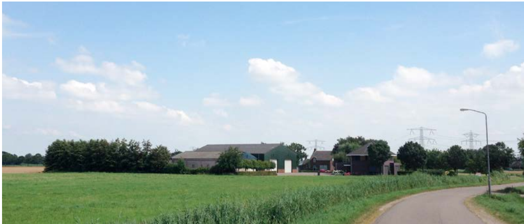
Aanzicht op het bestaande erf vanuit het noordwesten, met links de elzensingel en rechts de flinke beplanting van de fruitboomgaard en de essen langs de toerit.