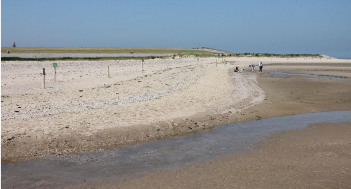
Figuur 2 Beeld van het broedvogelstrand ter hoogte van (zie voor aanduiding locatie tevens figuur 1)

De afscherpende werking van de in 2011 uitgediepte geul is door verzanding alweer deels verdwenen. Recreanten verblijven regelmatig op korte afstand van het afgezette broedvogelstrand, links op de foto in figuur 2. Het in stand houden van de bufferzone tussen geul en broedvogels is daarom gewenst.