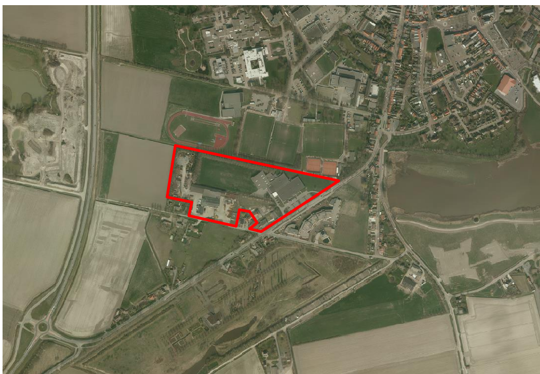
Afbeelding 8: Ligging en begrenzing bedrijventerrein Oostburg – Brugse Vaart

Ten zuidwesten van de kern Oostburg bevindt zich het bedrijventerrein Brugse Vaart. Op het bedrijventerrein aan de Nieuwstraat / Brugsevaart zijn enkele bedrijven gevestigd, waaronder een grootschalige detailhandel in meubelen. Zie afbeelding 8 voor een weergave van de ligging en begrenzing van dit deelgebied.