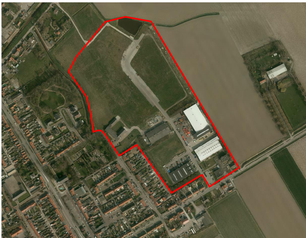
Afbeelding 10: Ligging en begrenzing bedrijventerrein Schoondijke

rechte wegen en in het centrumgebied een vierkant dorpsplein. De kern Schoondijke bestaat in overwegende mate uit woonbebouwing. Daarnaast komen met name rondom de rotonde en het dorpsplein centrumvoorzieningen voor. Verspreid langs het assenkruis bevinden zich enkele bedrijven.