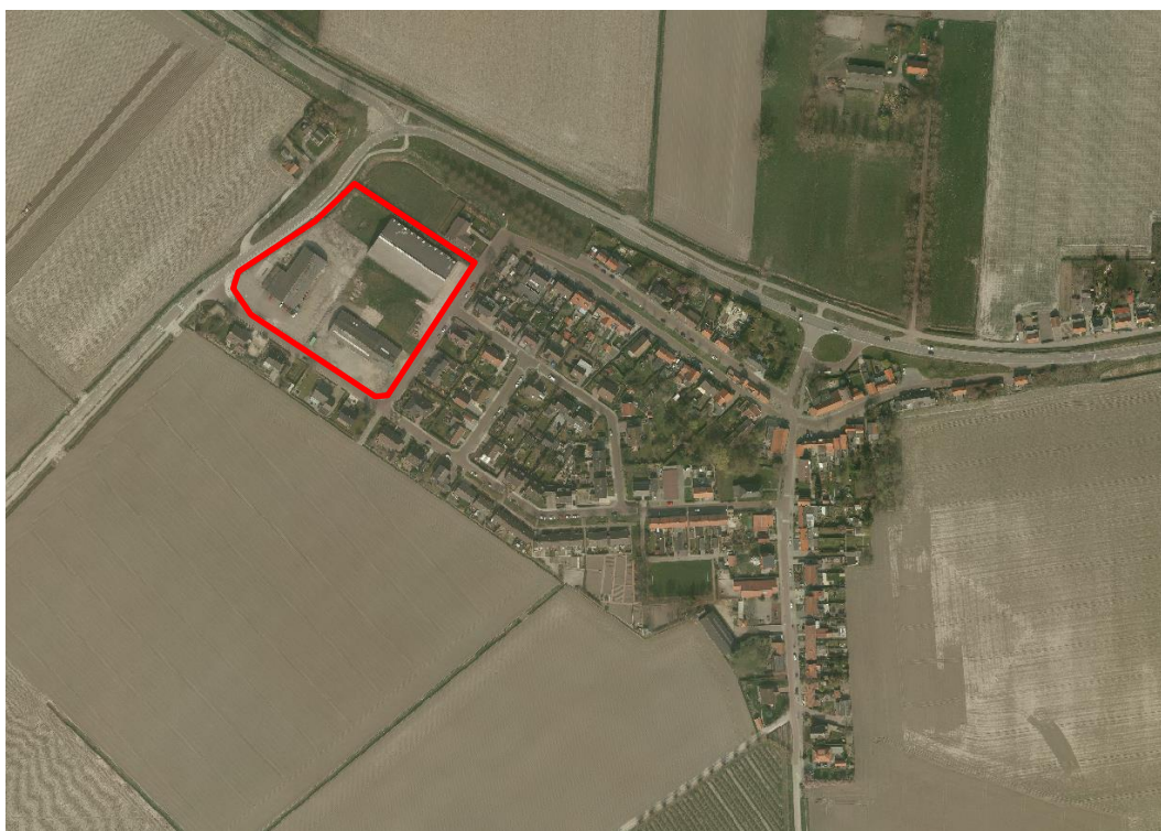
Afbeelding 13: Ligging en begrenzing bedrijventerrein Waterlandkerkje

Aan de uiterste westrand van de kern is een kleinschalig bedrijventerrein gelegen. Op dit terrein zijn drie bedrijven gesitueerd. Zie afbeelding 13 voor een weergave van de ligging en begrenzing van dit deelgebied.