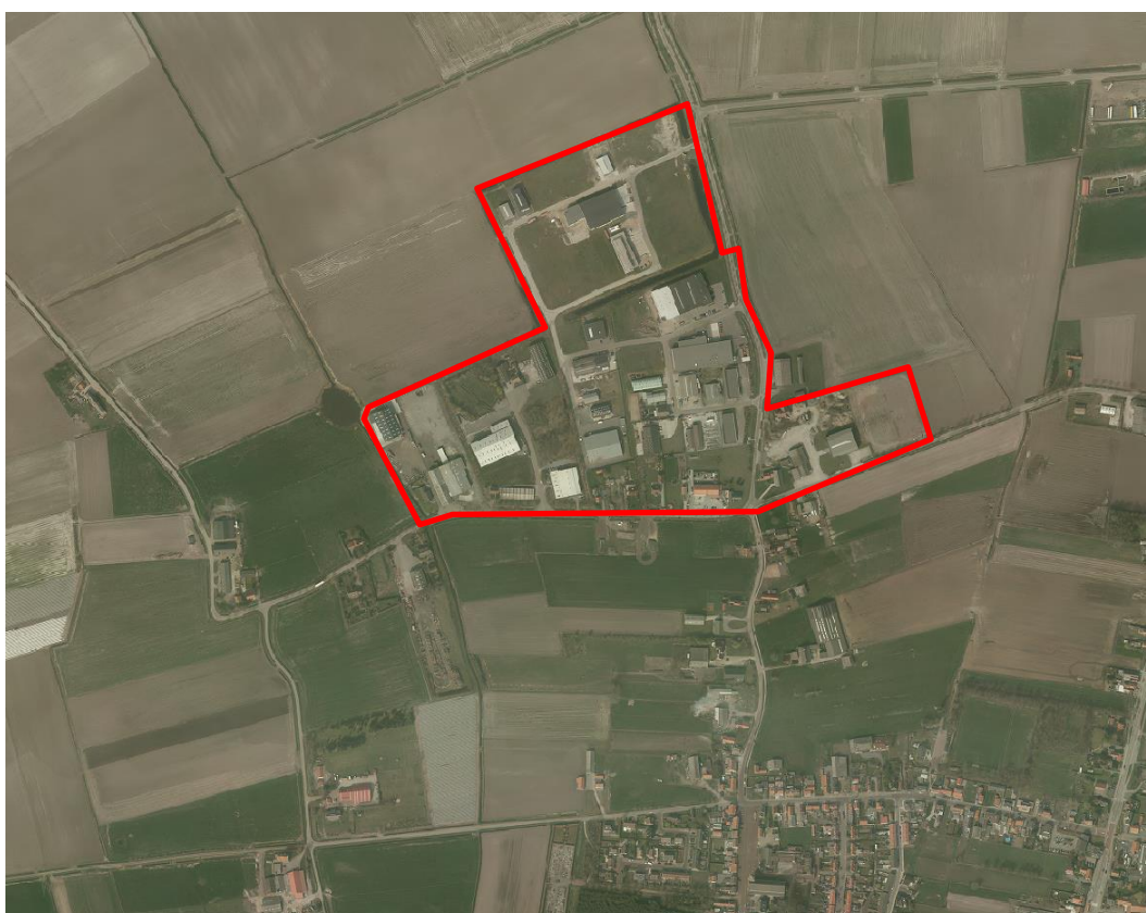
Afbeelding 5: Ligging en begrenzing bedrijventerrein Eede

Eede is genoemd naar het riviertje de Ee, dat in de Middeleeuwen ontsprong nabij Maldegem, langs Aardenburg stroomde en ten noorden van het tegenwoordige Draaibrug in het Zwin uitmondde. Het riviertje is thans vrijwel geheel verdwenen. De nederzetting Eede is ontstaan op het punt waar de Brieverstraat en het riviertje de Ee elkaar kruisten. De ruimtelijke opbouw van Eede is mede bepaald door het beloop van het riviertje de Ee. Dit is nog duidelijk herkenbaar in de noord-zuid lopende structuur van het Dorpsplein en de Scheidingstraat. In het hart van de kern is meer aaneengesloten bebouwing aanwezig, naar de randen toe wordt de bebouwingsstructuur meer open. Dit komt duidelijk tot uitdrukking aan de Scheidingstraat. Juist aan de randen van de kern komt vrij veel lage bebouwing voor. Dit vormt een goede overgang naar het open agrarisch gebied.