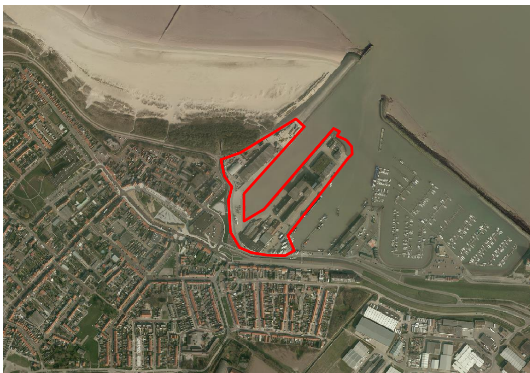
Afbeelding 3: Ligging en begrenzing bedrijventerrein Breskens - Haventerrein

Het bedrijventerrein Haventerrein bevindt zich ten noorden van de kern Breskens. De gevestigde bedrijven op de Kaai, Haven Westzijde, Oosthavendam en Middenhavendam zijn voor een belangrijk deel op het water georiënteerd en gerelateerd aan de visserij. Zo bevinden zich op de Kaai voornamelijk aan de vismijn gekoppelde visgroothandel en visoverslagbedrijven. Op de Haven Westzijde is sprake van zand- en grindoverslag, opslag van scheepsbenodigdheden en opslag van bouwmaterialen. Op de Middenhavendam zijn enkele scheepsbouwbedrijven en een mastenbouwbedrijf gevestigd. Hier vormt Cebeco Zuid-West (opslag en verwerking van granen en peulvruchten) het voor het bedrijventerrein beeldbepalende bedrijf door de aanwezigheid van twee silo's van resp. 28 en 38 meter hoogte. Inmiddels is dit bedrijf gestopt in de haven van Breskens en staan de gebouwen leeg. Zie afbeelding 3 voor een weergave van de ligging en begrenzing van dit deelgebied.