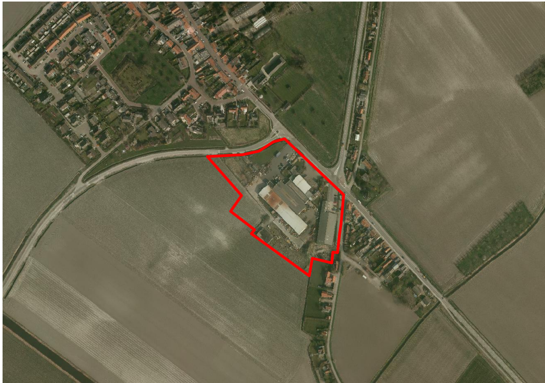
Afbeelding 4: Ligging en begrenzing bedrijventerrein Cadzand

Ten zuidwesten van de Mariastraat bevindt zich het bedrijventerrein van de kern Cadzand. Op het terrein zijn enkele bedrijven gevestigd. Zie afbeelding 4 voor een weergave van de ligging en begrenzing van dit deelgebied.