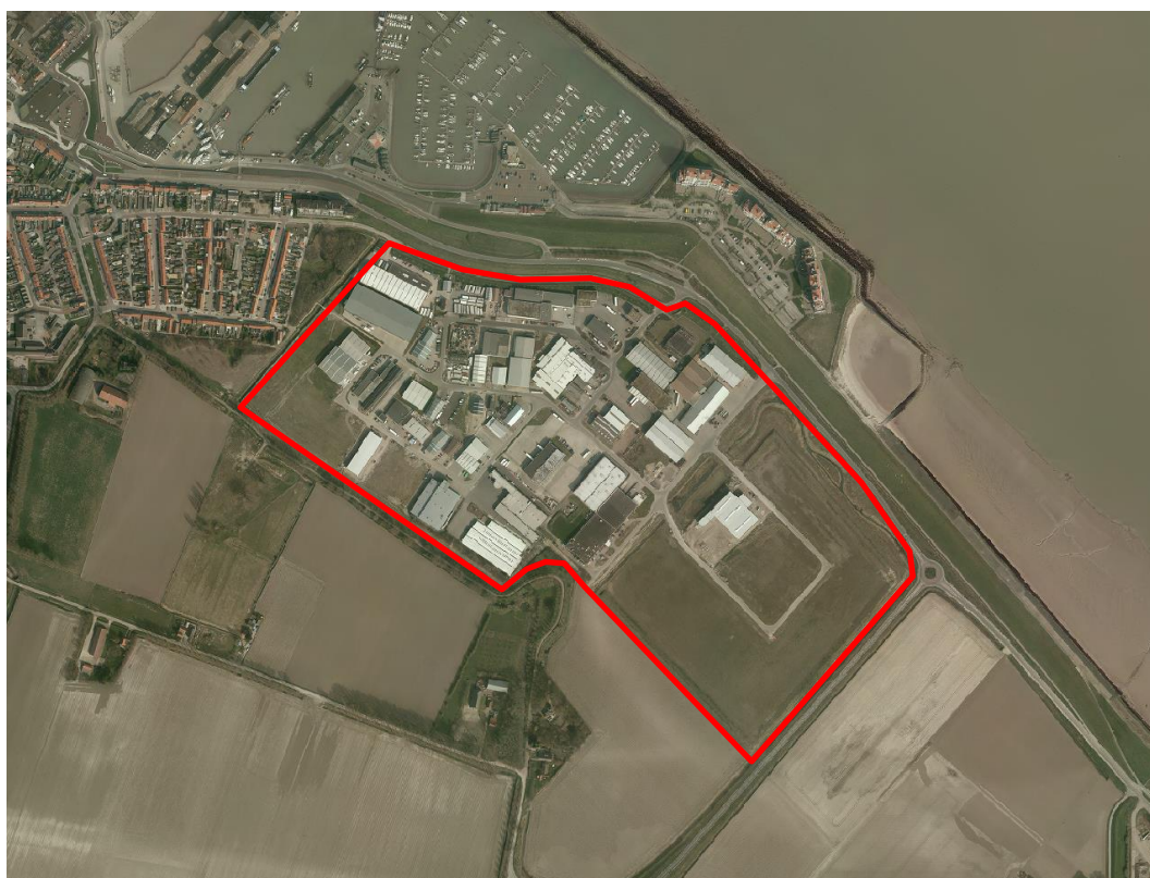
Afbeelding 2: Ligging en begrenzing bedrijventerrein Breskens - Deltahoek

Vanuit de T-vormige hoofdassen is de kern geleidelijk gegroeid. De oudste gevarieerde bebouwing ligt langs en evenwijdig aan de structuurassen. Aan weerszijden van de Dorpsstraat liggen de eerste planmatige woongebieden. Het gebied aan de oostzijde is het oudst. Aan de westzijde is de bebouwing grotendeels naorlogs. De N676 aan de westkant en het Molenwater aan de zuidoostzijde vormen de globale begrenzing van deze groeiperiode. Aan de oostkant schermt een parkstrook het woongebied af van het bedrijventerrein Deltahoek.