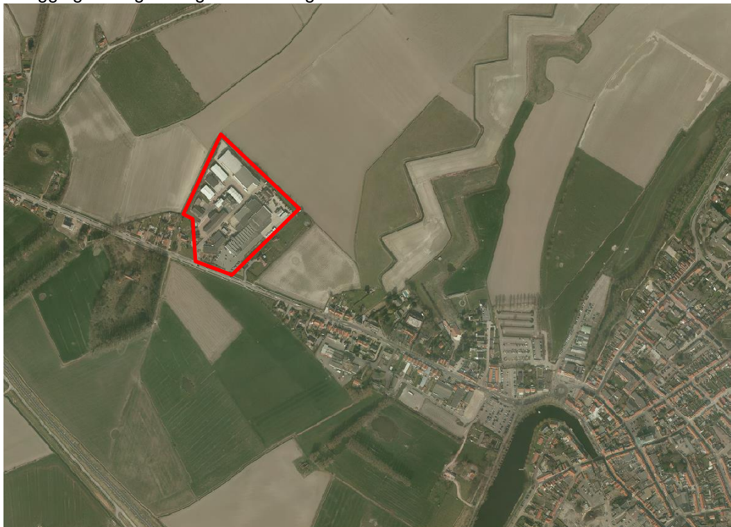
Afbeelding 11: Ligging en begrenzing bedrijventerrein Sluis – Sint Annastraat

Ten westen van de kern Sluis bevindt zich aan de Sint Annastraat een kleinschalig bedrijventerrein. Dit terrein is volledig uitgegeven. Zie afbeelding 11 voor een weergave van de ligging en begrenzing van dit deelgebied.