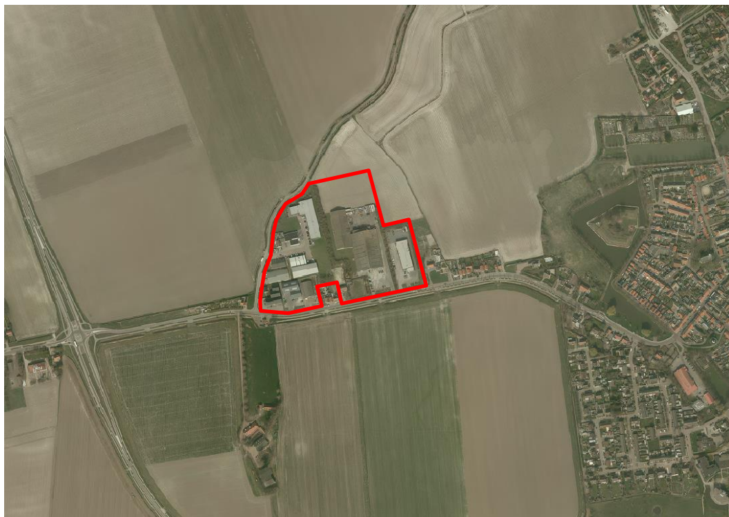
Afbeelding 6: Ligging en begrenzing bedrijventerrein IJzendijke

In het jaar 984 wordt reeds melding gemaakt van de naam IJzendijke. IJzendijke is diverse malen door stormvloeden overspoeld. De stormvloed in 1570 zorgde voor het einde van de oorspronkelijke nederzetting (thans Oud-IJzendijke genoemd). De naam IJzendijke ging over op een nabij (meer zuidelijk) gelegen buurtschap, dat de Hertog van Parma in 1587 liet verschansen. Sinds de verovering van de schans in 1604 door Prins Maurits ontwikkelde (nieuw) IJzendijke zich als oud-Hollandse vesting.