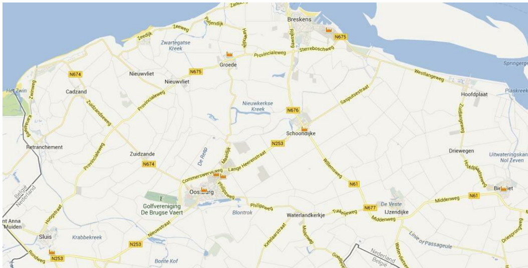
Afbeelding 18: Leegstand bedrijfsruimte gemeente Sluis