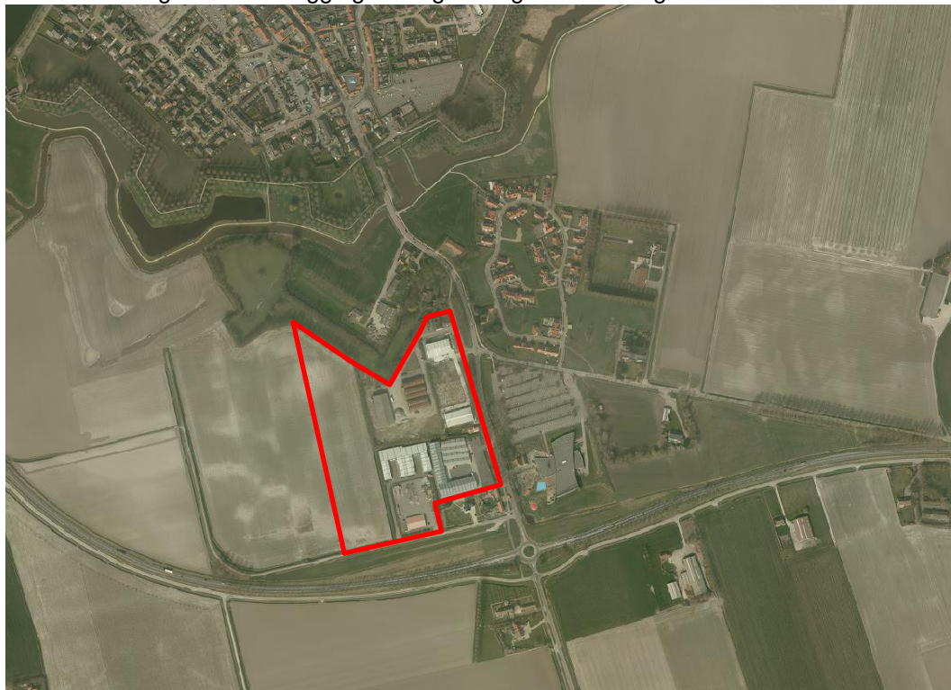
Afbeelding 12: Ligging en begrenzing bedrijventerrein Sluis - Smoutweg

Ten zuiden van de kern Sluis bevindt zich aan de Nieuwstraat/Smoutweg een kleinschalig bedrijventerrein. Op dit terrein is nog uitgeefbare grond beschikbaar. Zie afbeelding 12 voor een weergave van de ligging en begrenzing van dit deelgebied.