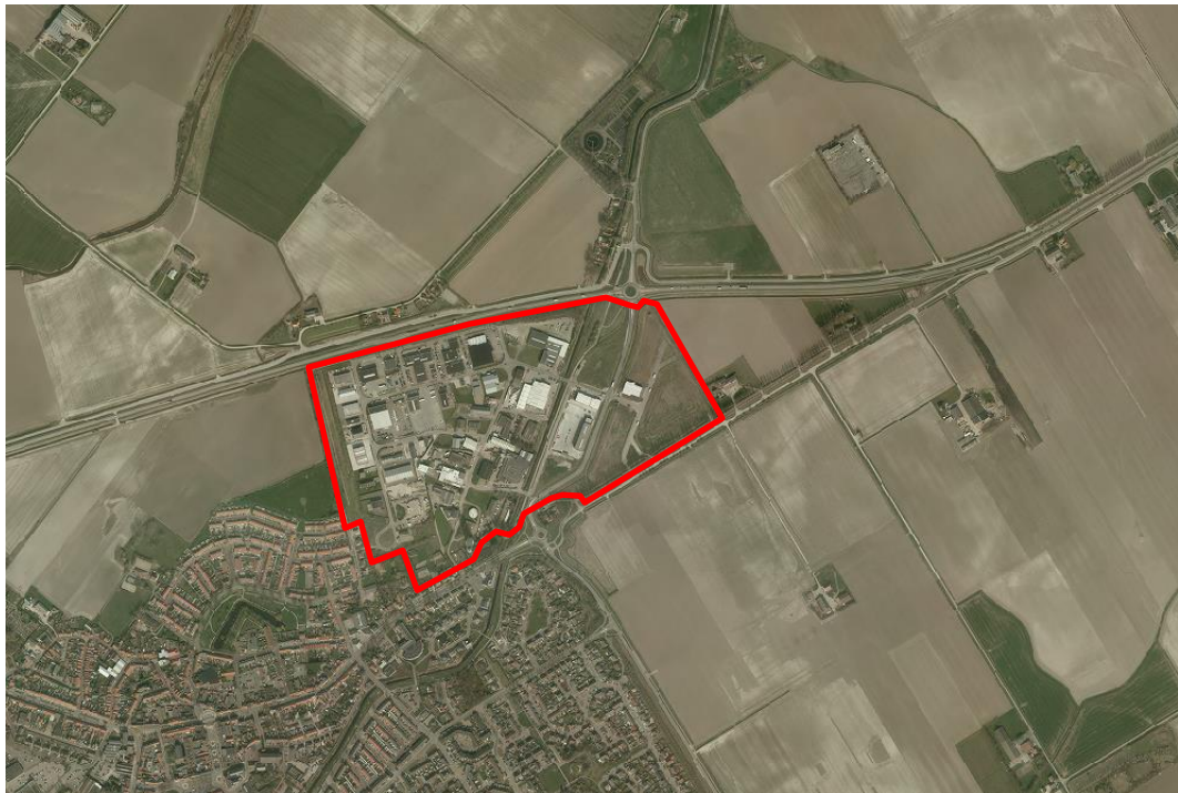
Afbeelding 9: Ligging en begrenzing bedrijventerrein Oostburg - Stampershoek

Het terrein is qua inrichting en soort bedrijven te karakteriseren als een regionaal georiënteerd bedrijventerrein. Er zijn vestigingsmogelijkheden voor lokaal en regionaal verzorgende bedrijvigheid. De gevestigde bedrijven zijn met name gericht op handel, opslag en dienstverlening. Grootschalige productiebedrijven komen op Stampershoek niet voor. Zie afbeelding 9 voor een weergave van de ligging en begrenzing van dit deelgebied.