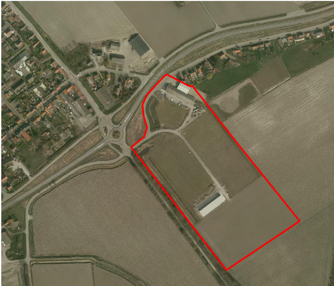
Afbeelding 7: Ligging en begrenzing bedrijventerrein Nieuwvliet