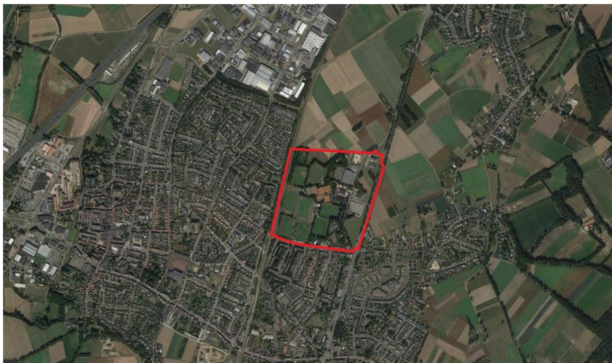
Figuur 2. Ligging van het plangebied (rood omlijnd).

Deelgebied 3 (zie grote foto op de voorzijde van dit rapport) bestaat uit verruigd grasland en sportveld, met hiertussen een houtsingel. In dit gebied bevinden zich soorten als pitrus, ridderzuring, paardenbloem, smalbladige liguster, wilg, zomereik, esdoorn en ruwe berk. Deelgebied 7 is een gazon met in de noordoostelijke hoek enkele zomereiken. Ook bevinden zich hier soorten als vogelmuur, herderstasje, paarse dovenetel en hondsdrif. Deelgebied 8 fungeert als voetbalveld en bestaat uit gazon. Deelgebied 9 bestaat uit opkomend grasland met onder andere akkerereprijs (zie kleine foto rechtsonder op de voorzijde). Deelgebied 10 omvat (gedeeltelijk nieuwe) bebouwing met onder andere zwembadfunctie (zie kleine foto linksboven op de voorzijde).