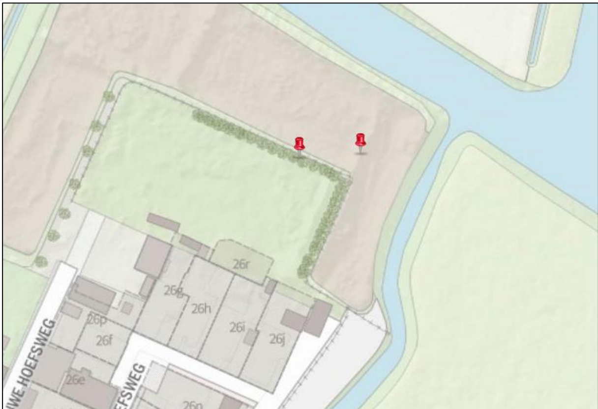
Figuur 3: Locaties met de bomen die geschikt zijn als verblijfplaats voor vleermuizen