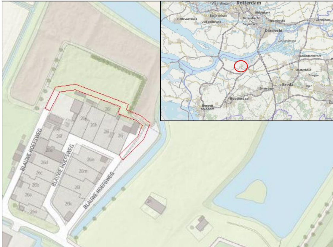
Figuur 1: Ligging van het plangebied (rood omlijnd en omcirkeld).