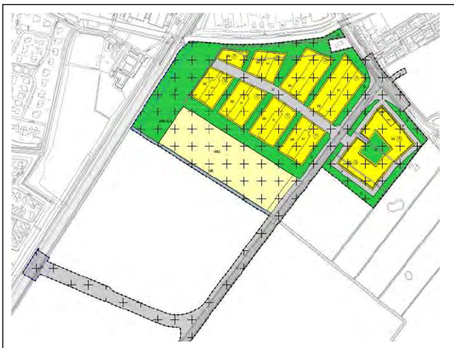
Figuur 1. Ligging planlocatie

In onderstaande figuur 1 is de planlocatie weergegeven. De gele en lichte gele vlakken krijgen de bestemming wonen. De verkaveling is aan de ontwikkelaars.