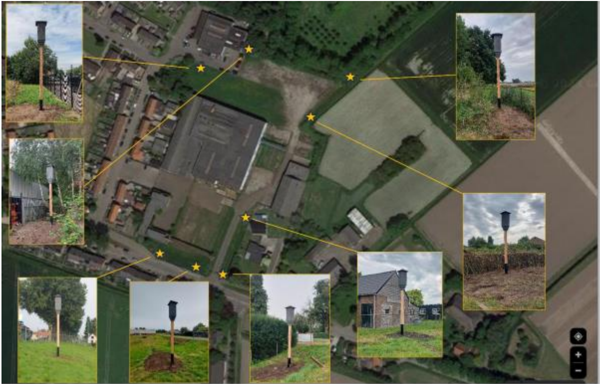
Figuur 4. Locatie van de tijdelijke voorzieningen (VK SK 04) voor de gewone dwergvleermuis.