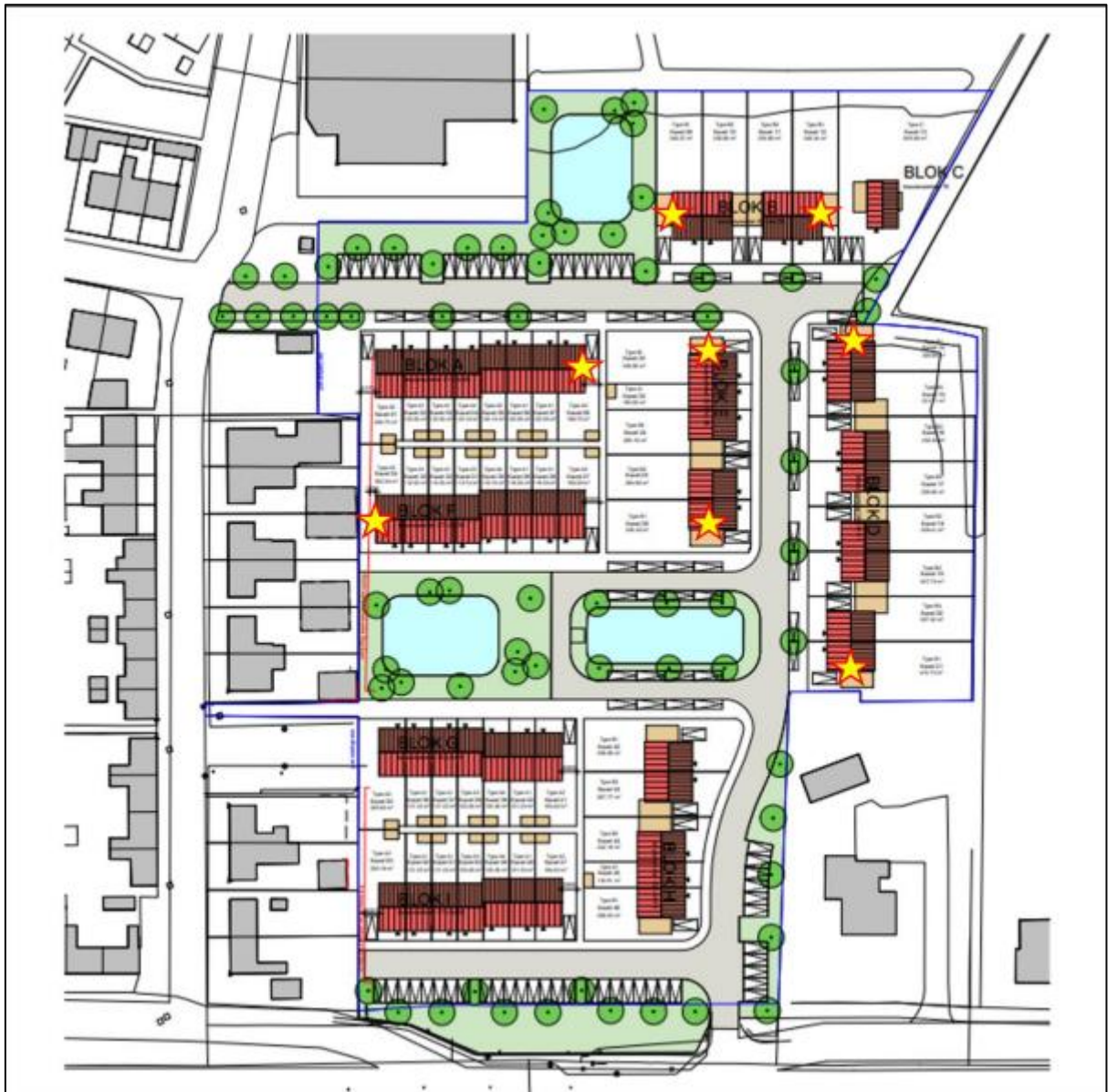
Figuur 5. De 8 locaties waar de IB VL 10 verblijfplaatsen voor de gewone dwergvleermuis worden gerealiseerd.