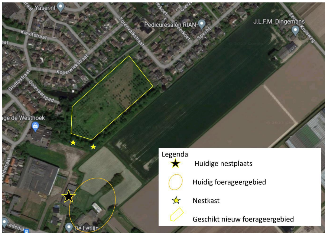
Figuur 2. Locatie van de voorzieningen voor de steenuil.