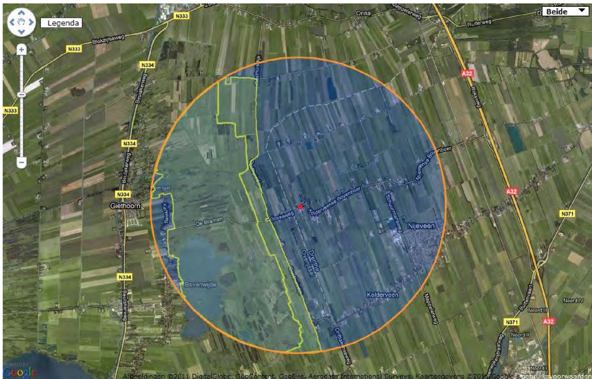
Figuur 2. Locatie van het plangebied (rode stip) ten opzichte van het Natura 2000-gebied "De Wieden" (geel omlijnd). De cirkel heeft een straal van drie kilometer.

Het plangebied ligt op een afstand van 410 meter van het Natura 2000-gebied de Wieden. De geplande werkzaamheden hebben echter geen negatieve invloed- of effecten op de aangewezen soorten en/of habitats van dit N2000 gebied. Een toetsing aan de Natuurbeschermingswet is derhalve niet aan de orde.