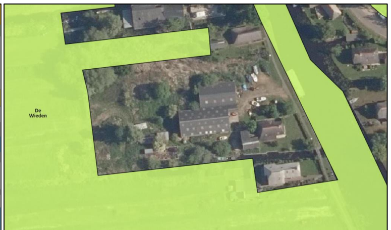
Figuur 4.2 Ligging plangebied t.o.v. 'De Wieden'

Het verlengen van de watergang heeft mogelijk lokaal effecten op de waarden van het Natura 2000-gebied. Gezien het hier echter om natte natuur gaat en de waterkwaliteit naar verwachting van afdoende kwaliteit is worden er geen negatieve effecten verwacht. Mogelijk biedt het verlengen van de watergang tot aan het natuurgebied zelfs een gemakkelijkere verbinding tussen het water van de Dwarsgracht en het achter de woningen gelegen grasland.