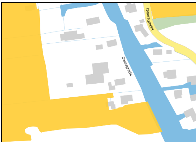
Figuur 4.1 Ligging plangebied t.o.v. NNN

Het plangebied is gelegen binnen een kleine wongeoase omgeven door het Natura 2000-gebied 'De Wieden' (figuur 4.2). De ontwikkeling blijft met alle werkzaamheden buiten de grenzen van het Natura 2000-gebied. Hierdoor kunnen er enkel externe effecten optreden. Van areaalverlies en versnippering zal geen sprake zijn.