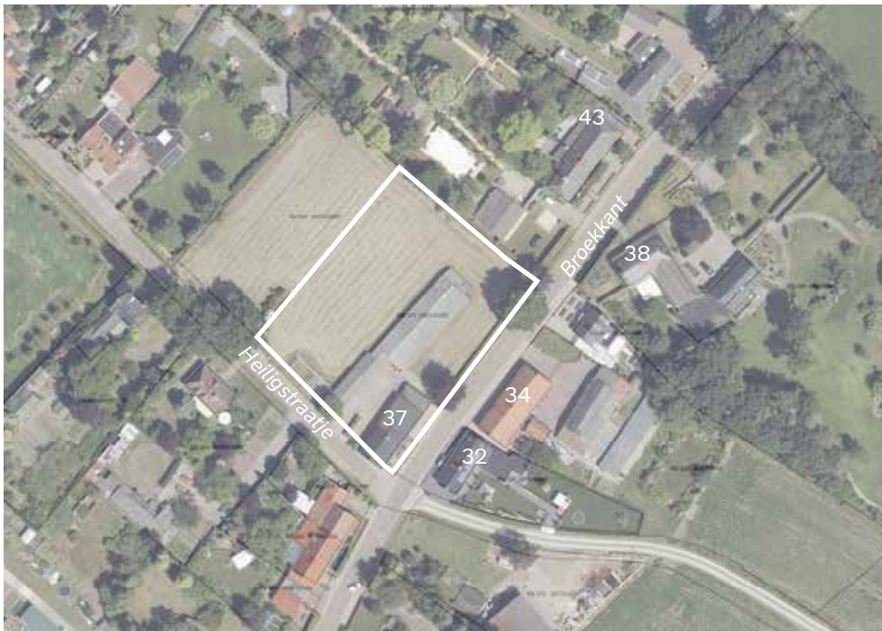
Luchtfoto huidige situatie Broekkant 37