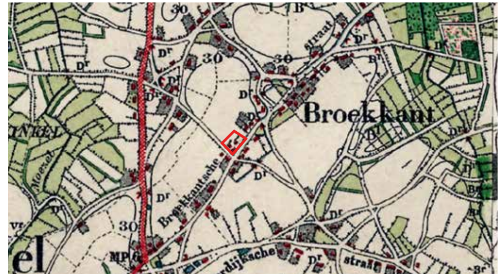
Ligging op historische kaart (1910)