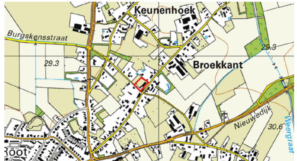
Ligging plangebied (Topografische kaart 2019)