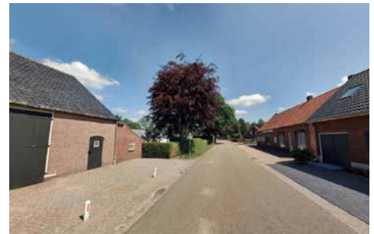
Woningen dicht aan de weg, stenige voorruimtes afgewisseld met groen