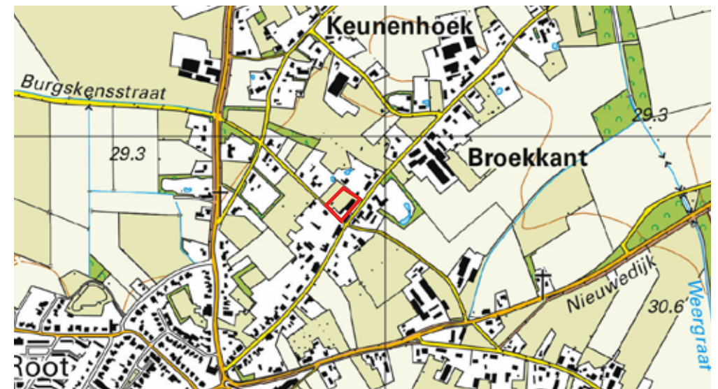
Ligging plangebied (Topografische kaart 2019)