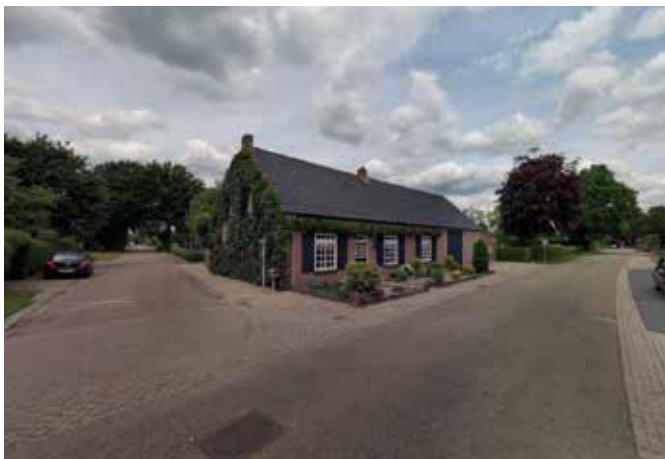
Kruising Heiligstraatje - Broekkant met bestaande woning

De eik die in het openbaar gebied staat zorgt samen met de bomen op het perceel voor een landelijk beeld. De aanwezigheid van de grasberm met het slootje draagt daaraan bij. Op veel delen in de straat is de sloot overkluisd en loopt waarschijnlijk onder de verharding door.