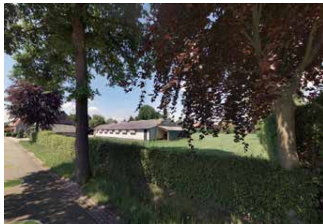
Weiland rond bestaande schuur, haag aan voorzijde