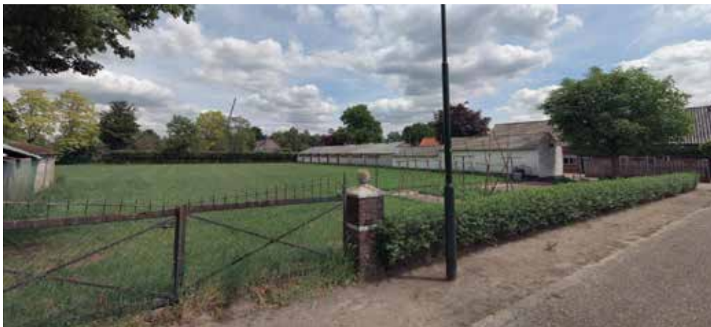
Planlocatie vanaf Heiligstraatje