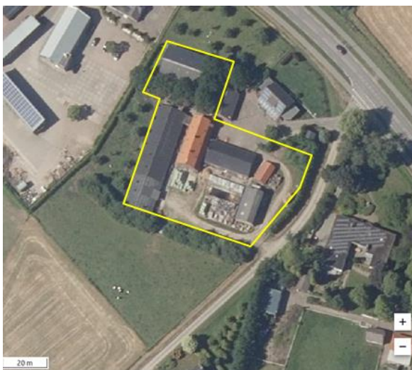
Detailopname van het plangebied. De begrenzing van het plangebied wordt met de gele lijn aangeduid.

Het plangebied vormt een deel van een agrarisch erf en bestaat uit bebouwing, erfverharding, opgaande beplanting, grasland en open zand. In het plangebied staan vier stallen, een kapschuur, een werktuigenberging en een kippenhok. Het kippenhok en een oude stal zijn gedekt met dakpannen, de overige gebouwen zijn gedekt met golfplaten. De gebouwen, welke gedekt zijn met dakpannen en de werktuigenberging, beschikken niet over dakisolatie. Drie stallen beschikken over dakisolatie in de vorm van hardschuimplaten welke onder de gording zijn bevestigd. Twee voormalige varkensstallen hebben buitengevels van baksteen en zijn voorzien van een (geïsoleerde) spouw. Op het erf liggen opgeslagen spullen, bouwmaterialen en gewikkelde hooibalen. In de noordwesthoek van het erf staan enkele solitaire essen. Op onderstaande afbeelding wordt de begrenzing van het plangebied weergegeven.