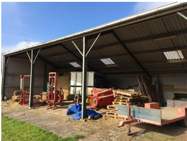
Vogelsoorten als houtduif, nestelen vaak op de gording van kapschuren.

Het plangebied behoort tot functioneel leefgebied van verschillende vogelsoorten. Vogels benutten de buitenruimte van het plangebied als foerageergebied en er nestelen vermoedelijk jaarlijks vogels in het plangebied. Vogels kunnen nestelen in de bomen, toegankelijke gebouwen en in/op afval, opgeslagen spullen en bouwmaterialen. Vogelsoorten die mogelijk in het plangebied nestelen zijn merel, vink, heggenmus, witte kwikstaart, koolmees, pimpelmees, houtduif en holenduif. Er zijn in het plangebied en het naastgelegen erf geen huismussen waargenomen. In het verleden nestelde de boerenwaluw vermoedelijk ook in het de gebouwen in het plangebied. Er zijn tijdens het veldbezoek echter geen oude nesten aangetroffen. In de stal in de zuidwesthoek van het erf is een oude braakbal van een kerkuil gevonden. Er zijn geen verse sporen van de kerkuil (of steenuil) gevonden, zodat aangenomen wordt dat het een braakbal van een kerkuil is die het gebouw in het verleden ooit eens incidenteel heeft bezocht. Vaste verblijf- en nestplaatsen van steen- en kerkuilen in dergelijke gebouwen zijn doorgaans eenvoudig vast te stellen vanwege de schijfsporen, braakballen en ruiveren (pers. ervaring auteur met nestelende kerk- en steenuilen in schuur bij eigen woning).