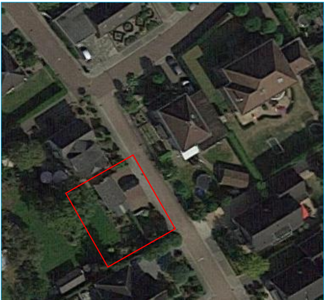
Afbeelding 1: Situering plangebied.

Het plangebied is gelegen in de bebouwde kom van Huissen en betreft een schuur en een deel van de omliggende tuin. De schuur is vrij open en heeft geen isolatiepanelen. In de schuur zijn spullen opgeslagen. De tuin is goed onderhouden en strak ingericht.