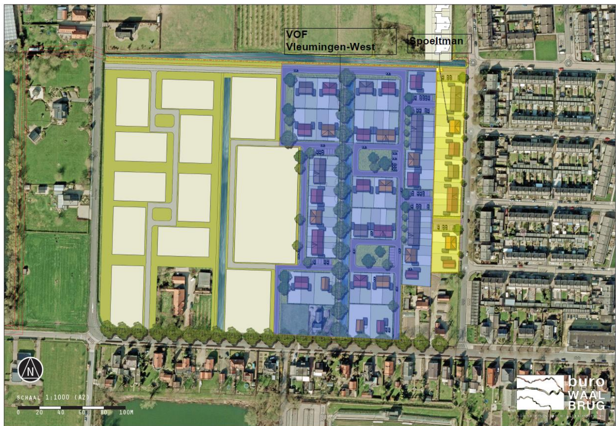
Figuur 1. Inrichting van het plangebied na afronding van de ingreep.

Voor een uitgebreide beschrijving van het plangebied zie het rapport van de reeds uitgevoerde quickscan (Craenmehr& Twisk, 2018). Het plangebied bestaat momenteel vrijwel uitsluitend uit laagstam boomgaarden. Na afronding van de voorgenomen ingreep bestaat het plangebied uit een woonwijk. Zie Figuur 1. De uitwerking van dit plan gebeurt in twee fasen. Het oostelijke (blauw gekleurde) deel betreft fase 1. Fase 2, het westelijke deel, moet nog nader uitgewerkt worden.