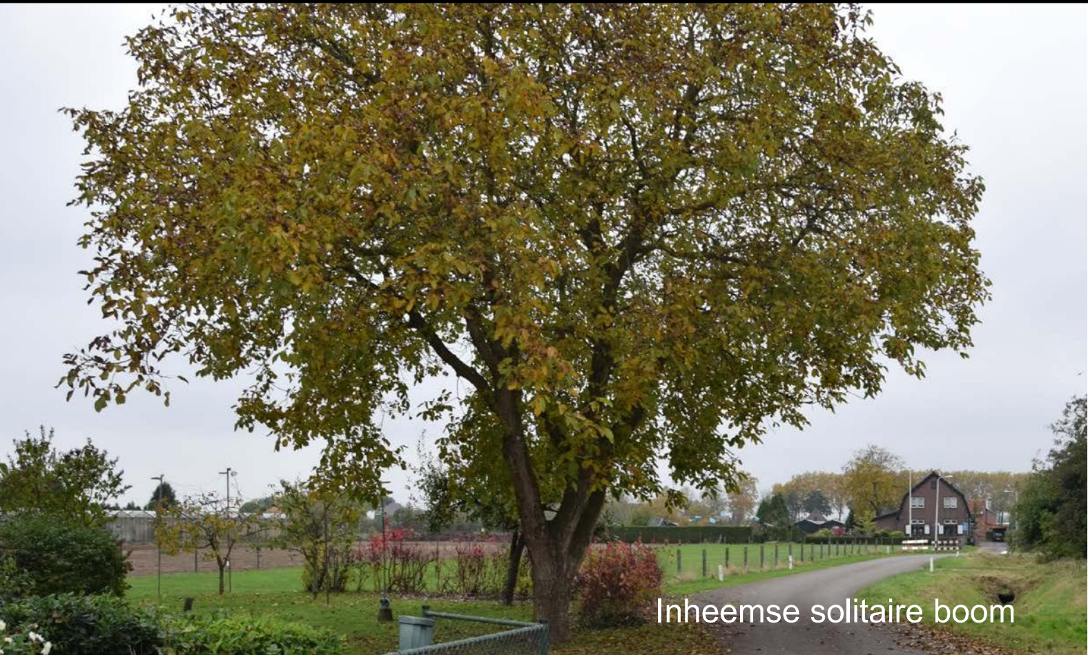
Inheemse solitaire boom