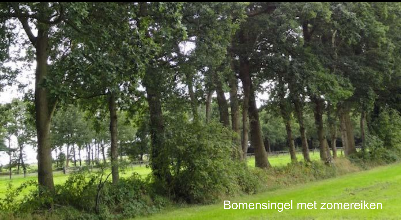
Bomensingel met zomereiken