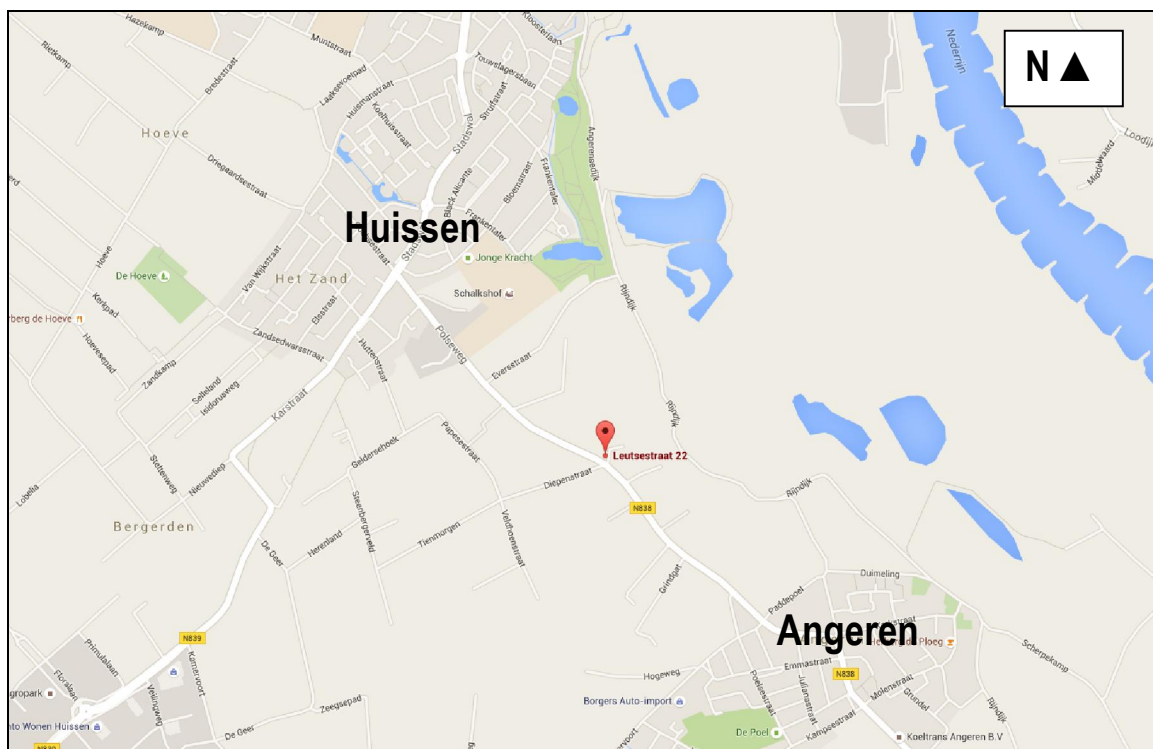
Figuur 1. Globale ligging van het plangebied Leutsestraat 22 te Angeren.

Het perceel waarop de plannen betrekking hebben is gelegen aan de Leutsestraat 22 te Angeren (zie figuur 1 voor de globale ligging en bijlage 1 voor de exacte ligging en begrenzing). In dit gebied is het voornemen voor de sloop van twee schuren en de bouw van één woning. De nieuw te bebouwen woning is voorzien op een akker aan de westzijde van het perceel. Met de plannen wordt een pool aan de Rijndijk niet beïnvloed. In figuur 2 wordt een foto-impressie gegeven van de situatie rond half mei 2016 en in figuur 3 wordt een impressie gegeven van de plannen.