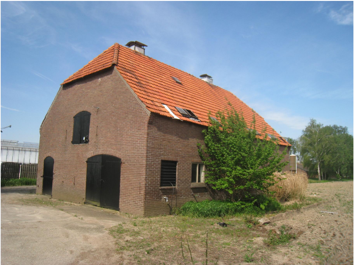
Vervolg figuur 2. Aanzicht van Leutsestraat 22 te Angeren (in de te slopen schuur en slopen schuur voorzijde).