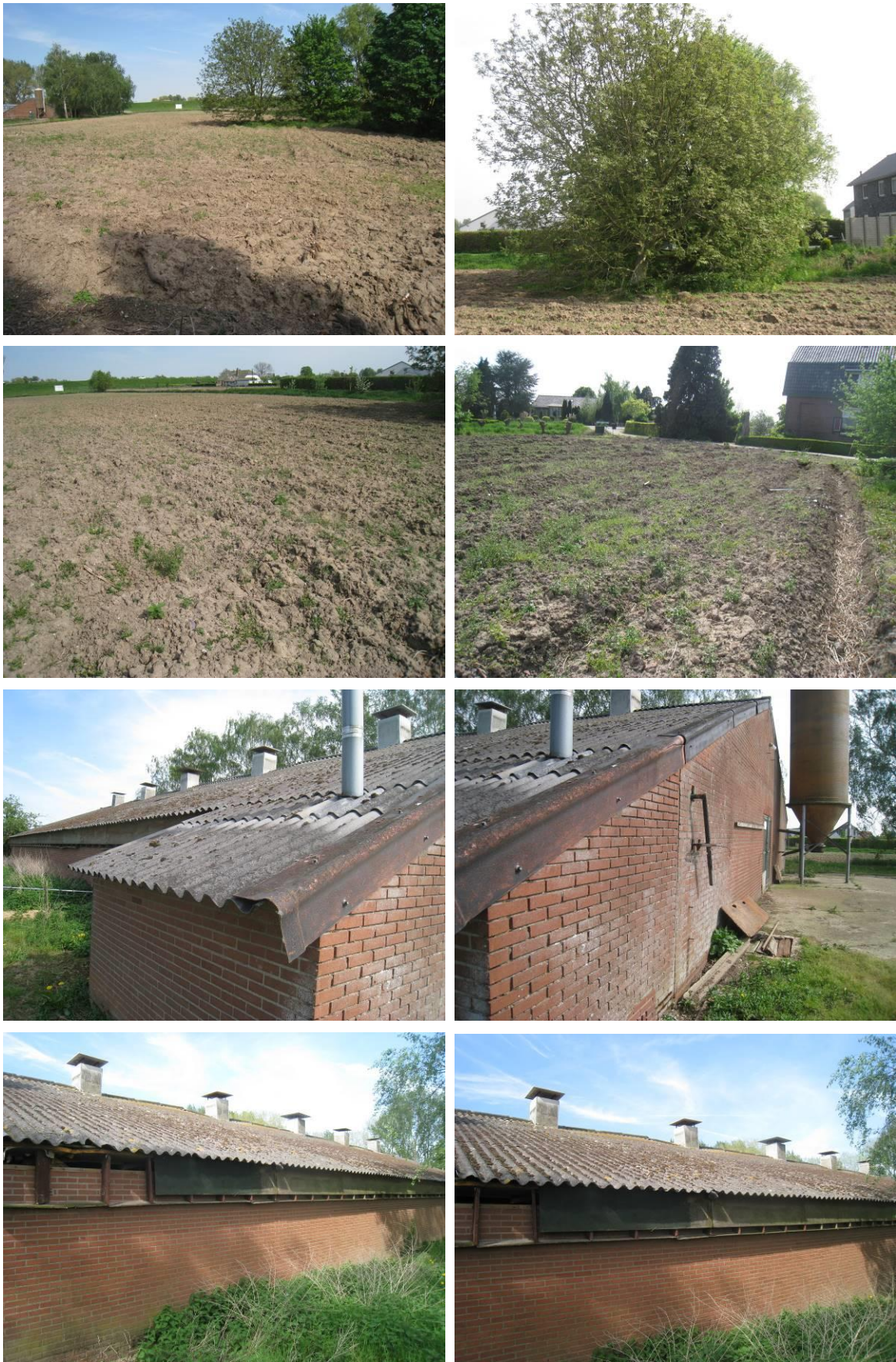
Figuur 2. Aanzicht van Leutsestraat 22 te Angeren. Bovenste vier foto's: locatie te bouwen woning, onderste vier foto's; te slopen (varkens)schuur.