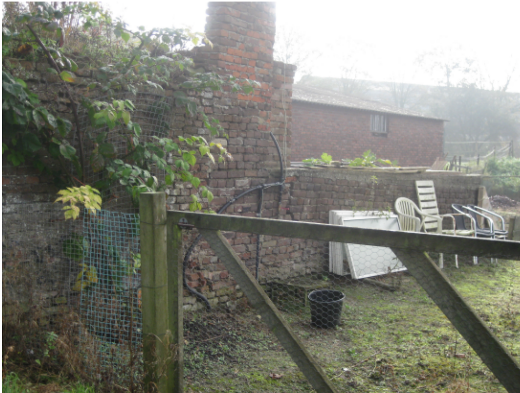
Langsgevel achterzijde (rechter gedeelte)