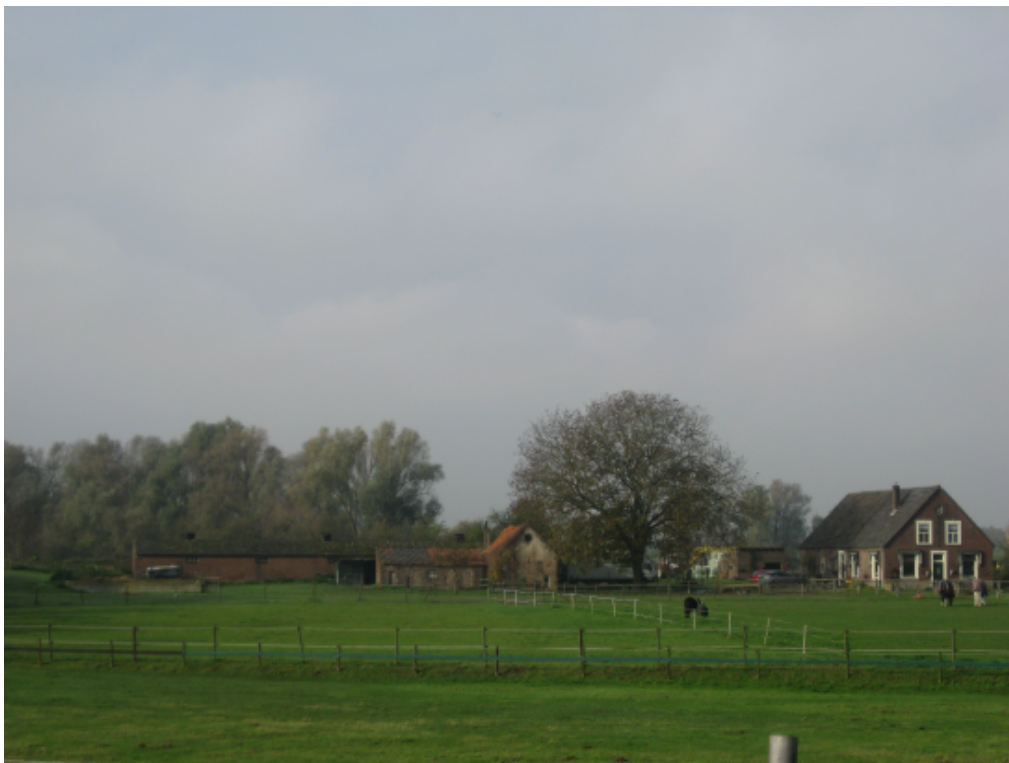
Ligging van het boerderijcomplex aan de Polder, in het buitengebied van Gendt. De voormalige steenoven maakt deel uit van dit complex.