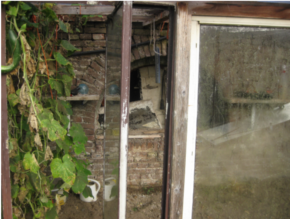
Kopgevel (met achter het glas een rondboogvormige opening in het baksteen)