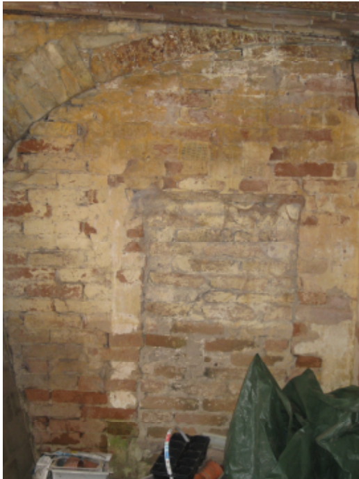
Later dichtgemetselde opening