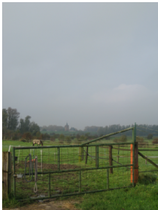
Uitzicht aan de achterzijde