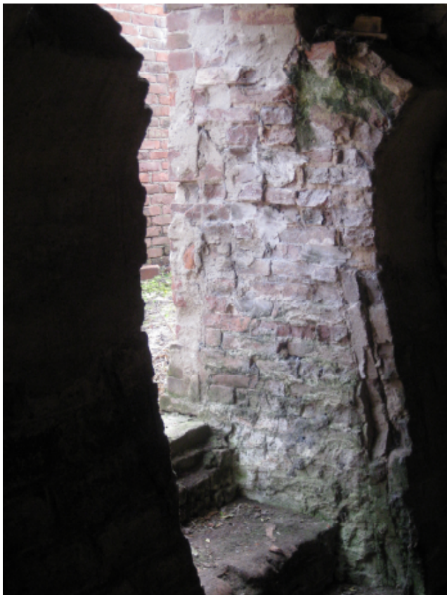
Entree tot de kelder (de dikte van de muren is hier goed waarneembaar)