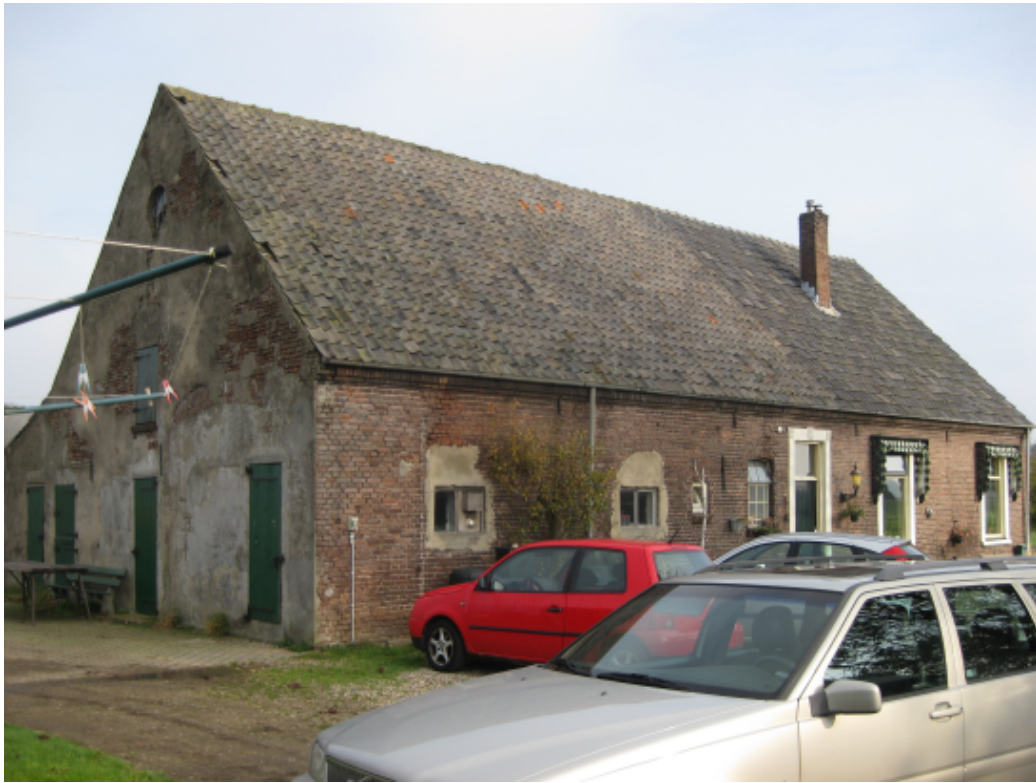
Linker zijgevel en achtergevel schuur/woonhuis