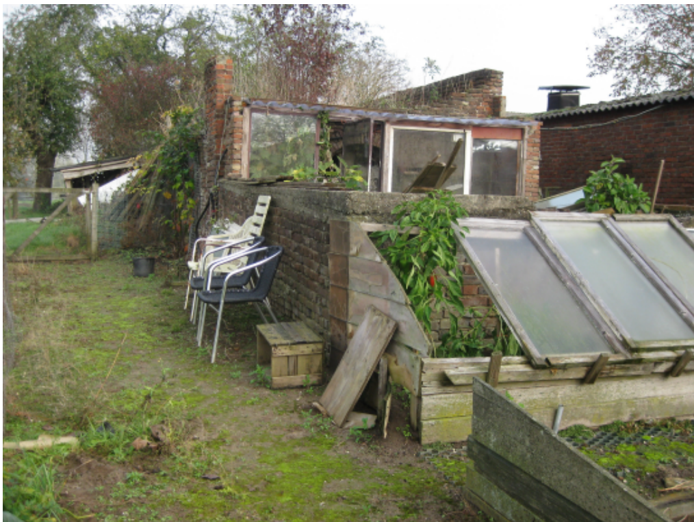
Kopgevel (met later gerealiseerde koude bak)