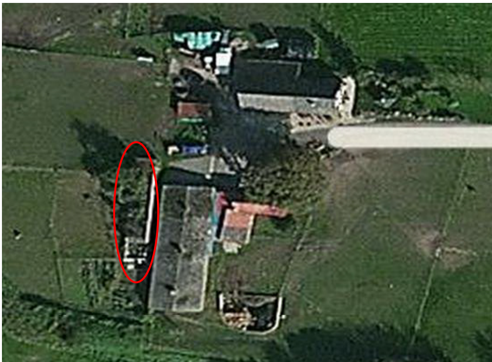
Erfbebouwing Polder 37. De voormalige steenoven is rood omcirkeld.