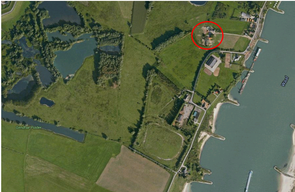
Ligging van Polder 37 in het buitengebied van Gendt. Het complex is rood omcirkeld.