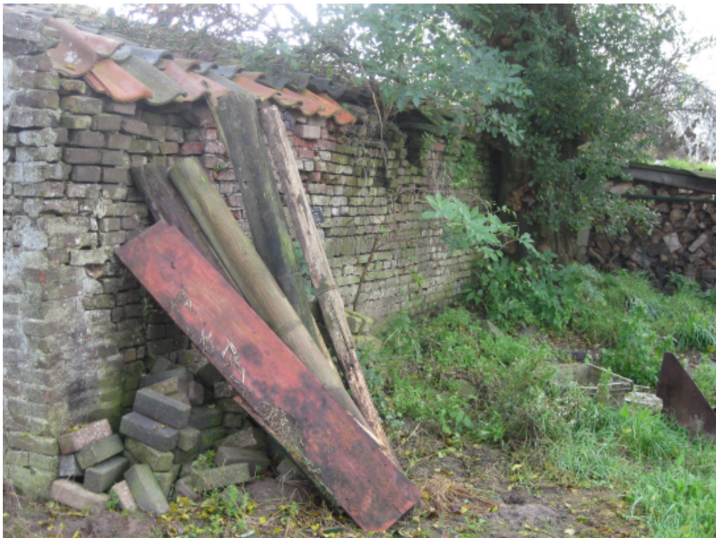
Langsgevel achterzijde (linker gedeelte)