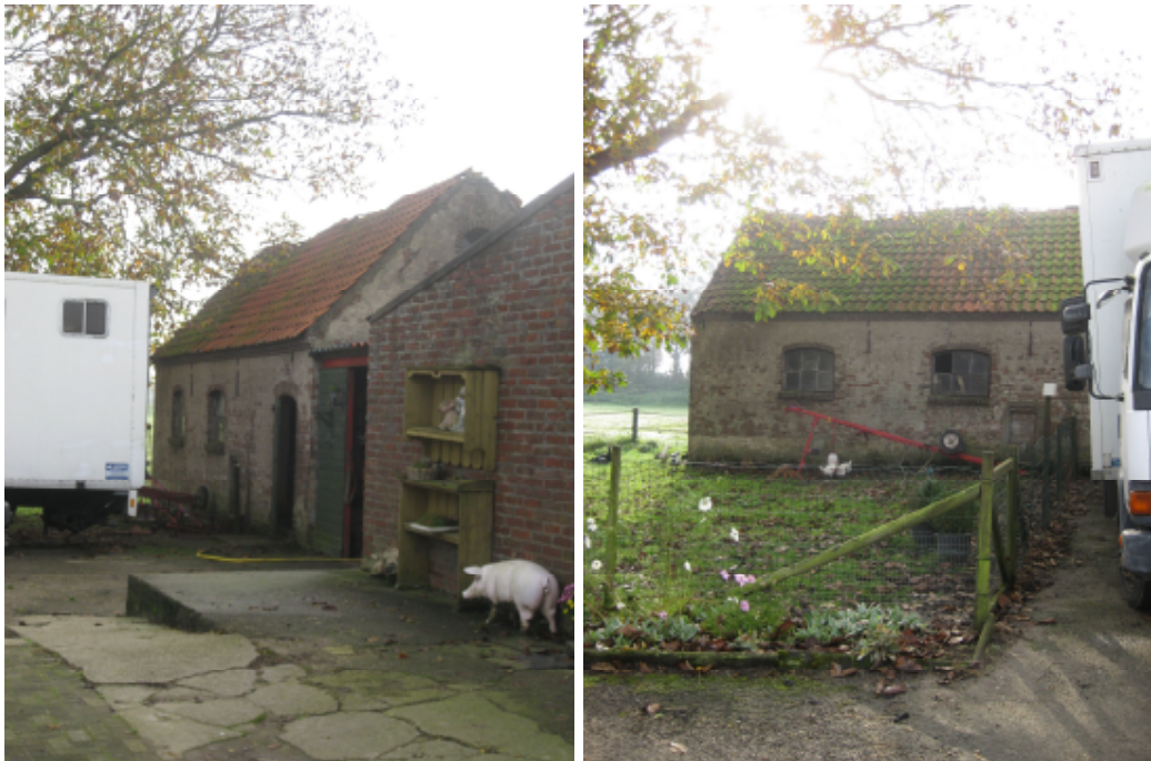
Schuur (aan de voorzijde van de voormalige steenoven gelegen)