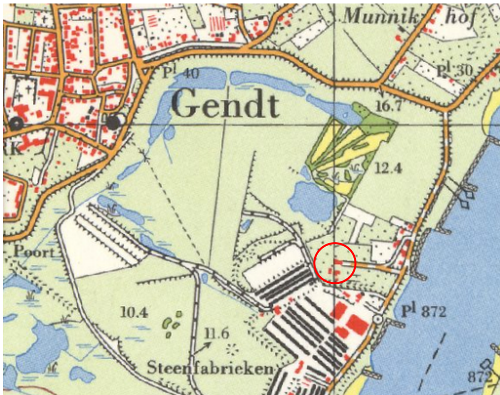
Topografische kaart kasdarter 1966