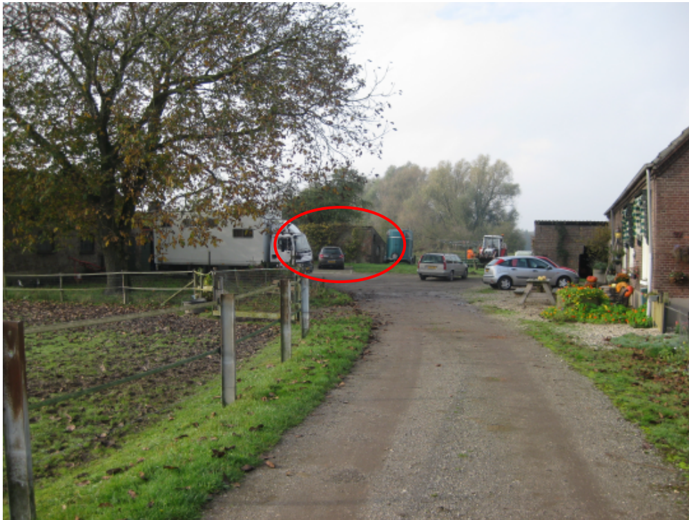
Erfbebouwing. De voormalige steenoven is rood omcirkeld.