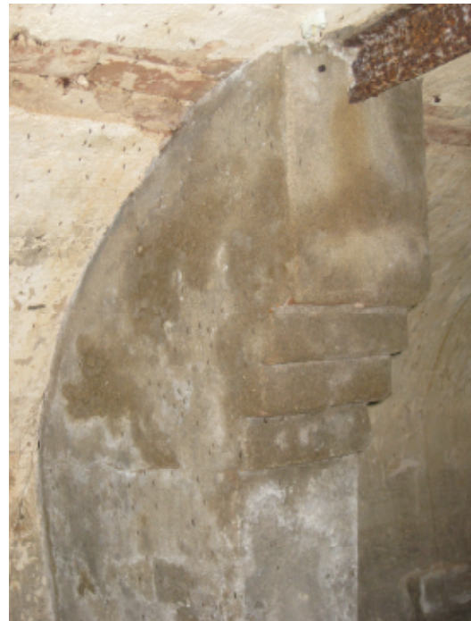
Trapsgewijze afsluiting penant