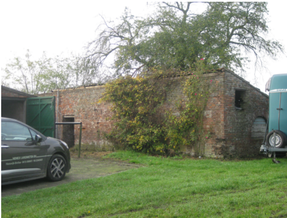
Langsgevel voorzijde, kopgevel (rechts)