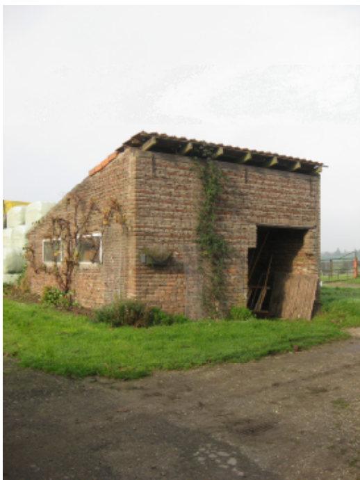
Schuur (rechts naast de voormalige steenoven)