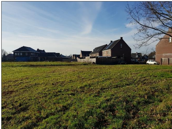
Figuur 8. Noordwestelijk deel plangebied