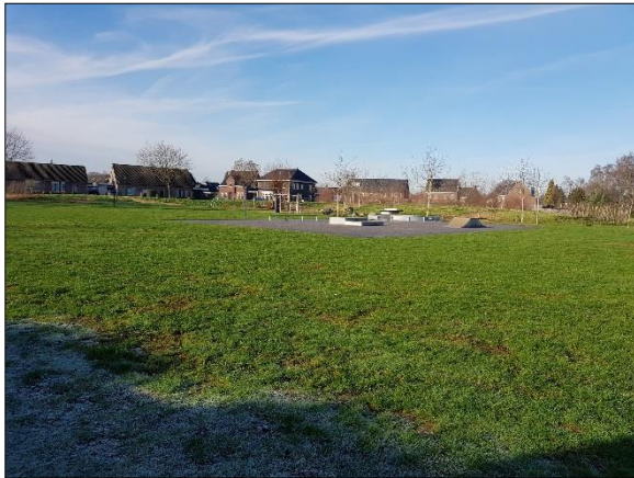
Figuur 4. Zuidelijk deel plangebied met speeltuin