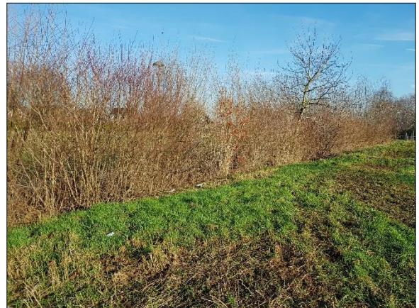
Figuur 9. Lichte beplanting in midden plangebied