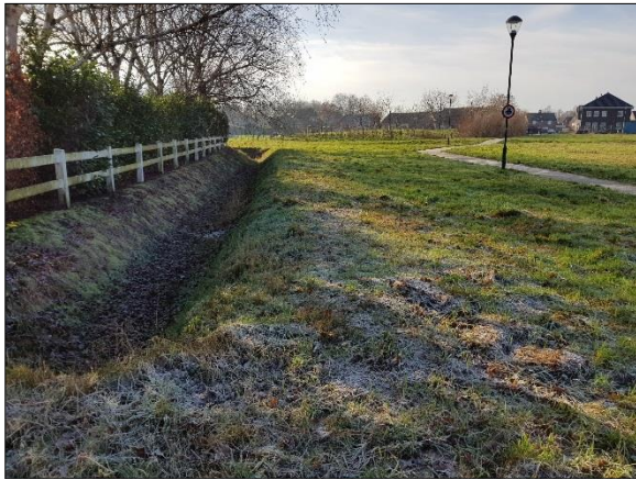
Figuur 6. Oostelijk deel plangebied vanuit oosten