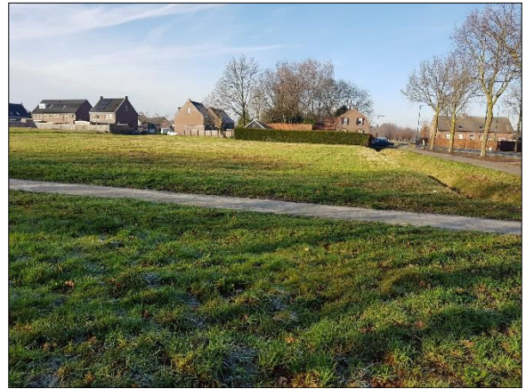
Figuur 7. Noordoostelijk deel plangebied