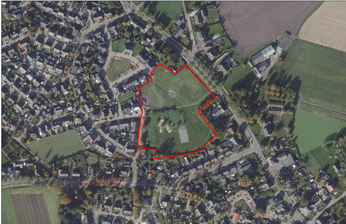
Figuur 2. Luchtfoto van het plangebied en de directe omgeving