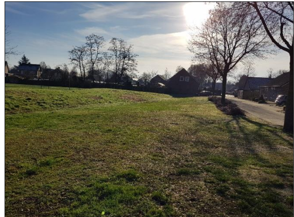
Figuur 5. Zuidwestelijk deel plangebied