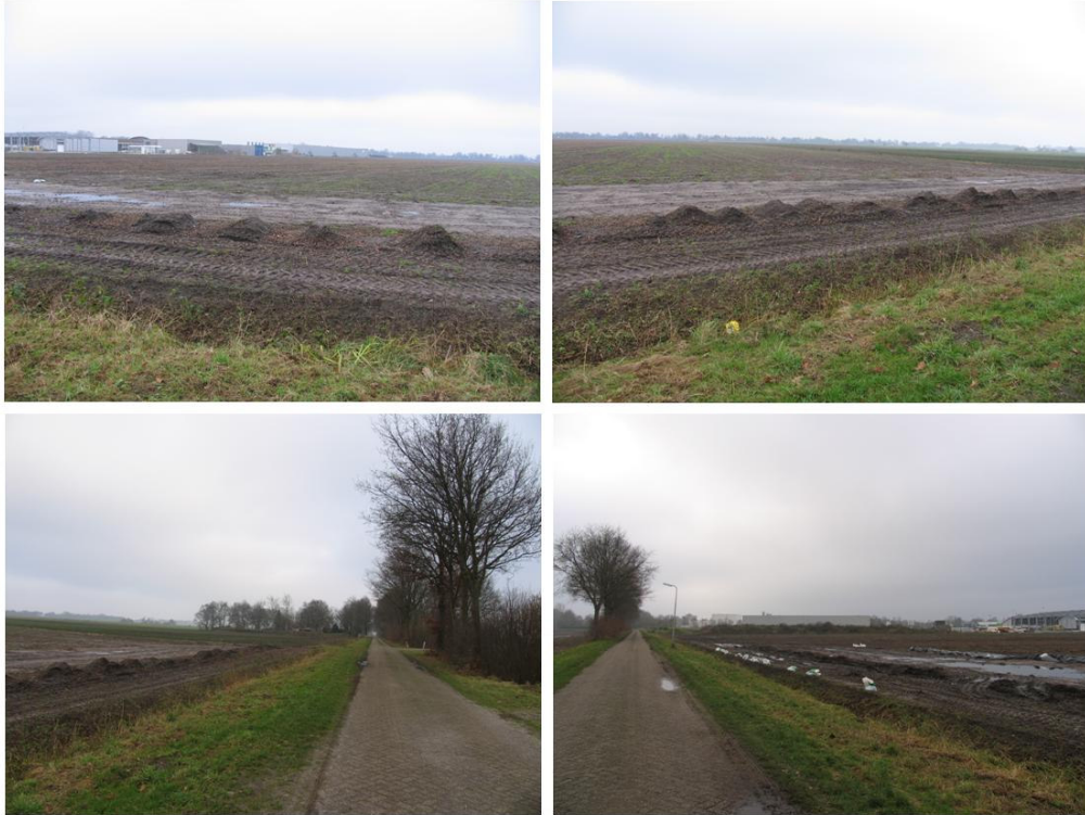
Boven: plangebied toekomstige uitbreiding bedrijventerrein. Onder: onderbroken houtsingel ten zuiden van toekomstig bedrijventerrein

gebied aangelegd met groen en water, grenzend aan de Europasingel. Hiermee krijgt het bedrijventerrein niet alleen een fraaie entree, ook wordt het bedrijventerrein hiermee op een passende wijze afgeschermd van het bestaande en toekomstige woongebied Vroomshoop-Oost. Ten zuiden van het gebied ligt een weg met een onderbroken houtsingel. De foto's hieronder geven een impressie van het gebied.