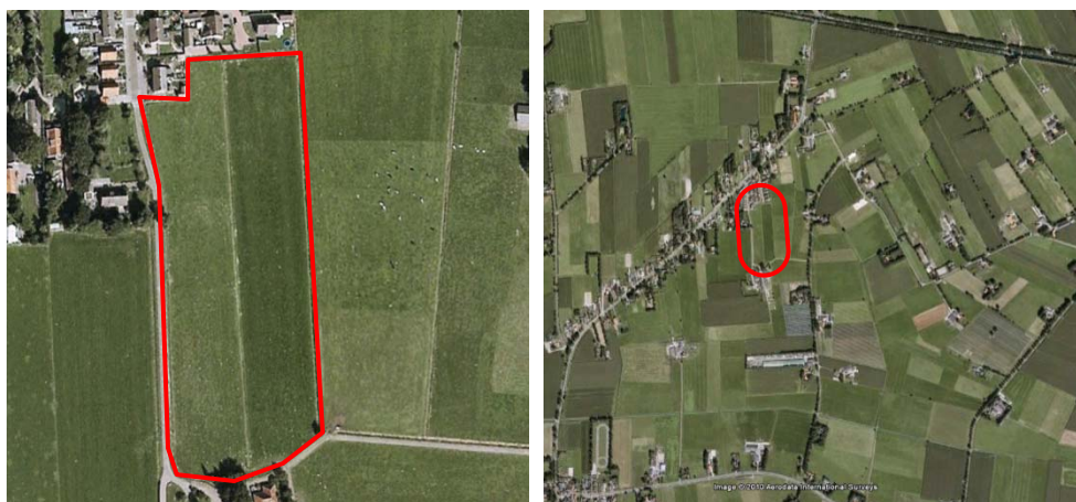
Afbeelding 1 en 2: Situering onderzoeksgebied (bron: Google Earth).

Het plangebied is gelegen ten zuiden van de lintbebouwing van De Pollen en betreft een koeienwei. Ten noorden en zuiden van het plangebied is reeds bebouwing aanwezig. De oostelijke en westelijke aangrenzende percelen zijn ook in gebruik als koeienwei. Het perceel wordt grotendeels begrensd door watervoerende sloten. Het plangebied wordt door een gedeeltelijk watervoerende sloot gescheiden in twee percelen.