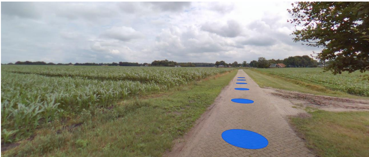
Fragment zicht vanaf es richting Vroomshoopseweg 5

Het kweken van mais, zoals dat vorig jaar plaatsvond heeft een grotere impact (ook al is dat tijdelijk) op de openheid en de uitstraling van de es. Vanaf de es bezien valt de Bijbelse tuin bovendien weg in de bestaande beplanting (bomen op/bij het erf en langs de weg) en bebouwing (zie afbeelding hierna).