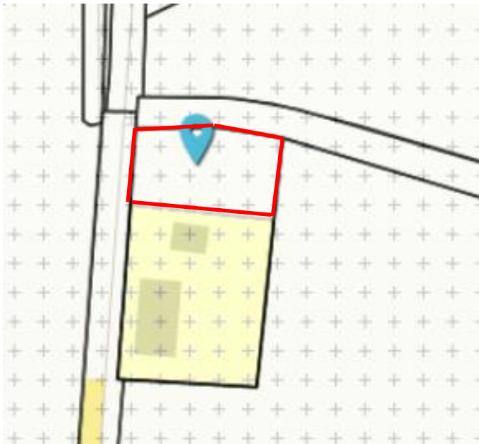
Vroomshoopseweg 5 met rood omliggend het gebied voor de Bijbelse tuin

Op de verbeelding van het bestemmingsplan 'Buitengebied Twenterand' het rood omliggende gedeelte te voorzien van de aanduiding 'specifieke vorm van cultuur en ontspanning – Bijbelse tuin' [Vroomshoopseweg 5].