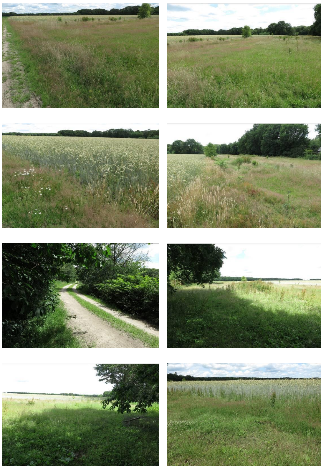
Figuur 2. Foto-impressie van het uitwerkingsgebied te Norg.