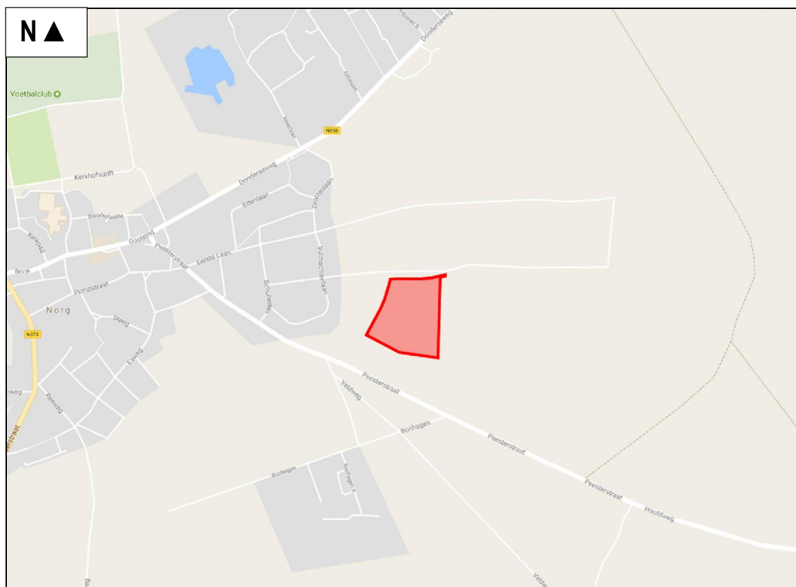
Figuur 1. Globale ligging van het uitwerkingsgebied te Norg.

De globale ligging van het uitwerkingsgebied van de woningbouw is weergegeven in figuur 1. In bijlage 1 is de exacte ligging weergegeven. Dit gebied bestaat uit een akker. Het ontbreekt aan oppervlaktewater. Het plan is om op deze locatie woonbebouwing te realiseren. In figuur 2 wordt een impressie gegeven van het plangebied op dinsdag 4 juli 2017 en de plannen voor zijn weergegeven in figuur 3.