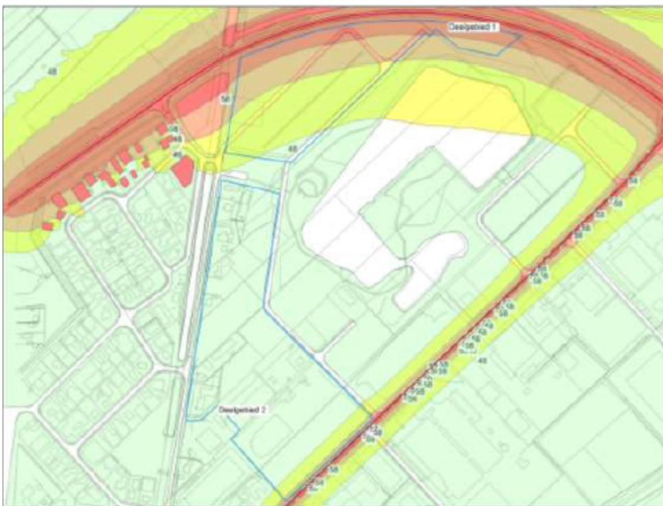
Figuur 2: Ligging 48, 53 en 58 dB contouren.

In de berekeningen is op grond hiervan respectievelijk 2 dB (N372) en 5 dB (Dwaziewegen) van de rekenresultaten afgetrokken. De berekeningen zijn uitgevoerd op hoogtes gekoppeld aan het op basis van het ontwerp te realiseren bouwhoogte. Daarom is een berekening uitgevoerd met waarneempunten waarbij de grenzen van het bouwvlak als gevel zijn aangehouden met een waarneemhoogte van 4,5 hoogte. De resultaten van de berekeningen zijn in de hiernavolgende afbeelding opgenomen. In bijlage 2 behorende bij de toelichting bestemmingsplan Herziening Haarveld d.d. 25 maart 2019 projectnummer 160.00.04.68.00 zijn de volledige berekeningen opgenomen en gemotiveerd.