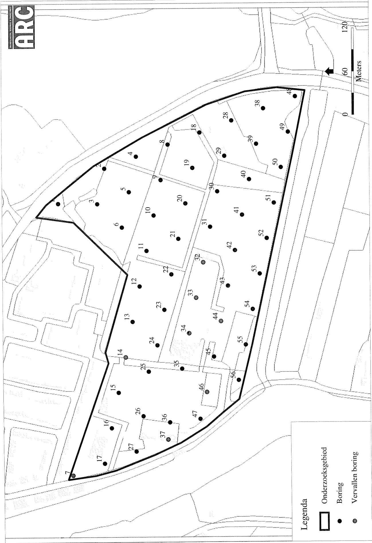
Afbeelding 2 Het onderzoeksgebied en de ligging van de boorpunten.