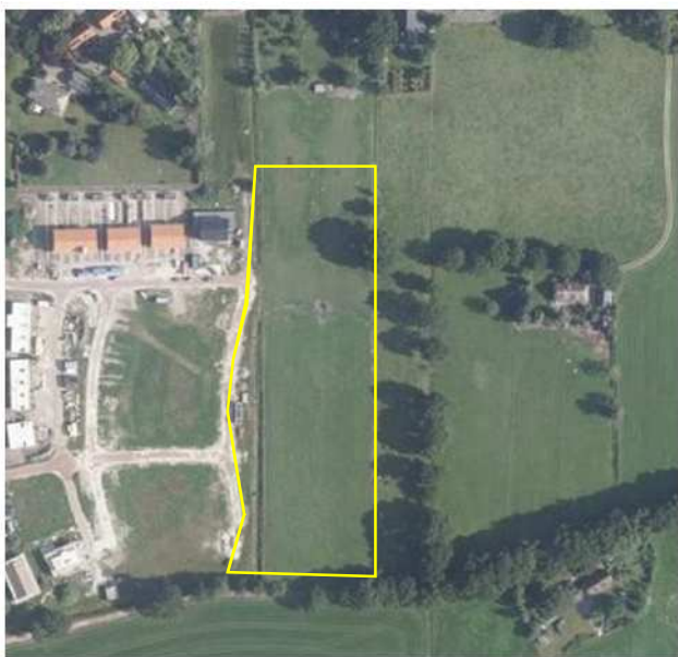
Detailopname van het plangebied. Het plangebied wordt met de gele lijn aangeduid.

Het plangebied bestaat uit weide en een sloot met open water en oever. Het plangebied werd tijdens het veldbezoek begraasd door paarden. Het grasland bestaat uit een soortenarme vegetatie van hoofdzakelijk Engels raaigras en de vegetatie van de oevers bestaat uit algemene grassoorten. Aan de westzijde van het plangebied ligt een ondiepe kavelgrenssloot welke onderin 0,5 breed is. Het plangebied grenst aan de westzijde aan een nieuwbouwwijk, aan de zuidzijde aan een zandweg met zomereiken laanbomen en aan de oost- en noordzijde aan een (paarden)weide. Op onderstaande afbeelding wordt het plangebied in detail weergegeven.