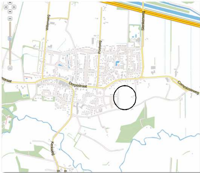
Globale ligging van het plangebied. De ligging van het plangebied wordt met de cirkel aangeduid. (bron: PDOK).

Het plangebied ligt ten zuidoosten van De Wijk, gemeente De Wolden. Het ligt in het buitengebied, direct ten oosten van woonwijk Dunningen. Het grenst aan de zuidzijde aan de Haalweidigerweg. Op onderstaande kaart wordt de globale ligging van het plangebied aangeduid met de cirkel.