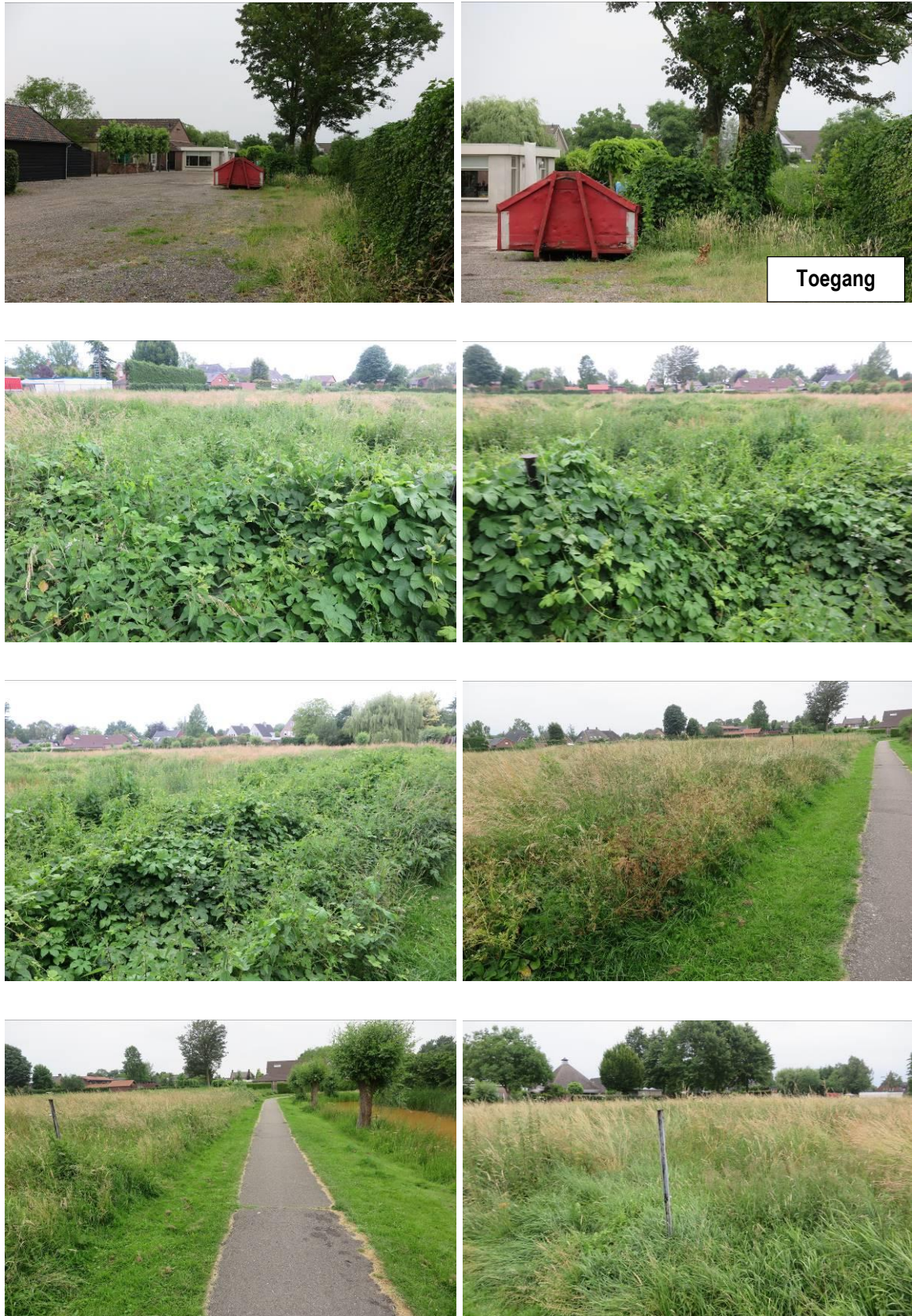
Figuur 2. Foto-impressie van het plangebied aan de Langenboomseweg te Zeeland.