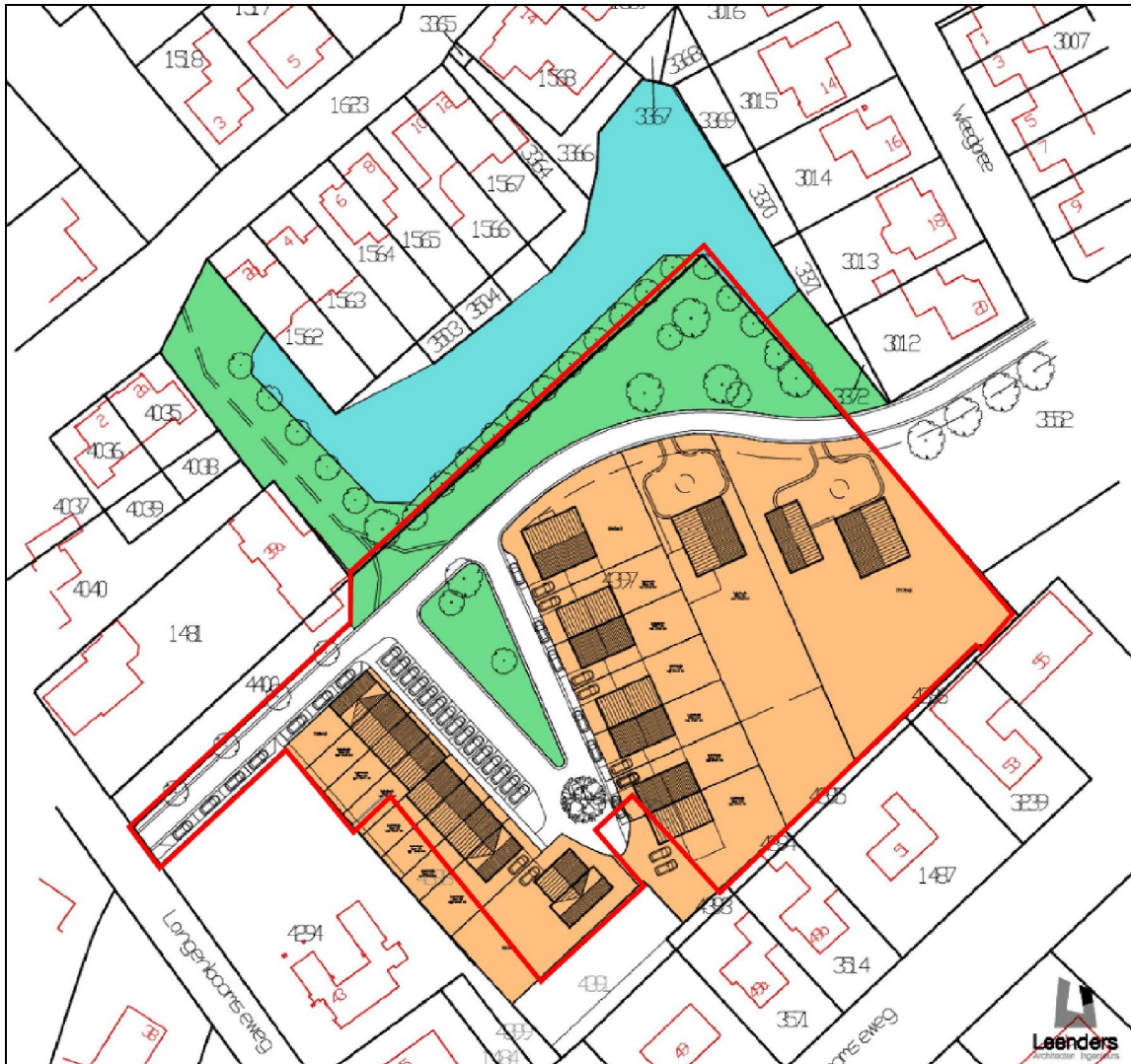
Figuur 3. Impressie van de plannen aan de Langenboomseweg te Zeeland.