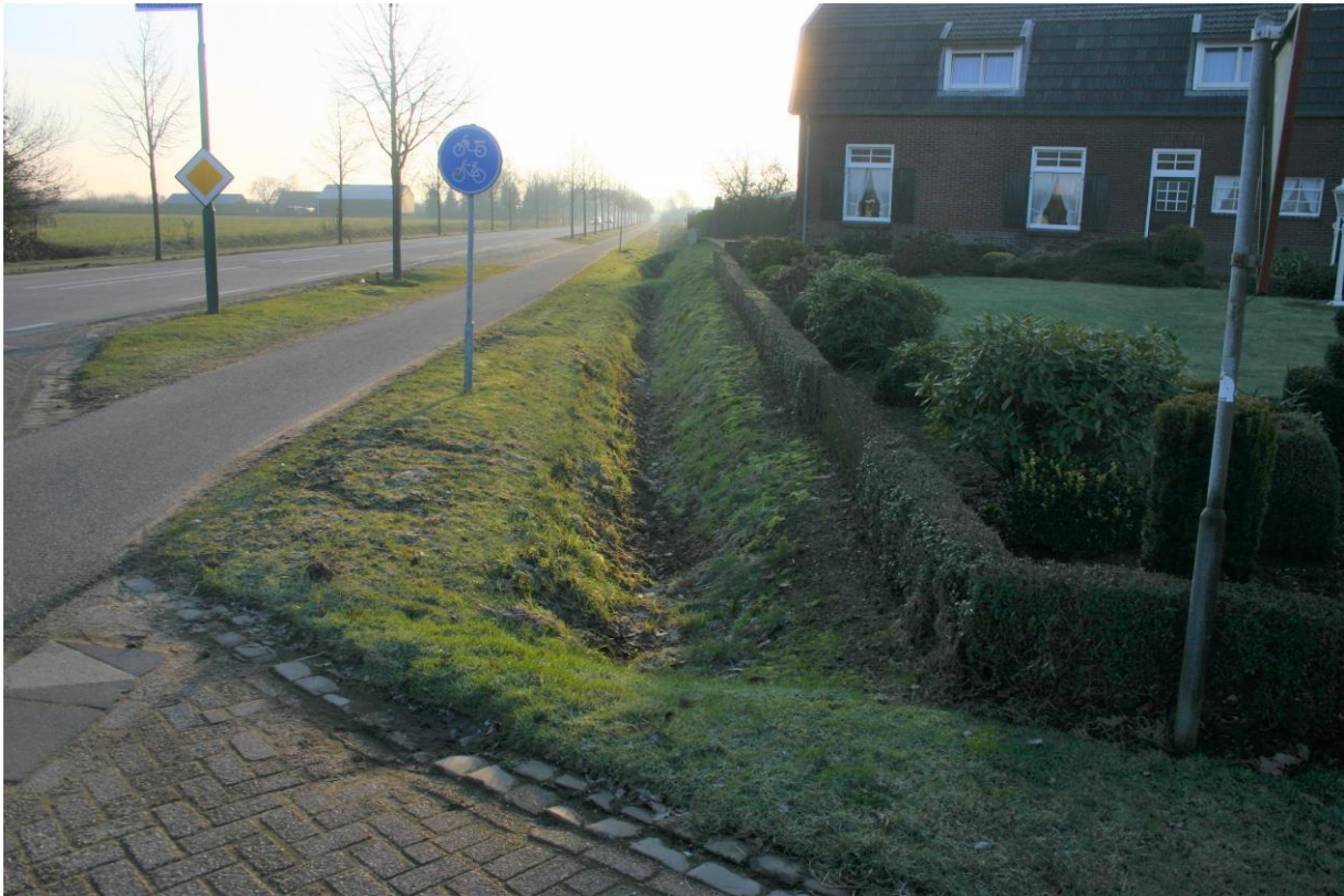
Figuur 5. Gedeelte van de tuin behorende bij de melkveehouderij aan de Heerstraat/Hertraksestraat en een van de droogstaande greppels.