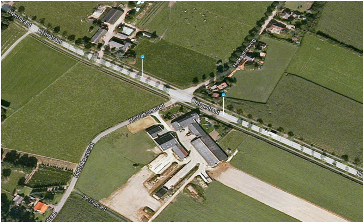
Figuur 1. Luchtfoto van de te reconstrueren kruising.

Croonenburo5 is door de Gemeente Cuijk gevraagd een ruimtelijke onderbouwing op te stellen voor de reconstructie van een kruispunt aan de Heerkant/Hertraksestraat/Heikantseweg te Cuijk (zie figuur 1). Het betreft een wegverlegging/verbreding van deze kruising in verband met de aanleg/reconstructie van een fietspad. Croonenburo5 heeft ecologisch adviesbureau Faunaconsult opdracht gegeven op deze locatie een flora- en fauna-inspectie uit te voeren.