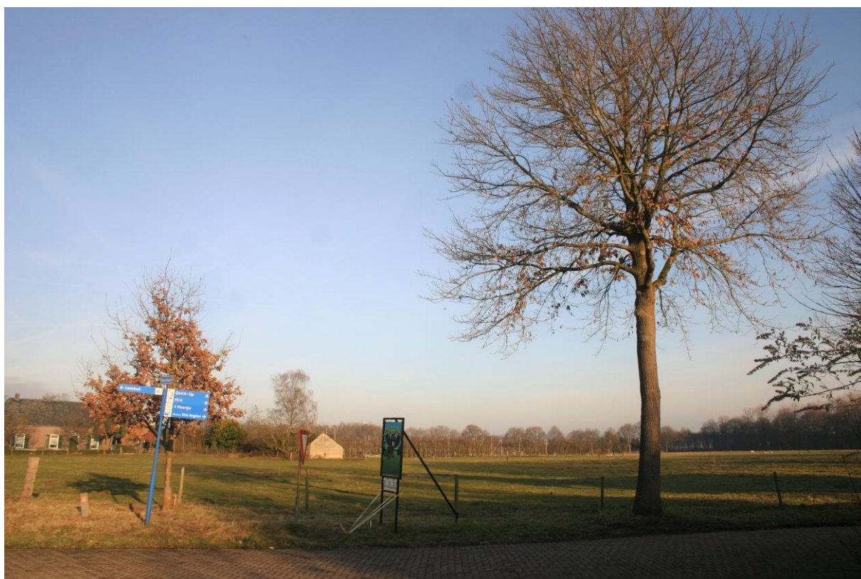
Figuur 7. De kleine en grote zomereik langs de Heikantseweg.

Langs de Heikantseweg staat een rij zomereiken, die mogelijk ook als vaste vliegrouwe voor vleermuizen fungeert. Vlakkbij de te reconstrueren kruising staan een kleine en een grote zomereik (zie de zwarte rondjes in figuur 6 en figuur 7); deze bevatten geen holte en worden voor de reconstructie van het kruispunt gekapt.