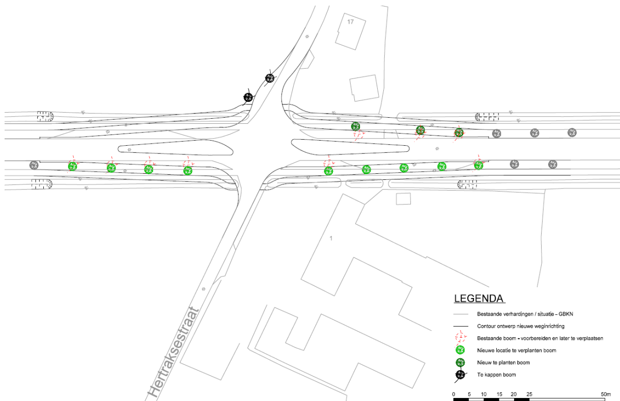
Figuur 3. Definitief ontwerp groeninrichting bomen (Gemeente Cuijk).