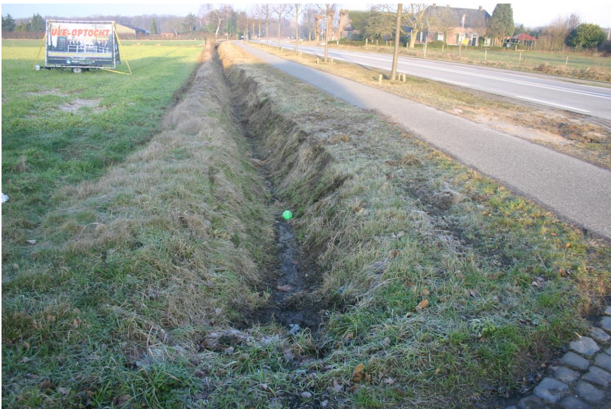
Figuur 6. De greppels naast de Heerstraat bevatten geen water.