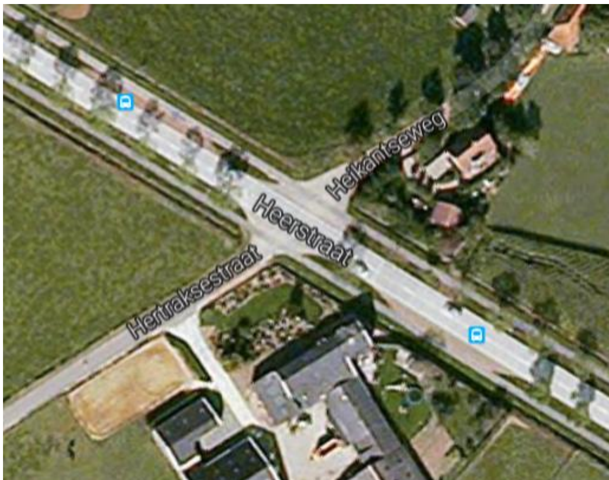
Figuur 4. Bovenaanzicht van de te reconstrueren kruising.

Figuur 3 is een bovenaanzicht van de te reconstrueren kruising (kruising van de Heerstraat met de Hertraksestraat en de Heikantseweg). Zie ook de grote foto op de voorzijde van dit rapport.