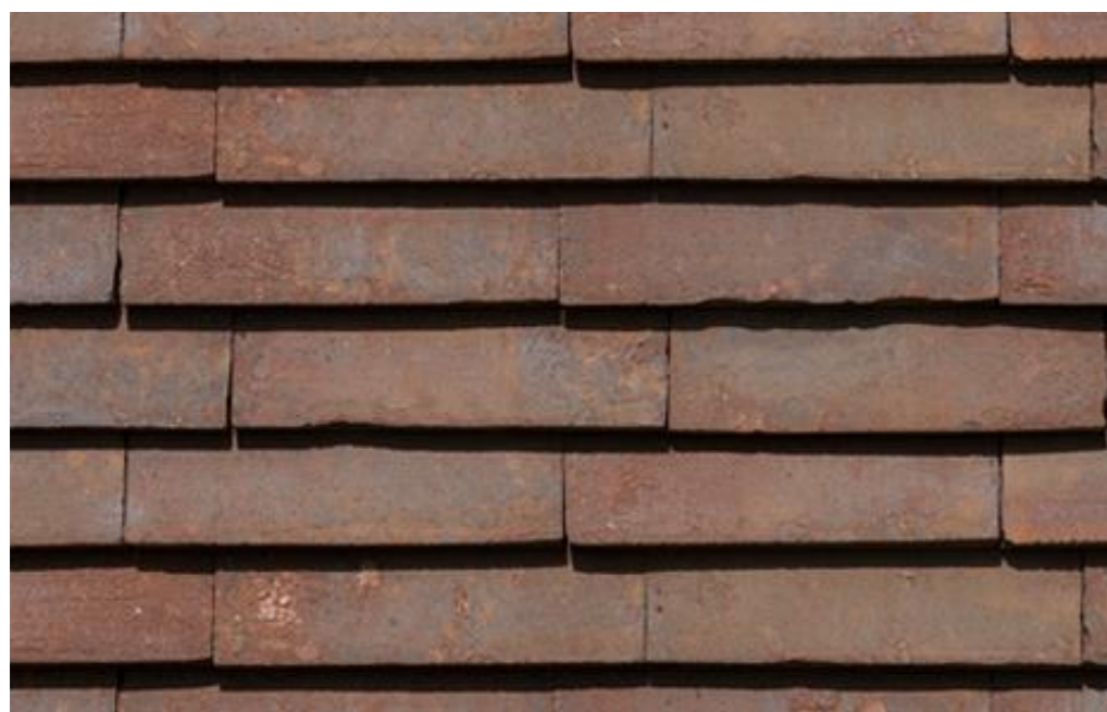
Materiaalsuggestie: keramische leipannen; 528 x 240 mm