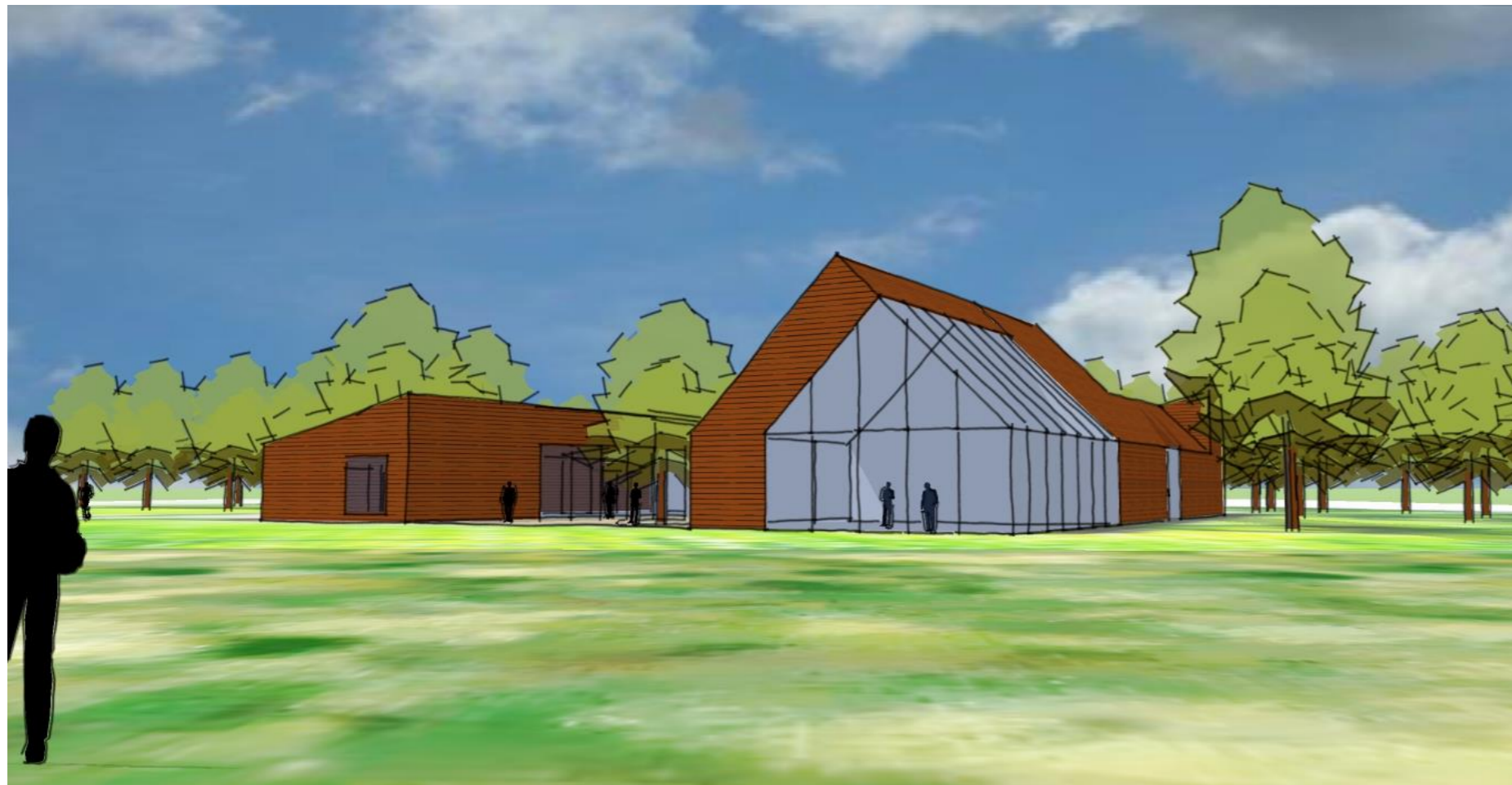
Impressies van de zuidoostgevels