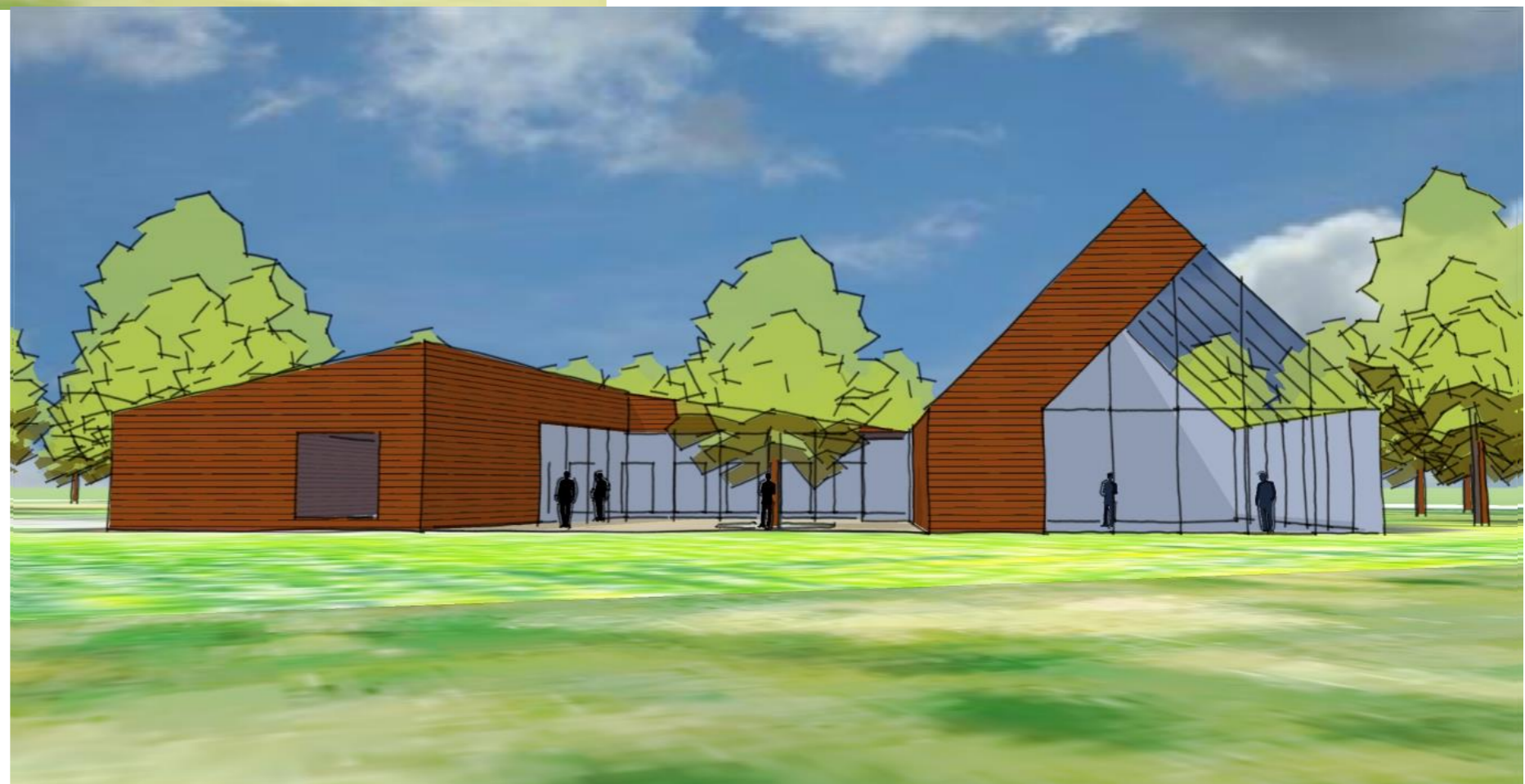
Impressies van de zuidgevels