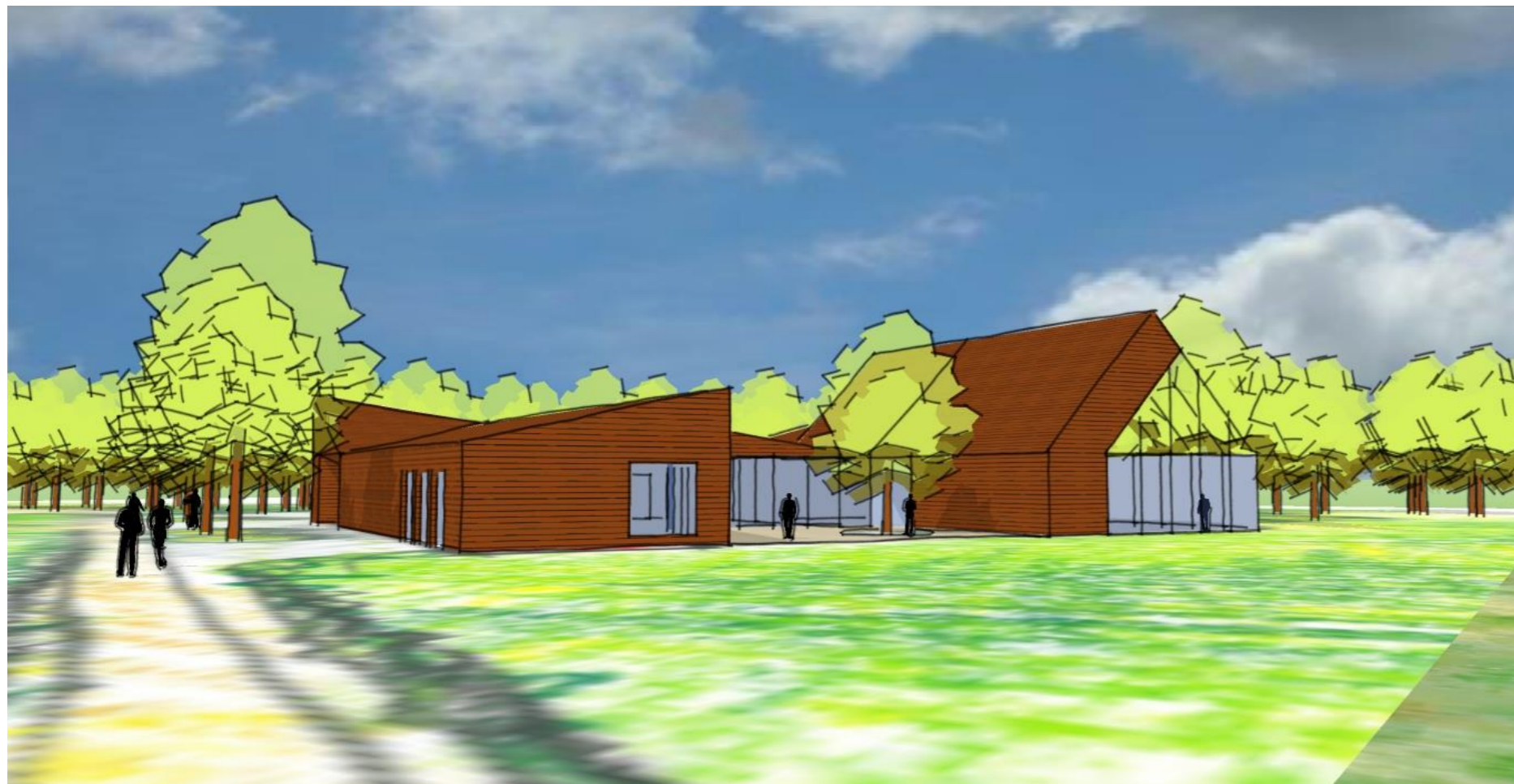
Gebouw vanaf het "karrespoor" aanrijroute.