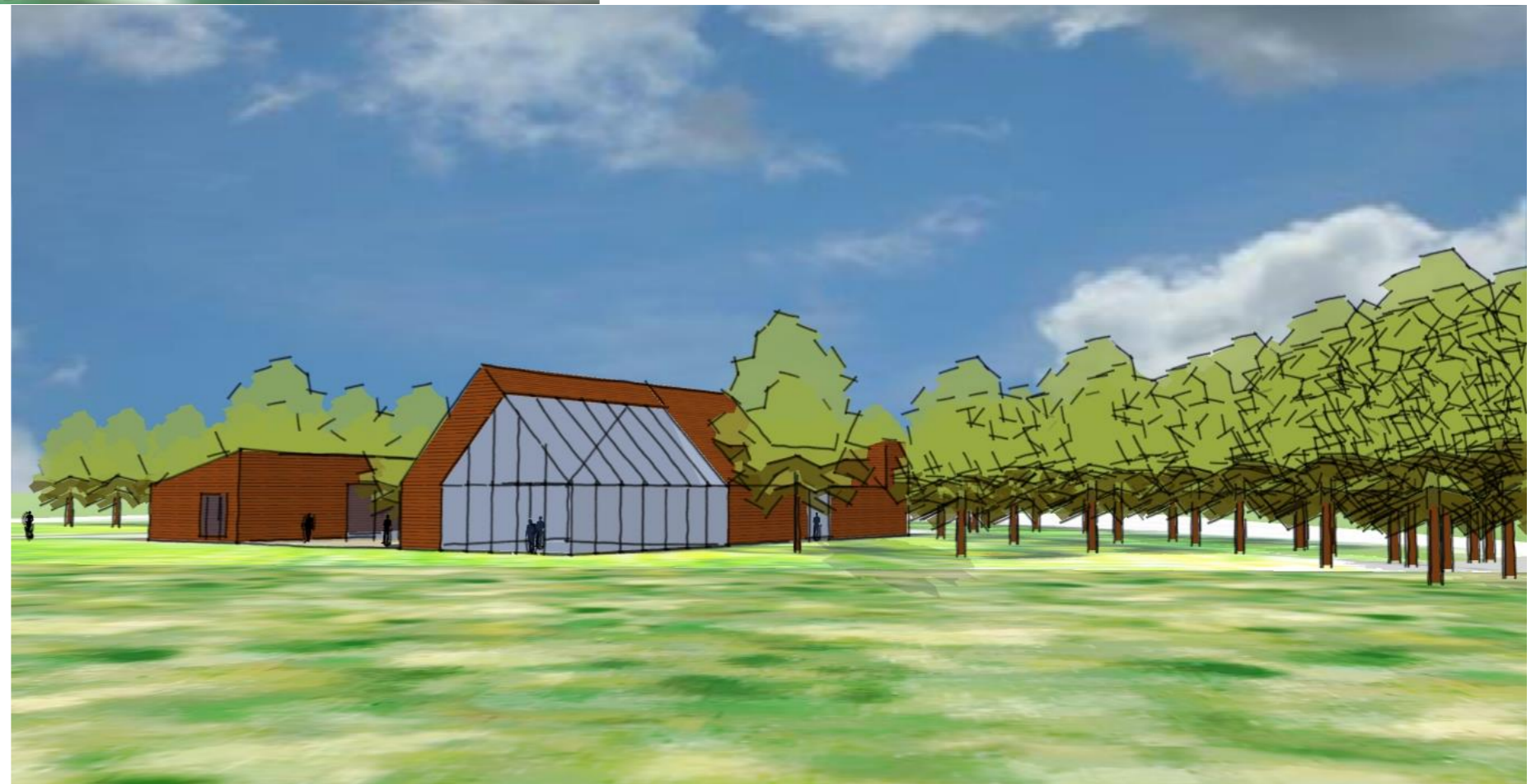
Zicht op de ceremonie ruimte