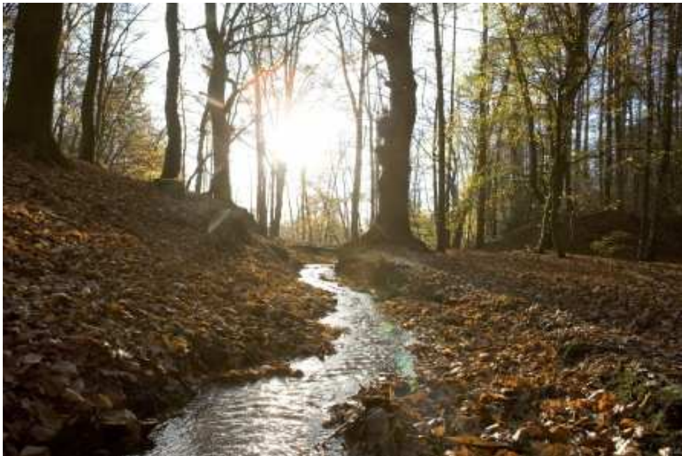
Natura 2000-gebied Sint Jansberg