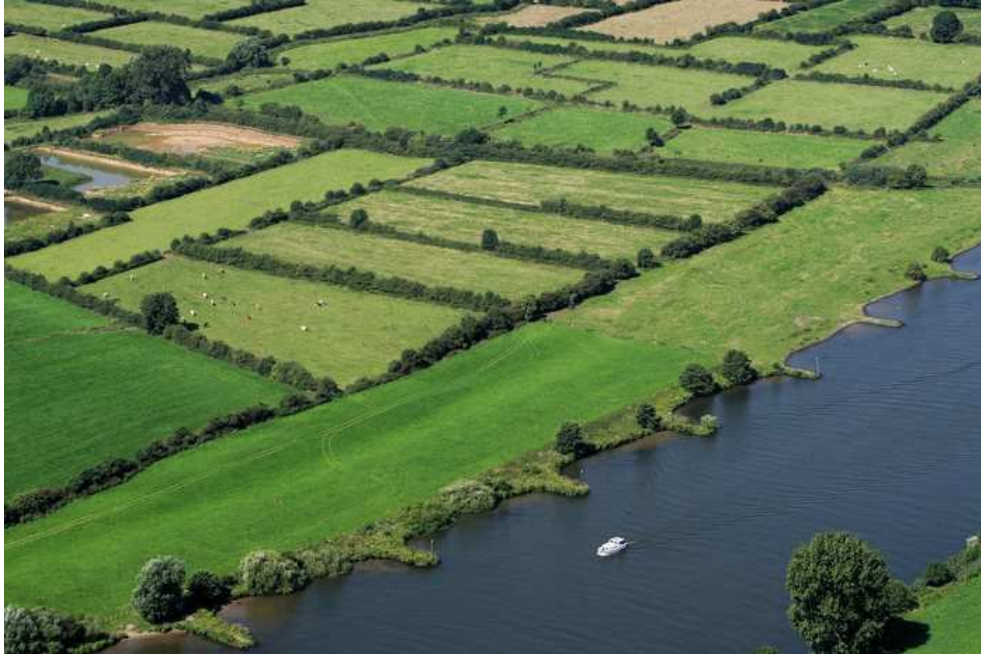
Natura 2000-gebied Oeffelter Meent