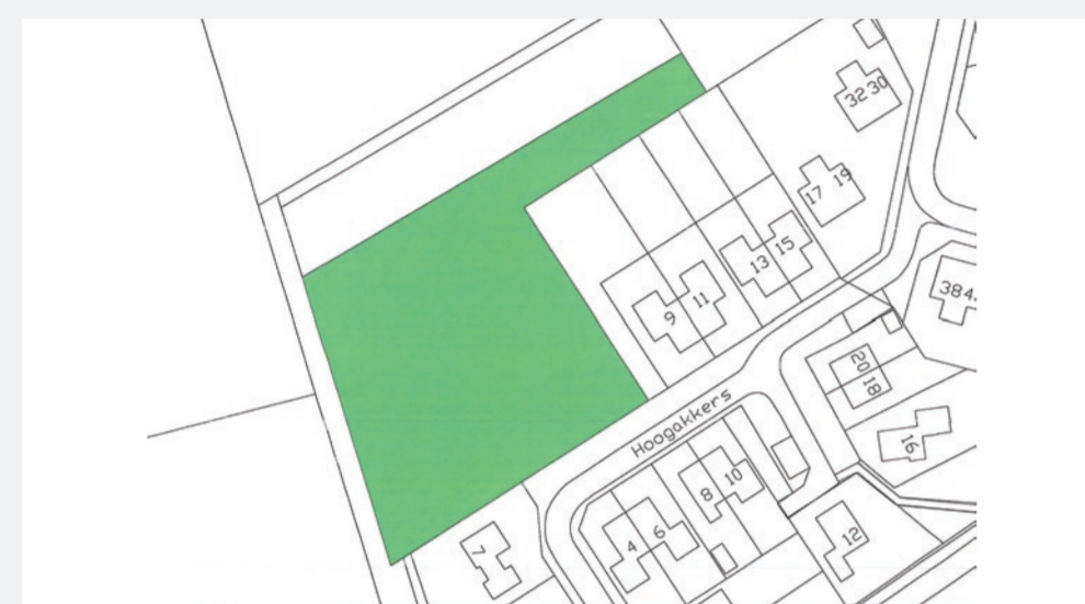
2. Het plangebied is met een groene kleur op de kadastrale kaart aangegeven.