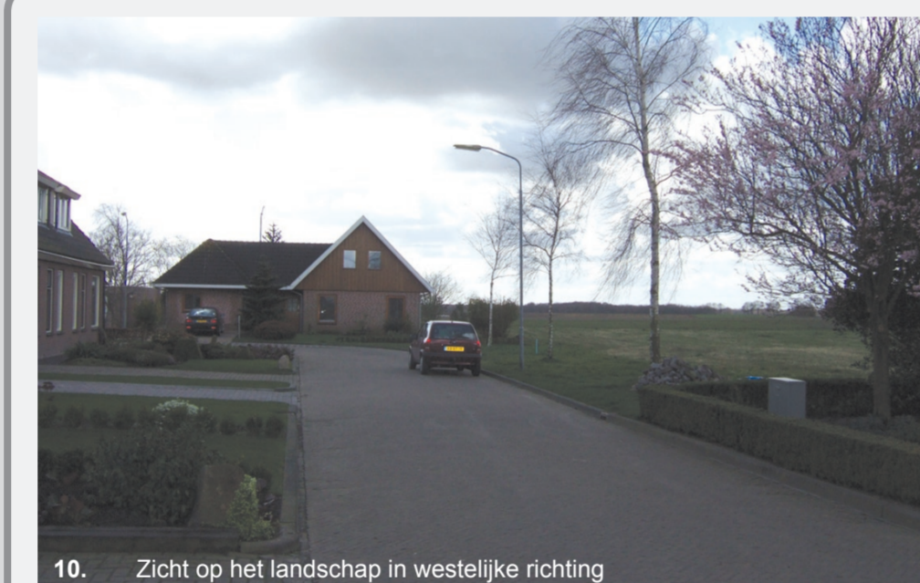
10. Zicht op het landschap in westelijke richting