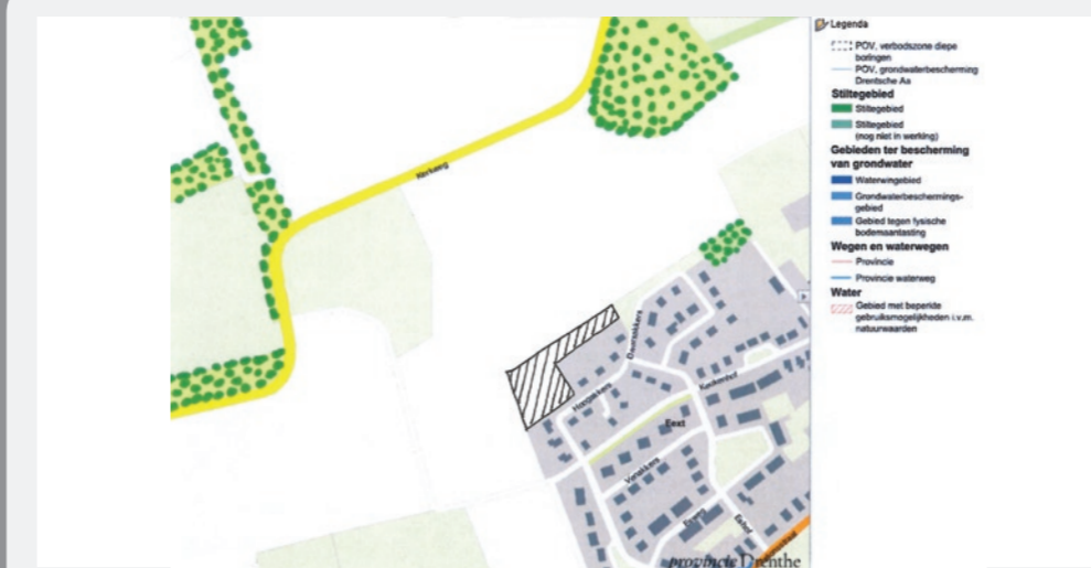
5. Gedeelte van de kaart van de Provinciale Omgevingsverordening. In de nabijheid van het plangebied, langs de Kerkweg liggen houtwallen en bospercelen.