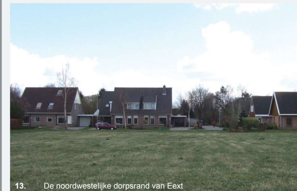
13. De noordwestelijke dorpsrand van Eext

Tussen de bouwvlakken wordt een grote vijver aangelegd. Op deze manier wordt voorkomen dat de doorkijk naar het landschap dichtslibt. De tuinen worden beplant met gras, laag blijvende kruiden, bodembedekkers, bloemen en enkele solitaire bomen. Ook zullen daarin enkele terrassen worden aangelegd. Langs de Hoogakkers komen lage hagen als erfafscheiding die aansluiten op de bestaande hagen op omliggende percelen.