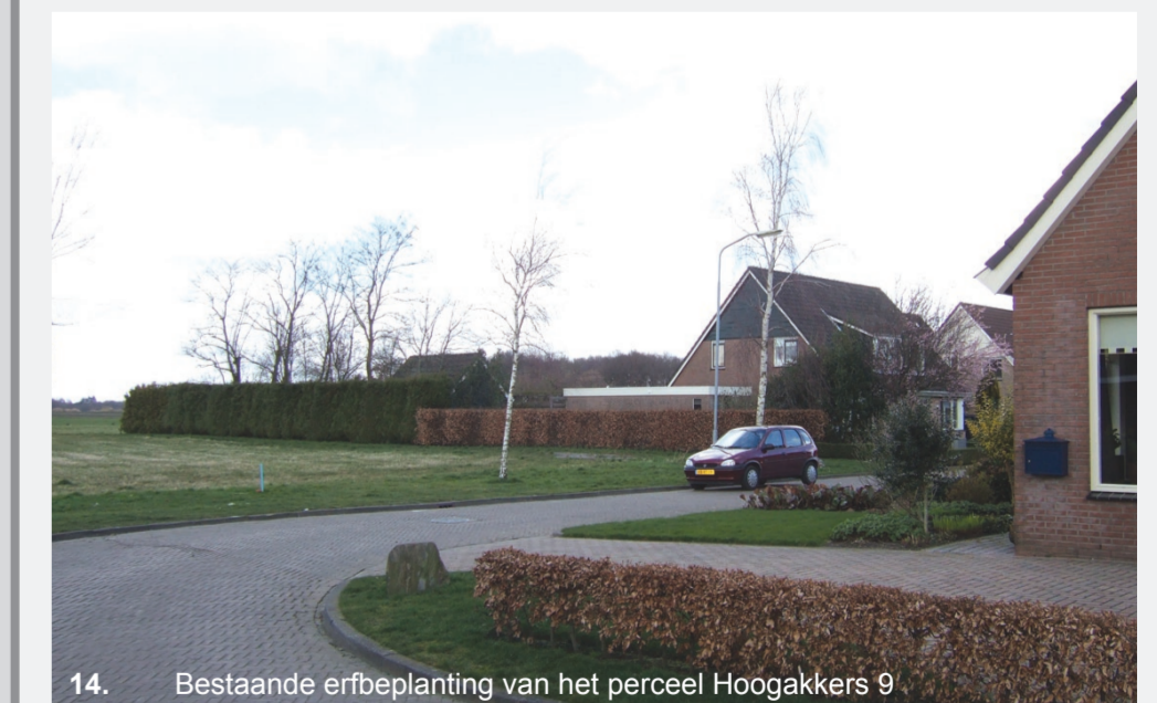
14. Bestaande erfbeplanting van het perceel Hoogakkers 9

De bereidheid is aanwezig om de strook grond achter Hoogakkers nummers 9 tot en met 15 te verkopen aan de eigenaren van de betreffende percelen.