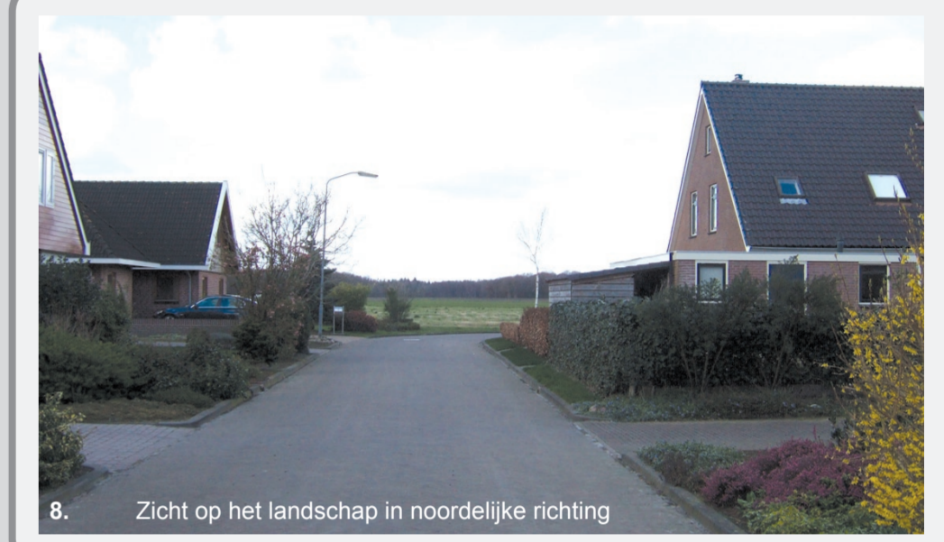
8. Zicht op het landschap in noordelijke richting