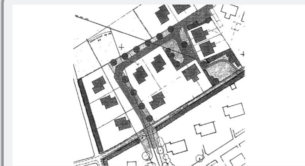
3. Schetsplan 'Uitwerking Eext NW 2'.