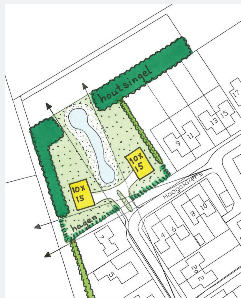
9. Schetsplan voor de inrichting van het hele perceel.