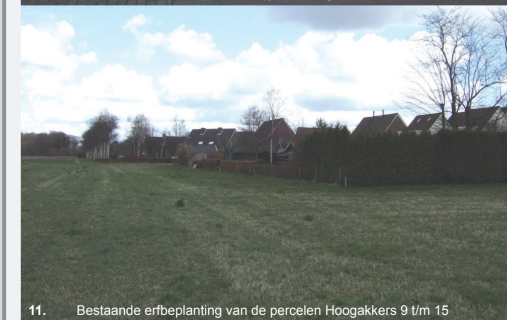
11. Bestaande erfbeplanting van de percelen Hoogakkers 9 t/m 15