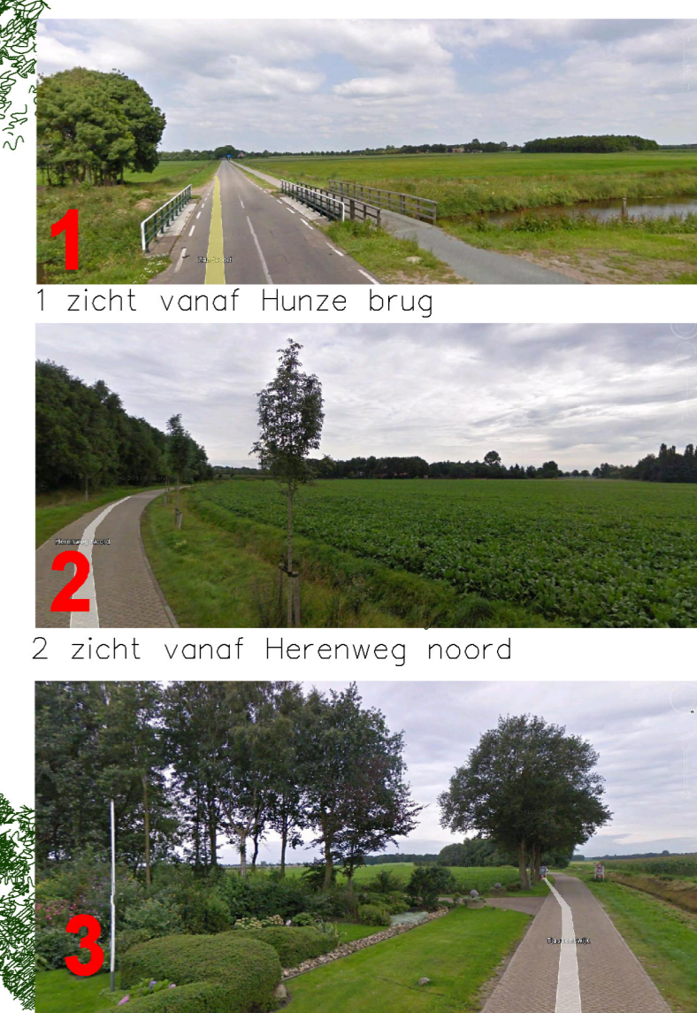
1 zicht vanaf Hunze brug

Deze ingrepen zorgen voor een goede en verantwoorde inpassing, die recht doet aan deze plek en aan de rand van het dorp.