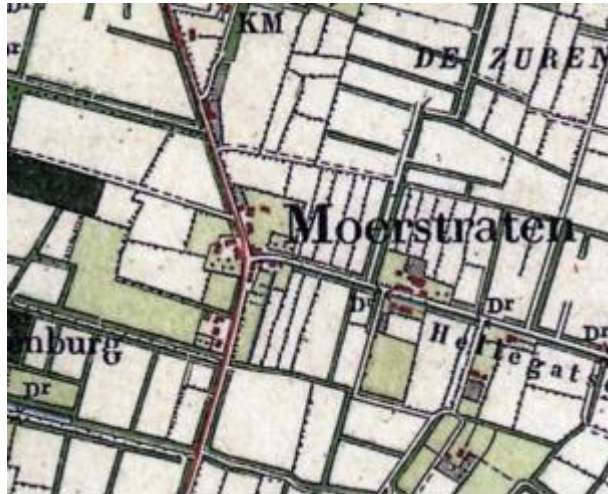
Afbeelding: Bebouwingsstructuur Moerstraten ca. 1850