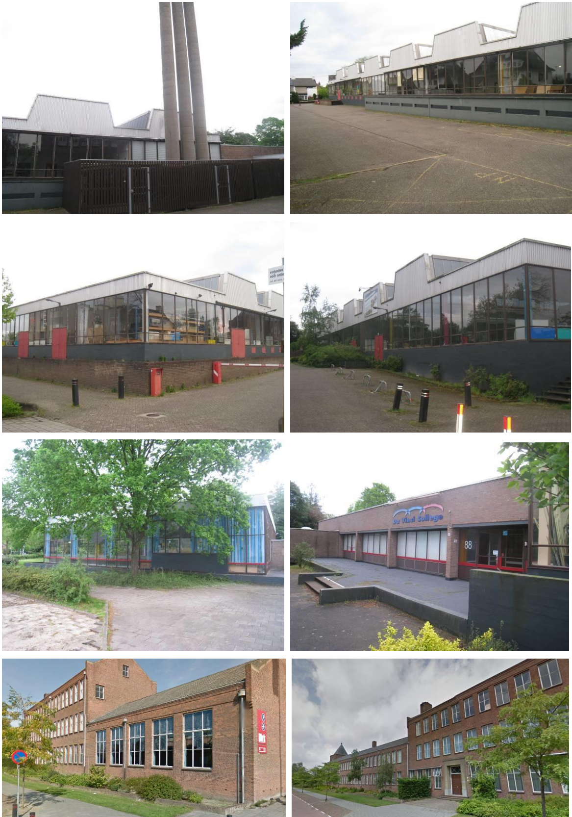
Figuur 2. Aanzicht van LTS Rosendaal (onderste twee foto's; te behouden bebouwing).