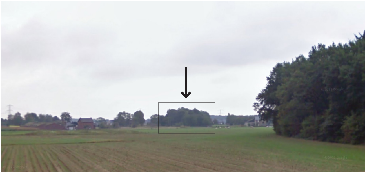
Aanzicht van het plangebied vanuit het oosten.