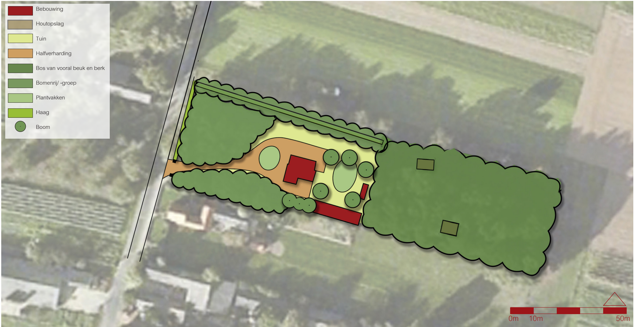
Schematische weergave huidige situatie