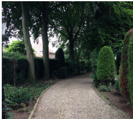
Grindpad naar achterom, zicht op noordelijke perceelsgrens