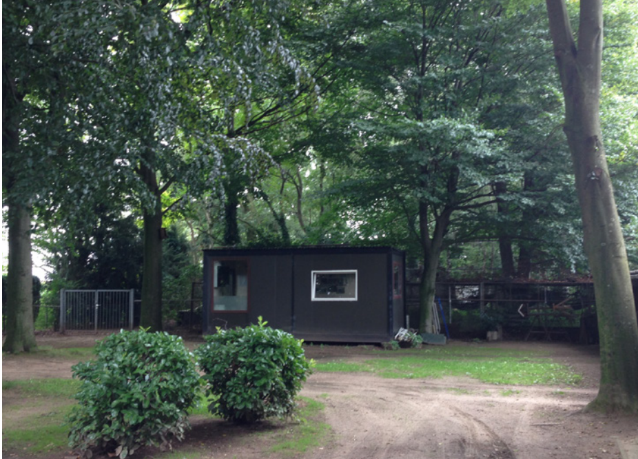
Achtertuint met daarachter het bosperceel.