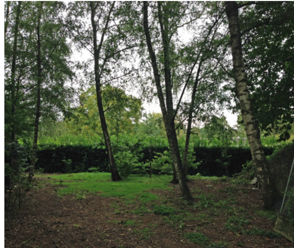
Bosperceel aan de achterzijde op de locatie.