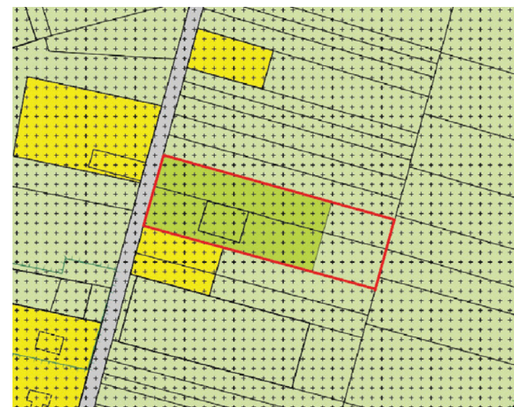
Planlocatie in het vigerend bestemmingsplan

Het plangebied ligt ten noorden van Montfort. Het huis is te bereiken vanaf de Linnerweg.