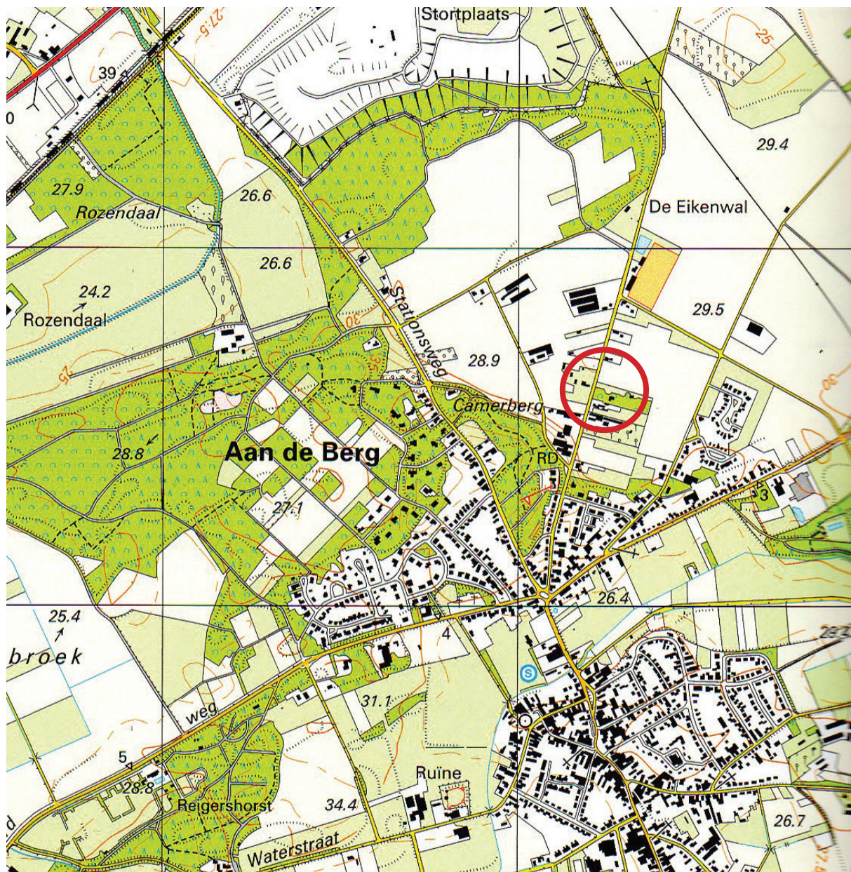
Ligging plangebied (Topografische kaart 2004)