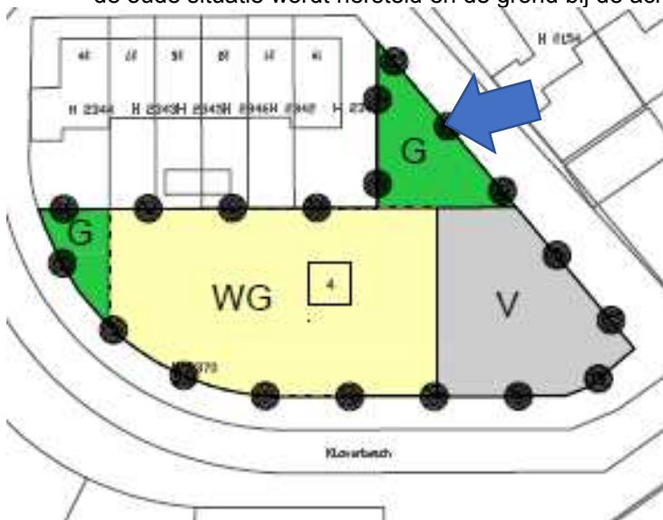
Afb. 3. Uitsnede verbeelding de Hasselt