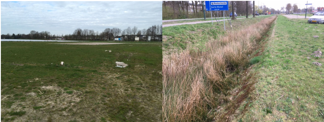
Foto impressie van deelgebied C.