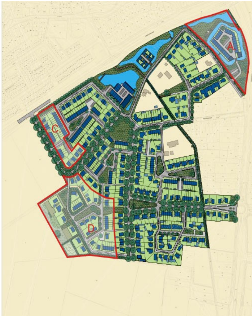
Figuur 1. Overzichtskartaal van de voorziene eindsituatie op nieuwbouwlocatie Beekse Akkers met daarin aangegeven de drie plangebieden A, C en D (rood omlijnd).

Alle drie de terreinen liggen braak. Langs deelgebied A en C ligt een smalle perceelsloot / bermsloot met steile oevers. Opgaande beplanting en bebouwing ontbreekt.