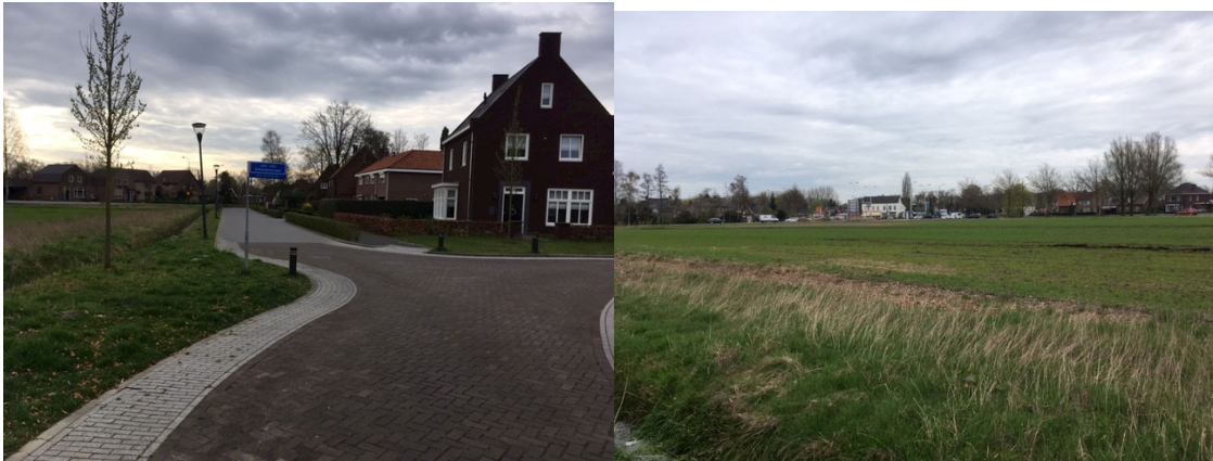
Foto impressie van deelgebied A.