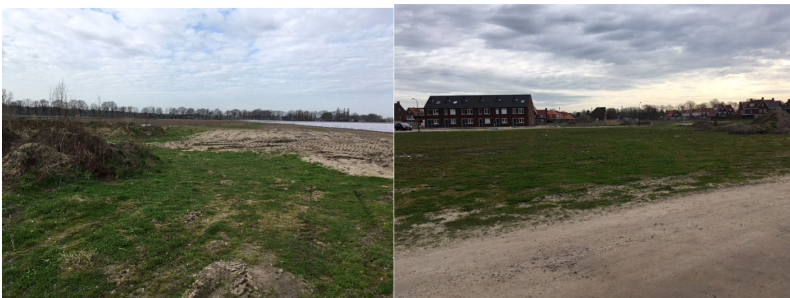
Foto impressie van deelgebied D.