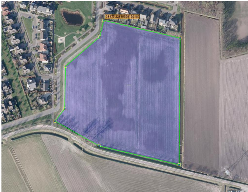
Figuur 1: Overzicht plangebied Albano Lob C

Het ontwerp-wijzigingsplan Albano Lob C Oudenbosch ziet toe op het juridisch-planologisch mogelijk maken van 68 nieuwbouw woningen. Het braakliggend (akkerland/grasland) plangebied ligt aan de zuidoostzijde van de kern Oudenbosch (gemeente Halderberge) en heeft een oppervlakte van circa 3,9 ha. Het plangebied wordt aan de westzijde begrensd door de Acer Flamingolaan, aan de zuidzijde door de Albanoweg, aan de noordzijde door tuinen van de percelen aan de Kwekerssingel en aan de oostzijde door een waterloop categorie A van waterschap Brabantse Delta.