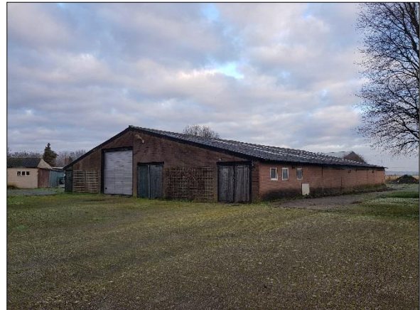
Figuur 5. Te slopen grote schuur gezien vanaf zuiden