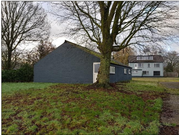
Figuur 4. Te behouden kleine schuur en woning gezien vanaf noorden