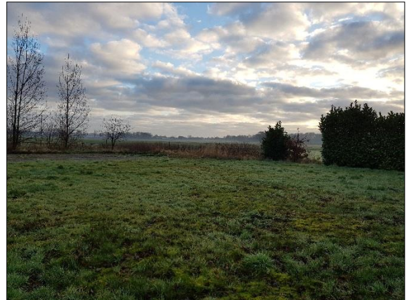
Figuur 7. Achter- en naastgelegen weilanden gezien vanuit het zuidwesten