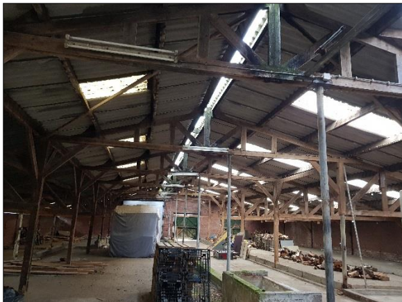
Figuur 8. Binnenkant te slopen grote schuur