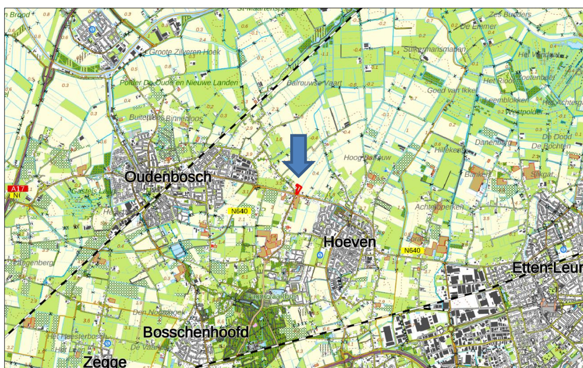
Figuur 1. Topografische kaart ligging van het plangebied (1:25.000)

Het plangebied is gelegen aan de noordwestzijde van de kom Hoeven en grenst aan de N640, welke de kern Hoeven verbindt met de kern Oudenbosch. In figuur 1 is de topografische ligging van het plangebied weergegeven.