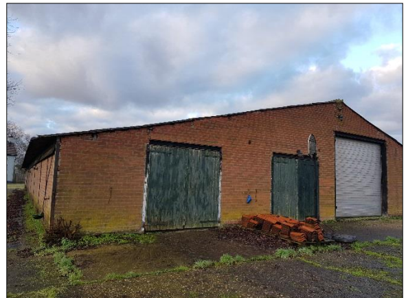
Figuur 9. Achterkant te slopen schuur gezien vanuit het noordoosten