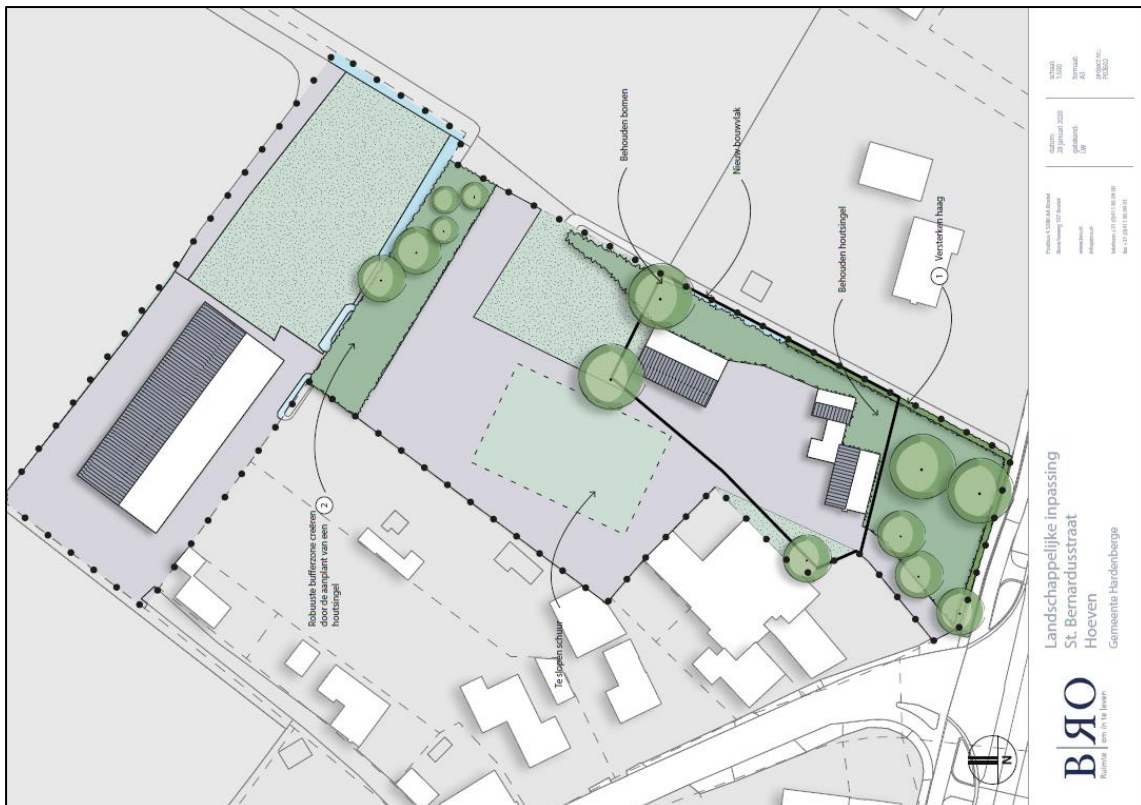
Figuur 3. Toekomstige situatie plangebied