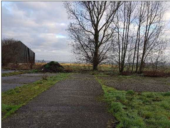
Figuur 6. Achtergelegen weiland gezien vanuit het zuiden