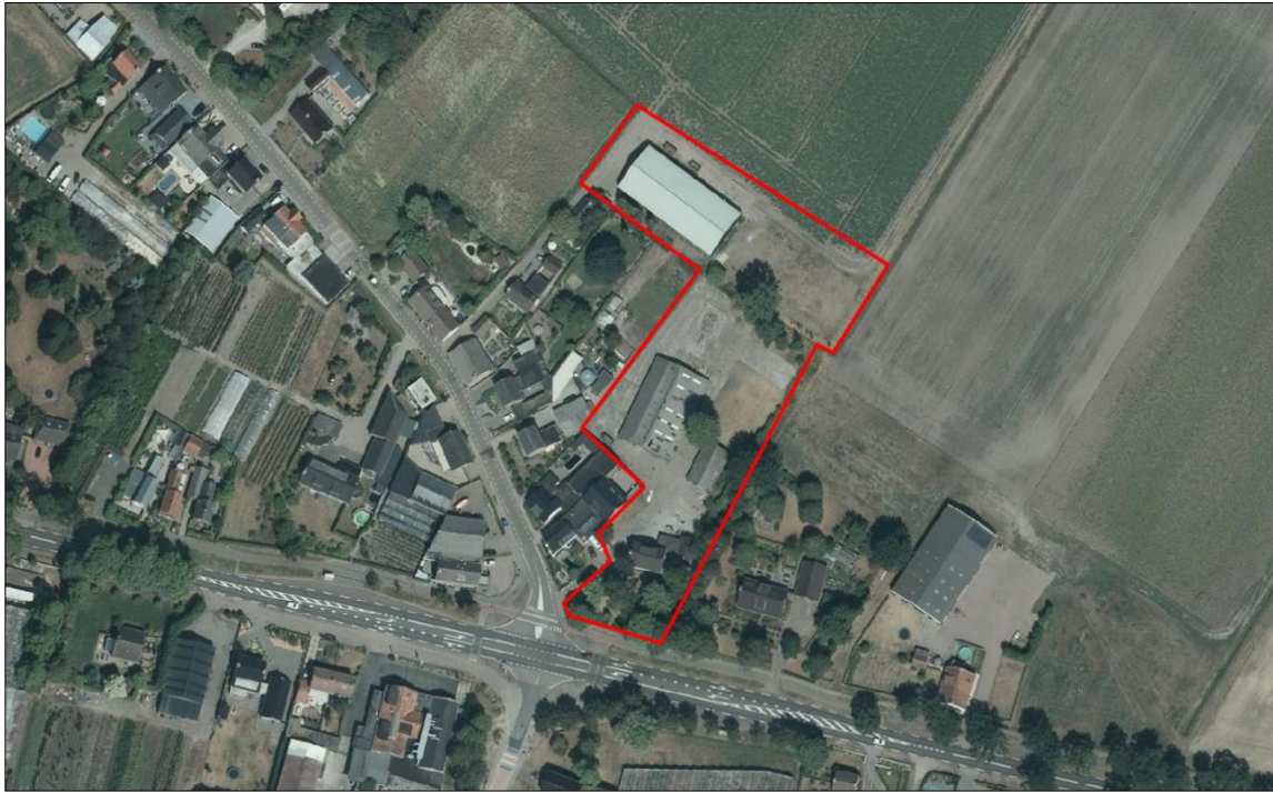
Figuur 2. Luchtfoto van het plangebied en de directe omgeving