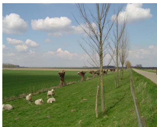
Eén rij jonge bomen met boomkorf op beweide dijk