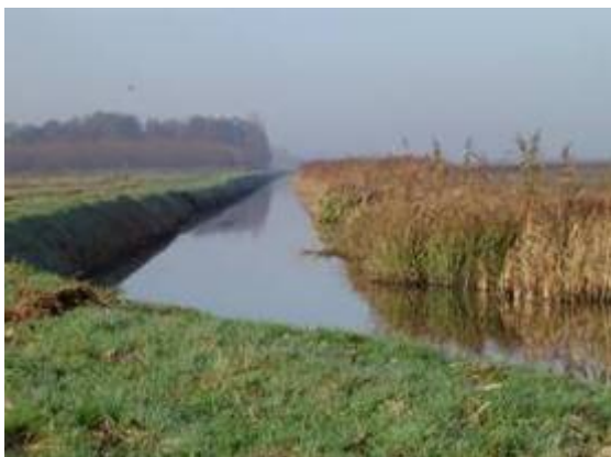
Natuuroever met riet

Een aaneengesloten natuurvriendelijk ingerichte oever langs een bestaande waterloop, in de vorm van een plas- of drasberm, waarvan de vegetatie voor tenminste 50% uit riet en/of lisdodde bestaat.