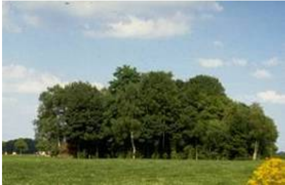
Klein vrijliggend bosje

Het is een vrijliggend vlakvormig landschapselement met een opgaande begroeiing van inheemse bomen en struiken met een bedekking van minimaal 80%.