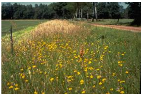
Zandweg met bloemrijke bermen

Een onverharde weg met bloemrijke bermen is een zandweg of weg met halfverharding met aan een of beide zijden een berm met een gevarieerde kruidachtige begroeiing van inheemse grassen en kruiden die jaarlijks gemaaid wordt. Verspreid kunnen struiken of bomen aanwezig zijn maar niet voldoende om aan de eisen van het andere zandwegpakket te voldoen.