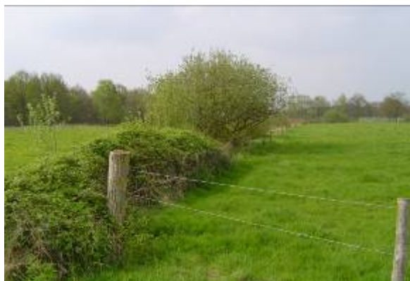
Graslandflora- en faunarand

Een graslandflora- en faunarand is aaneengesloten rand met een mozaïek van struweel (bramen en/of inheemse struiken) en een kruidachtige begroeiing van inheemse grassen en kruiden.