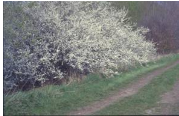
Struweelhaag met sleedoorn