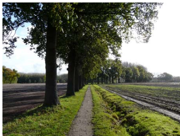
Bomenrij langs perceelsgrens