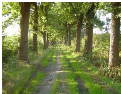
Zandweg met 2 rijen bomen