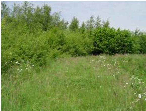
Kruidenrijke zoom langs bosje

Een kruidenrijke zoom is een aaneengesloten rand met extensief onbemest hooiland/ruigte bestaande uit een gevarieerde kruidachtige begroeiing van inheemse grassen en kruiden (inclusief braam) met een minimale bedekking van 80% langs een landschapspakket.