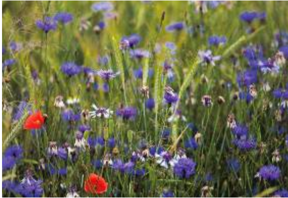
Akkerflora- en faunarand met korenbloem en klaproos

Een akkerflora- en faunarand is een aaneengesloten rand die jaarlijks ingezaaid wordt met granen, niet zijnde maïs, of een akkerrandenmengsel