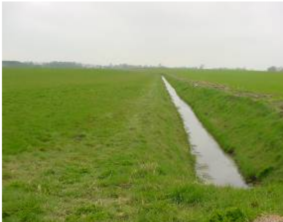
Actief randenbeheerstrook langs grasland

Een rand langs een watervoerende sloot met als doel emissiebeperking van meststoffen en bestrijdingsmiddelen naar oppervlaktewater (inclusief talud) waar agrobiodiversiteitsontwikkeling plaatsvindt.