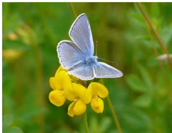
Blauwtje op rolklaver