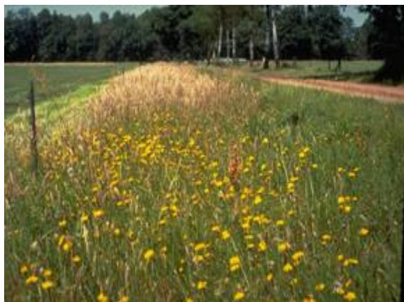
Bloemrijke rand langs perceel

Een bloemrijke rand is een aaneengesloten rand langs een perceelrand of landschapspakket met een gevarieerde kruidachtige begroeiing van inheemse grassen en kruiden die jaarlijks gemaaid wordt.