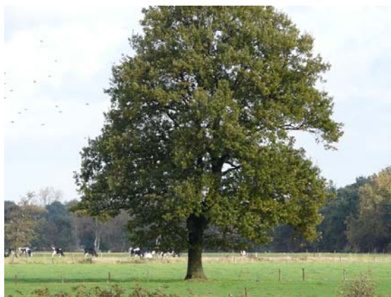
Soiltaire boom in weiland

Een solitaire landschapsboom is een alleenstaande inheemse loofboom, niet zijnde een knotboom, die doorgaans in een vrij grote, open ruimte staat. In geval er langs een perceelsgrens of in een groep minder dan 10 bomen staan worden alle bomen als solitaire boom beschouwd. De boom staat niet in een ander landschapspakket waarbij de beheersvergoeding gerelateerd is aan de oppervlakte (zoals houtsingel en hakhoutbosje).