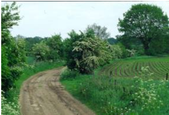
Struweelhagen met meidoorn

Het is een vrijliggend lijnvormig landschapselement met een aaneengesloten begroeiing van inheemse, overwegend doornachtige struiken met een bedekking van minimaal 80%.