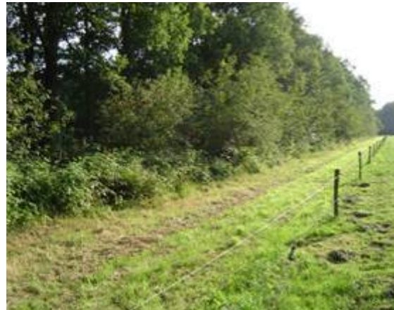
Gemaaide zoom langs houtsingel