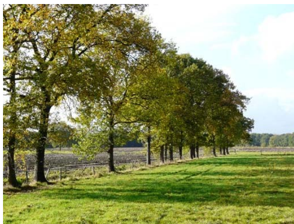
Bomenrij langs perceelsgrens

Een boomgroep is een groep bomen die als het ware als een solitair opgroeit; hun kronen lijken een geheel te vormen. De afstand tussen de bomen is minimaal 5 meter. De grond onder de bomen kent geen agrarisch gebruik.