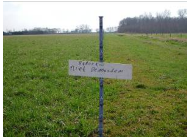
Actief randenbeheerstrook langs grasland