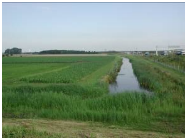
Actief randenbeheerstrook langs bouwland

Een rand langs een watervoerende sloot met als doel emissiebeperking van meststoffen en bestrijdingsmiddelen naar oppervlaktewater (inclusief talud) waar agrobiodiversiteitsontwikkeling plaatsvindt.