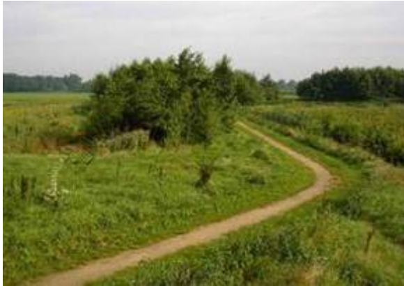
Wandelpad in combinatie met natuurzone over boerenland

Een wandelpad over boerenland is een toegankelijk pad voor wandelaars dat over agrarische gronden loopt.