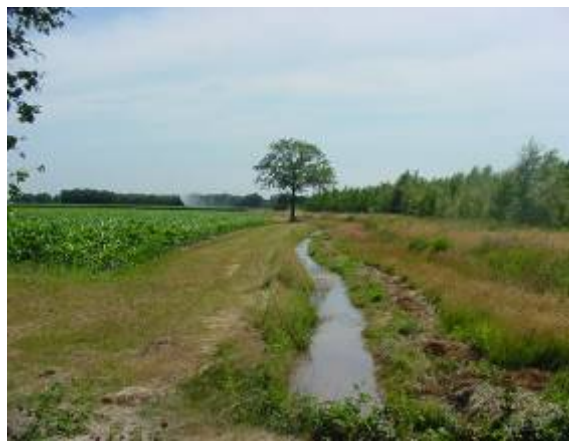
Actief randenbeheer langs mais