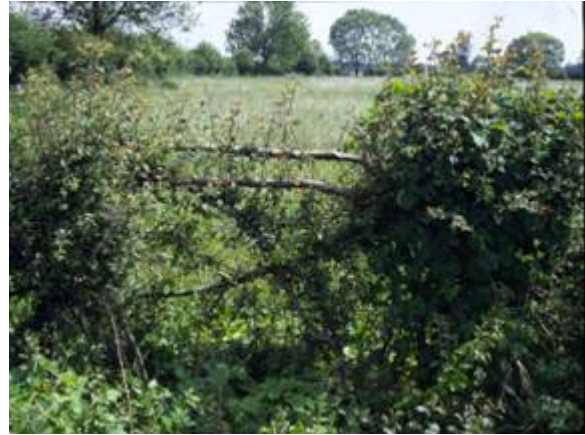
Heg van meidoorn