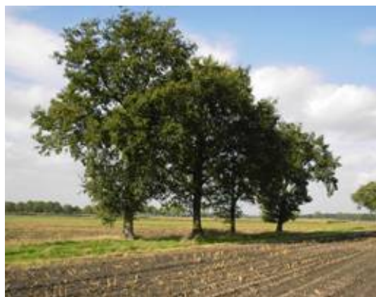
Enkele solitaire bomen langs perceelsgrens