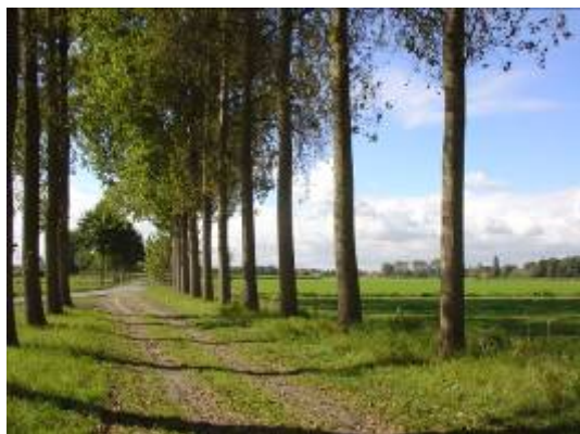
Zandweg met 2 rijen bomen

Een onverharde weg met bomen is een zandweg of weg met halfverharding met aan een of beide zijden een berm met een rij inheemse bomen. Per 25 meter zandweg zijn er minimaal 3 inheemse bomen met een doorsnede van minimaal 20 cm aanwezig.