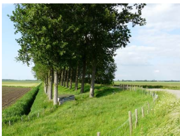
Twee rijen bomen op beweide dijk

Een boomgroep is een groep bomen die als het ware als een solitair opgroeit; hun kronen lijken een geheel te vormen. De afstand tussen de bomen is minimaal 5 meter. De onderbegroeiing van de boomgroep bestaat uit grasland.