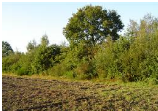
Hakhoutsingel met enkele overstaander