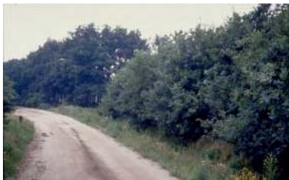
Hakhoutsingel zonder overstanders

Het is een vrijliggend lijnvormig aaneengesloten landschapselement, met een opgaande begroeiing van inheemse bomen en/of struiken met een bedekking van minimaal 90%, dat als hakhout wordt beheerd.