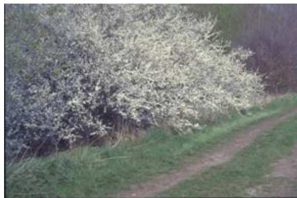
Struweelhaag met sleedoorn