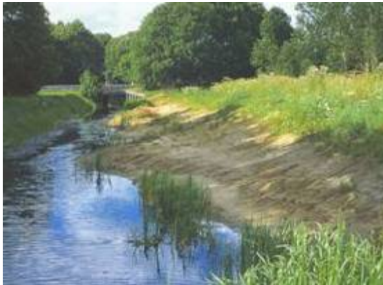
Waterloop met flauw talud

Een aaneengesloten natuurvriendelijk ingerichte oever langs een bestaande waterloop, in de vorm van een drasberm of flauwe oever, waarvan de vegetatie bestaat uit inheemse plantensoorten van natte graslanden en ruigten.