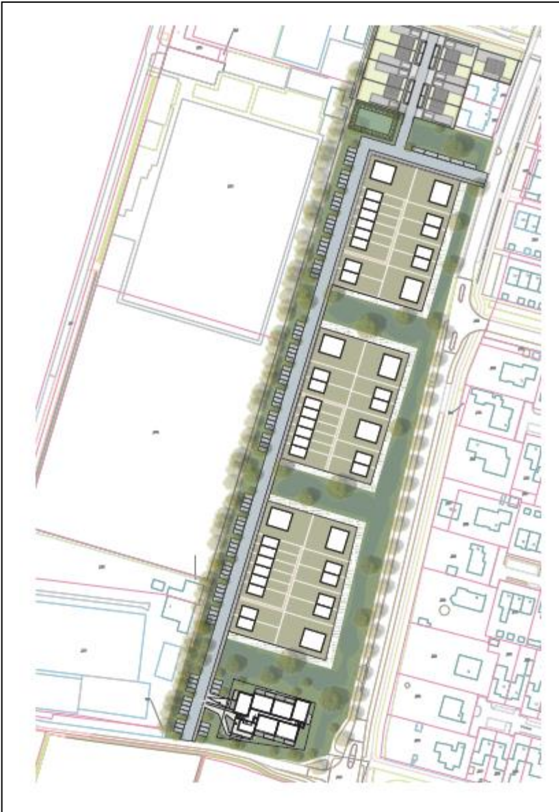
Figuur 1. Ligging planlocatie

De gemeente Halderberge is voornemens om woningen langs de sportvelden van korfbalvereniging Springfield, voetbalvereniging Hoeven en tennisvereniging Pagnevaart aan de Bovendonksestraat te bouwen. Dit initiatief past niet binnen het geldende bestemmingsplan 'Kom Hoeven' (vastgesteld 07-05-2014). Om de ontwikkeling mogelijk te maken wordt een ruimtelijke procedure doorlopen. Aangezien de woningen op korte afstand van de sportvelden komen te liggen dient het aspect geluid in de ruimtelijke onderbouwing van het bestemmingsplan aan de orde te komen. Hiervoor is een akoestisch onderzoek uitgevoerd. In onderstaand figuur 1 is het plangebied 'Bovendonksestraat' aangegeven.