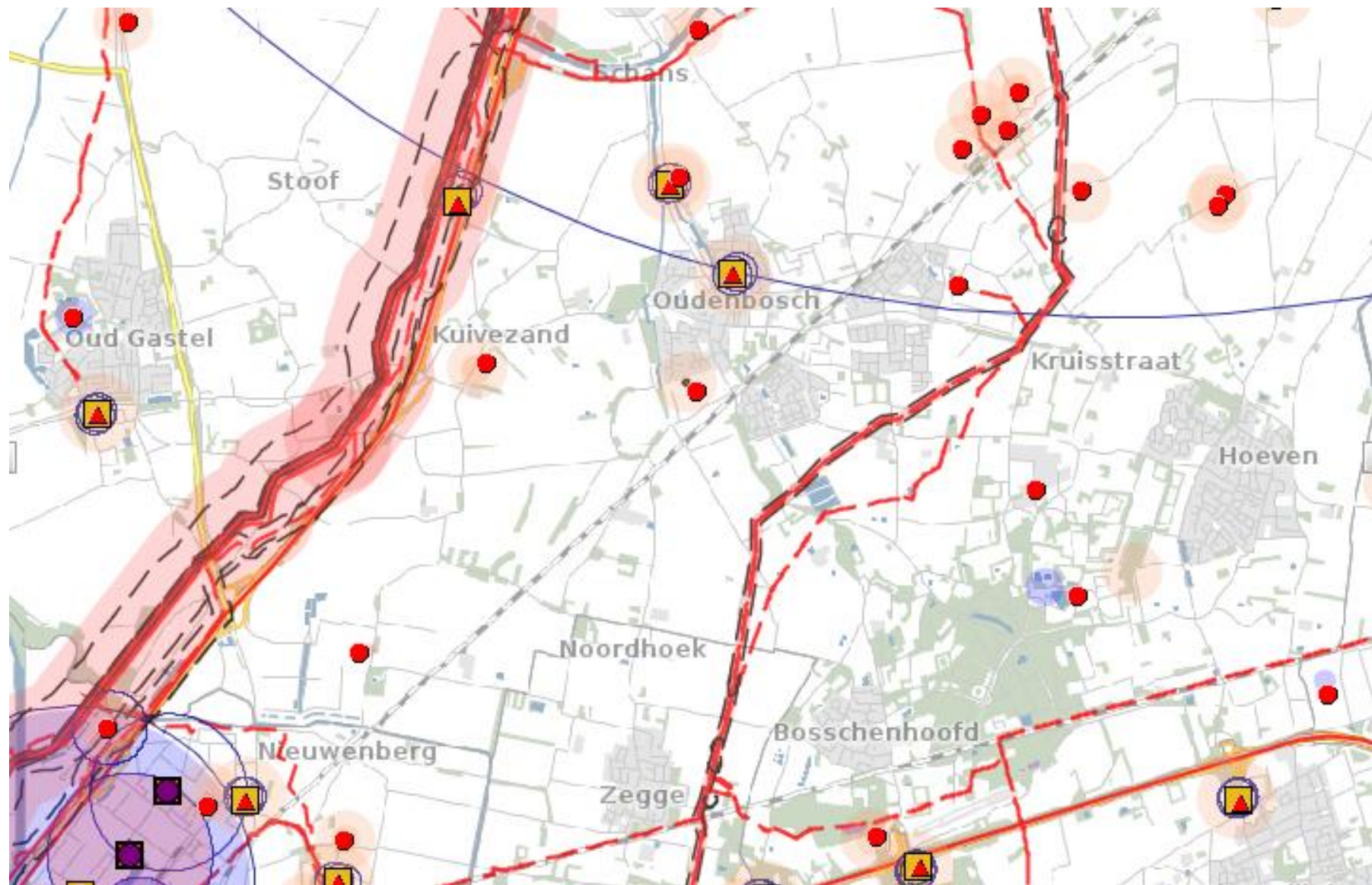
Bijlage 5 Risicokaart Gemeente: Halderberge