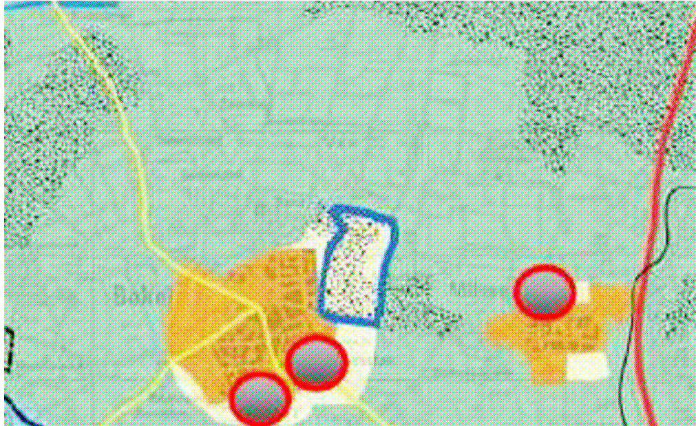
Figuur 2: fragment uitwerkingplan zuidoost Brabant / regionaal structuurplan

De kern Bakel is in dit plan aangeduid als 'te beheren en intensiveren stedelijk gebied'. De locatie ligt in dit gebied. Geconcludeerd kan worden, dat voorliggend plan past binnen het Uitwerkingsplan Zuidoost-Brabant / Regionaal Structuurplan.